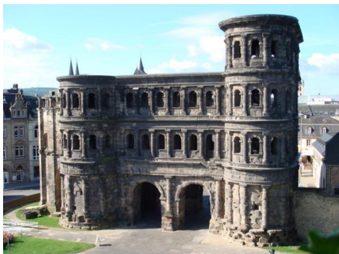
Slika 5. Porta Nigra