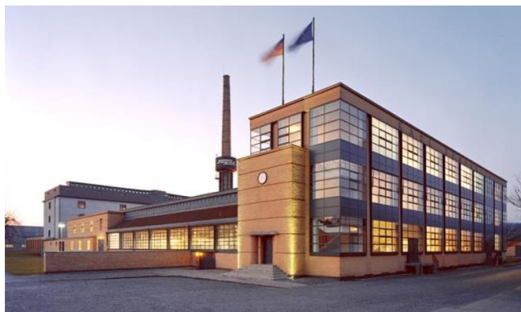
Slika 11. Tvornica Fagus