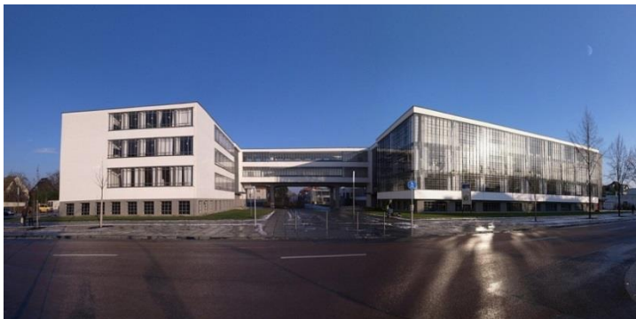
Slika 12. Zgrade Bauhauusa u Dessau