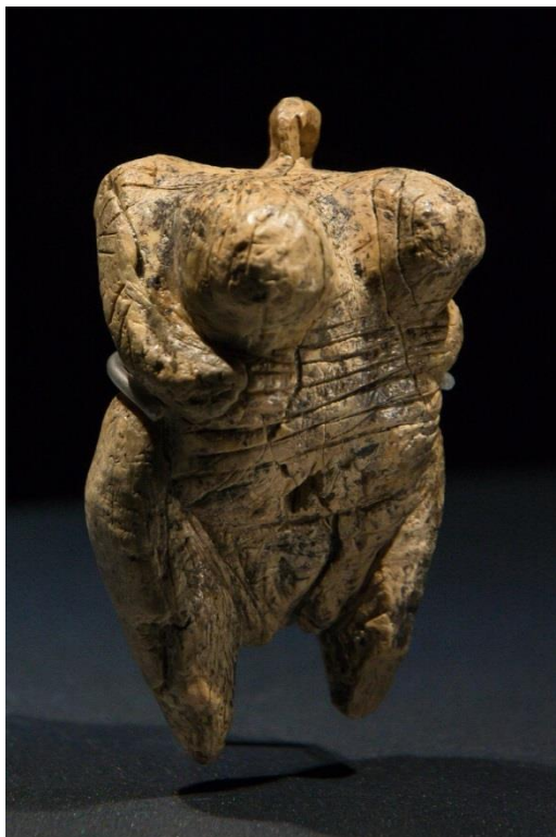
Slika 10. Figurica Venere iz Hohle Felsa