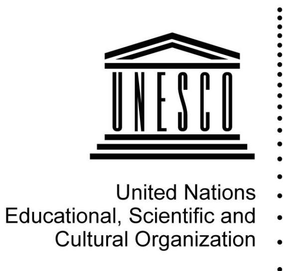
Slika 2. UNESCO-v logo