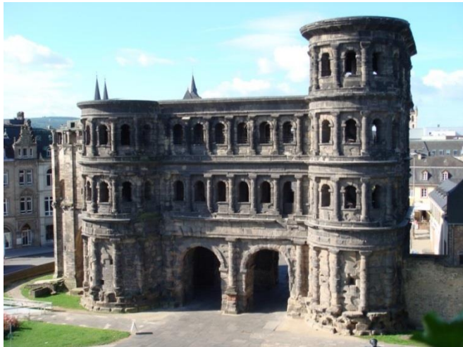
Slika 5. Porta Nigra