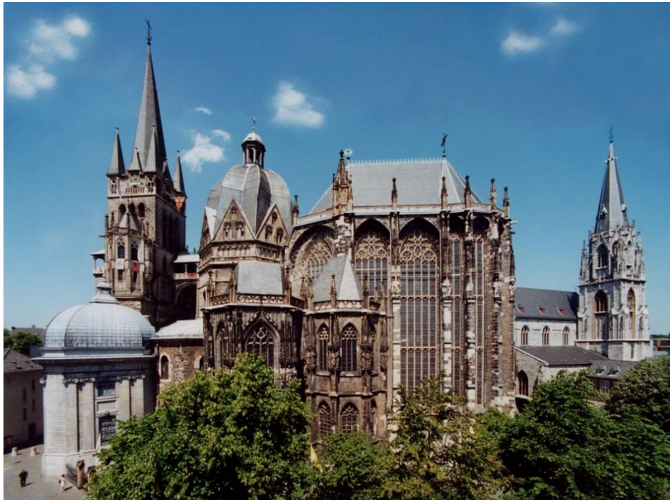
Slika 4. Aachenska katedrala