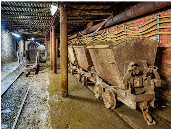
Slika 7. Rudnici Rammelsberga