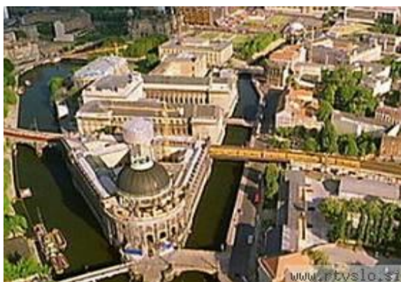
Slika 9. Muzejski otok