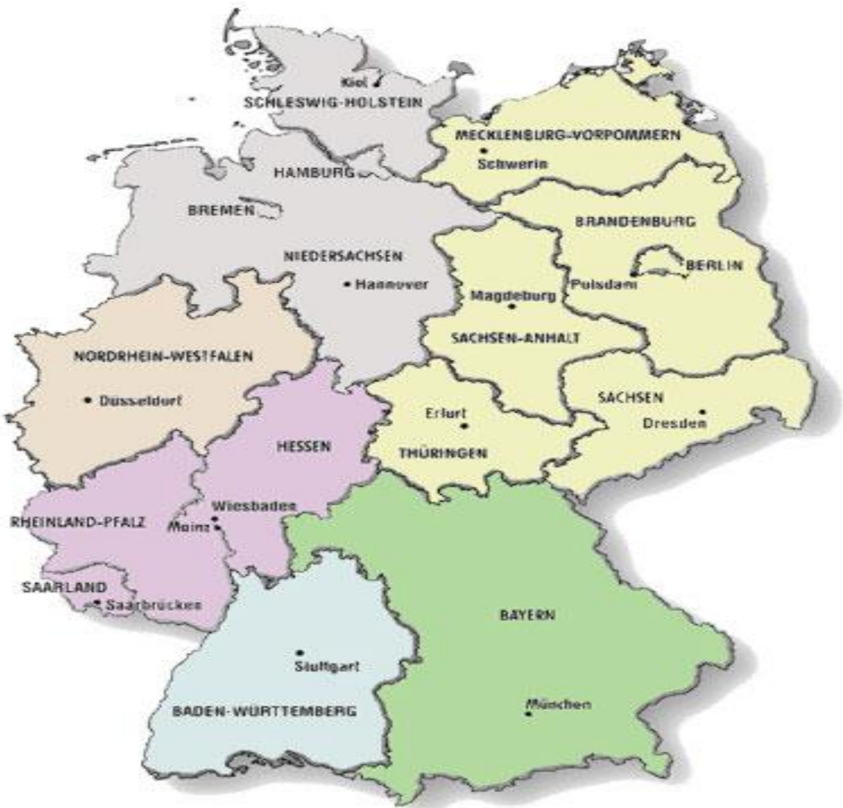
Slika 1. Karta Njemačke