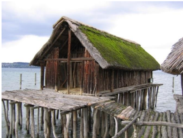
Slika 8. Sojenica