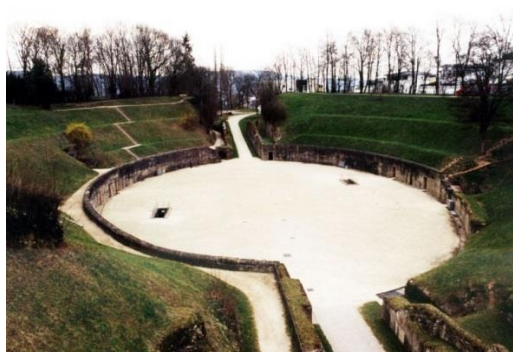
Slika 6. Rimski amfiteatar