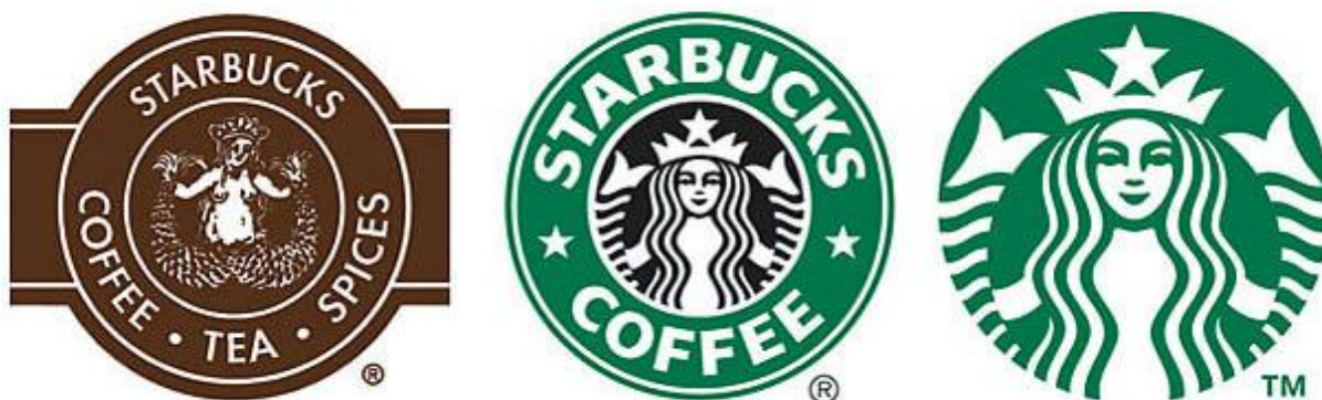
Slika 5. Starbucks logo 42

„ Starbucks je globalni gigant u sektoru proizvodnje kave, osnovan 1971. Sjedište mu je u Seattleu. Trenutačno je u pogonu 23.768 poslovnica Starbucks a. Starbucks ov logo ima jedinstven dizajn koji privlači pozornost. Moguće je da je upravo Starbucks ov logo omogućio veliki uspjeh Starbucks u. Originalni logo sadrži sliku sirene koja ima dva repa. Grčka mitologija govori da sirene privlače mornare navodeći ih na brodolom, a to mogu činiti i s obala otoka Sturbuck (koji se nalazi na jugu Tihoga oceana), čije je ime poslužilo za formiranje naziva tvrtke. Od svojih početaka, originalni Sturbucks puno je puta mijenjao logo te je znatno promijenio svoj izgled i dizajn 1987., upravo kad je ime Starbucks Cofee, Tea, Spice zamijenjeno imenom Starbucks . Ipak, glasovita je sirena ostala zauvijek na logu Starbucks a. Logo Starbucks a u obliku je kruga. Dizajn loga nekad je sadržavao ime brenda s dvije zvjezdice. Iako najnoviji logo sadrži sirenu, više nisu u njemu zastupljene zvjezdice, osim što kruna na sireninoj glavi sadrži jednu zvijezdu, kao i na prethodnom dizajnu loga. Starbucks logo preferira bijelu i zelenu boju. Dva sirenina repa su u bijeloj boji, a pozadina je zelena. U prošlosti font loga je bio jednostavan i podebljan. Danas logo ne sadrži riječi, već je predstavljen vrlo pojednostavljeno: figurom bijele sirene na zelenoj podlozi.“ 41