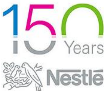
Slika 4. Nestlé logo 40

„Henri Nestlé je jedan od švicarskih poduzetnika koji su izgradili brend na temelju loga. Originalni Nestlé trademark temeljen je na metafori obitelji, što uključuje sliku ptice koja se odmara u gnijezdu. To je referenca na obitelj: „nest“ na njemačkom (kao i na engleskom jeziku) znači „gnijezdo“. Godine 1968. njegov logo uključivao je i tri ptice koje hrani majka čime je želio potaknuti ljude na kupnju njihovih žitnih pahuljica. Danas Nestléov logo o gnijezdu nastavlja biti Nestléov trademark uz eventualne sitne modifikacije. U najnovije vrijeme uz gnijezdo stavljena je i brojka 150, što upućuje na broj godina koje su prošle od nastanka tvrtke.“ 39 Prema sudu autorice ovog rada, Nestléov logo vrlo dobro ocrta sve ono što tvrtka predstavlja: s obzirom da među njezinim proizvodima prevladavaju mliječni proizvodi te proizvodi za dojenčad, razumljivo je da su Nestléovi ciljani korisnici upravo obitelji s (mlađom) djecom. Međutim, može se reći da su proizvodi te tvrtke namijenjeni ne samo obiteljima već općenito svima koji žele uživati u slatkišima.