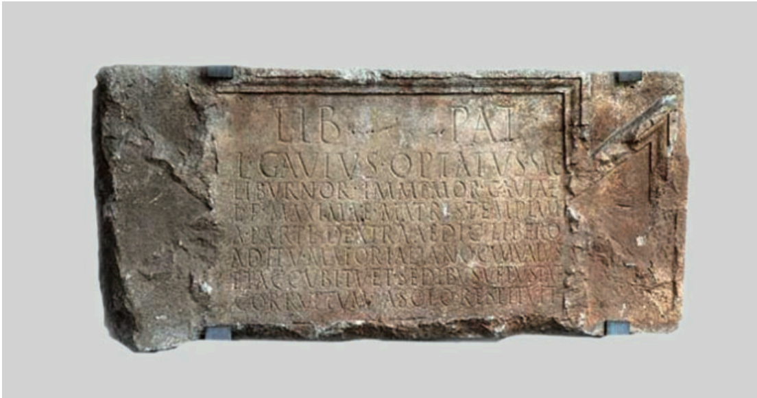
Sl. 7. Natpis Lucija Gavija Optata

immemor(iam) Gaviae / L(uci) f(iliae) Maximae matris templum / a parte dextra aedic(ulae) libero / aditu maiori altano cum valvis / et accubitu et sedibus vetustate / corruptum a salo restituit. 138