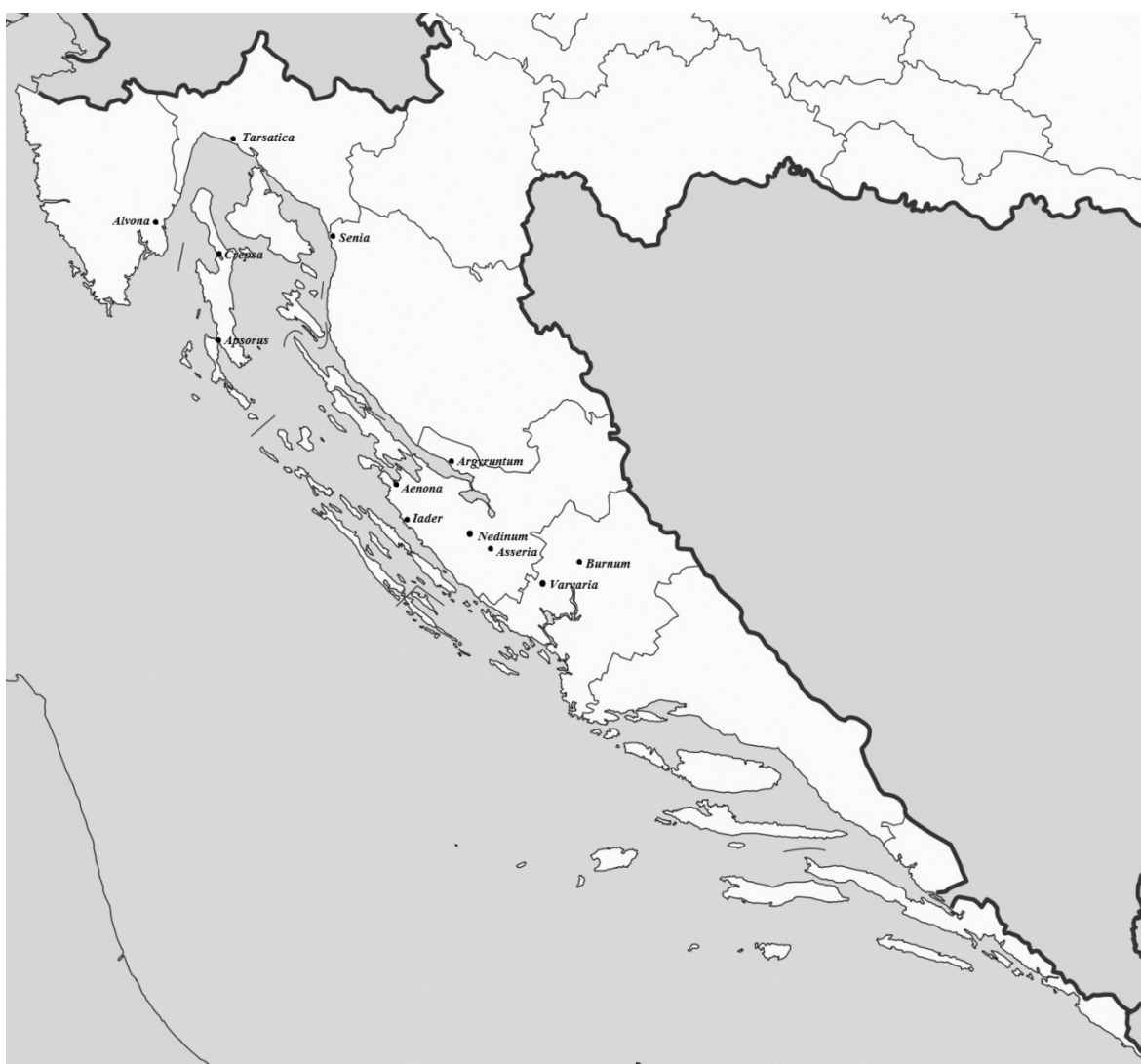
Sl. 9. Karta zabilježenog municipalnoga carskog kulta u Liburniji

U municipijima je carski kult drugačije organiziran nego onaj na provincijskoj ili pokrajinskoj razini. Dok je provincijsku i pokrajinsku razinu štovanja pokrenuo izravno car i najčešće su jednako uređene, municipalna razina štovanja je mnogo slobodnija. Nju supotaknuli carevi, ali je raznolika i ima vlastiti razvoj često različit od municipija do municipija. Imenovanje svećenika je različito, od flamen , sacerdos do flaminica za carice i deficirane članice carske obitelji, a poznati su i seviri, seviri augustali, kolegiji koji se brinu za carski kult u municipijima. Kult je također bio uređen posebno za građane te posebno za oslobođenike, a biti svećenik carskoga kulta značilo je uspeti se na društvenoj ljestvici i do viteškog staleža. U mnogim gradovima u Liburniji zabilježeni su tragovi carskog štovanja iz različitih razdoblja principata (Sl. 9.).