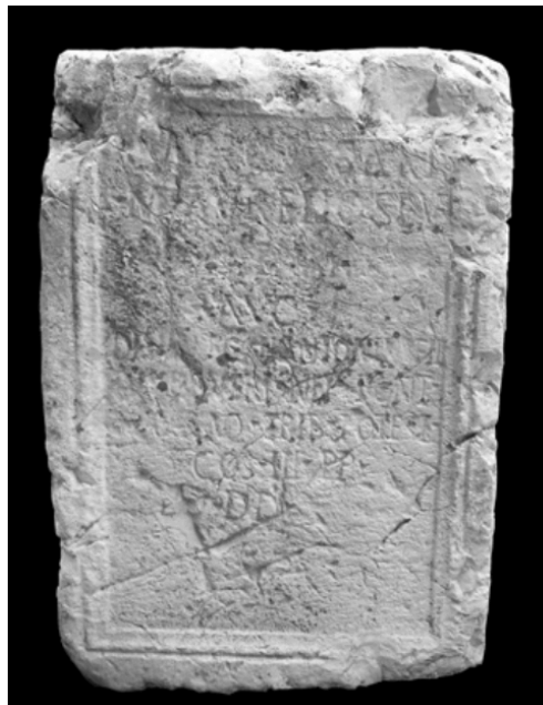
Sl. 10. Natpis na bazi kipa Aleksandra Severa

U doba dinastije Severa grad doživljava procvat kada se u gradu postavljaju carski kipovi. Kipovi nisu sačuvani, ali jesu natpisi na njihovim bazama. 160 Podiže ih zajednica odlukom gradskog vijeća, u čemu se očituje vjernost lokalne zajednice Carstvu. Najstarija je ona u čast cara Marka Aurelija iz 164. godine. 161 U čast carice Julije Domne, žene Septimija Severa, postavljen je natpis odlukom gradskog vijeća. 162 Poznati su i natpisi u čast cara Karakale, 163 Aleksandra Severa 164 (Sl. 10.) te Trebonijana Gala. 165