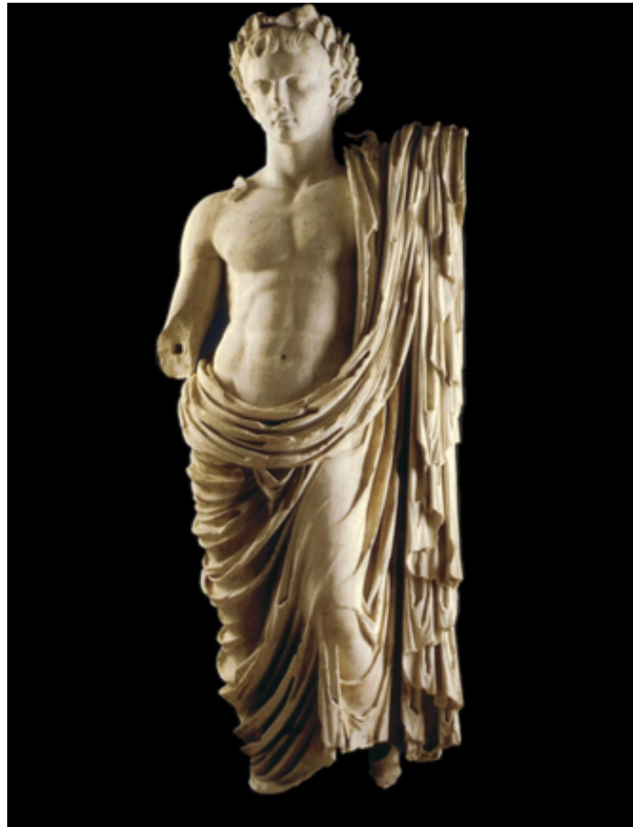
Sl. 12. August iz Nina (Preuzeto iz M. SANADER, 2008, 76.)

U Ninu je pronađena i statua Augusta koja pripada tipu Prima Porta. Prikazan je slično kao i prethodno opisana statua, kao Jupiter s plaštem prebačenim preko lijevog ramena, golog torza s vijencem od hrasta na glavi i s ispruženom desnom rukom u kojoj je vjerojatno držao pateru, a u lijevoj žezlo (Sl. 12.). 190