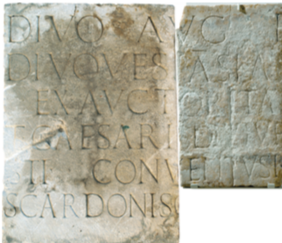
Sl. 8. Spojeni natpisi iz Trogira i Skardone (Preuzeto iz D. DEMICHELI, 2015, 95.)

Uz navedene natpise poznate iz Skardone koji potvrđuju carsko štovanje, nađen je i natpis posvećen Veneri pobjednici. Natpis se nalazio na bazi Venerina kipa, a kako je poznato, rod Julijevaca nju štuje kao svoju božansku zaštitnicu. 145 Poznat je i natpis koji spominje Augustalis , što se može tumačiti kao služba svećenika, a ako je to tako, bila bi to potvrda da svećenici augustali ne obnašaju dužnost samo u kolonijama nego i u gospodarski snažnijim municipijima. Nokako natpis nije cjelovit, moguće je različito tumačenje. 146