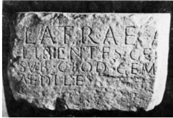
Sl. 2. Latrin natpis (Preuzeto iz J. MEDINI, 1984b, T. III)

Kada se govori o Latri i njezinoj božanskoj naravi, treba razmotriti dokle seže nastanak njezina kulta. Činjenica je da na temelju dostupnih nalaza koji dokazuju njezino štovanje ne možemo sa sigurnošću zaključiti kada je kult nastao. No možemo definirati gdje je kult bio raširen, a u ovom slučaju to je središnja Liburnija, odnosno Nedinum i njegova šira okolica. Osim toga, iz natpisa možemo zaključiti kojeg su staleža i podrijetla bili pojedini dedikanti te kakva je mogla biti narav božice. Medini s određenom dozom sumnje iznosi da je liburnski kult mogao vući korijene iz neolitskih kultova plodnosti koji su bili karakteristični za to prapovijesno razdoblje. 60 Šašel Kos to mišljenje opovrgava uz obrazloženje kako je teško moguće da se neolitski kult mogao tako dugo zadržati s obzirom na velike promjene koje su zahvatile to područje u kasno brončano doba i etnogenezu Liburna. 61 Ne treba nužno odbaciti ni jedno ni drugo mišljenje. Naravi božanstava bile su složene i podložne promjenama. Kako su se mijenjale prilike u društvu, tako su sukladno njima bila mijenjana i značenja koja su se povezivala uz različita božanstva.