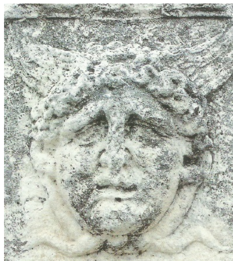
Sl. 15. Gorgona s Foruma (Preuzeto iz N. CAMBI, 2005, 29.)