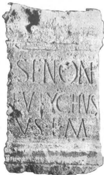
Sl. 3. Natpis Sentone iz Tarsatike (Preuzeto iz M. BLEČIĆ, 2001, 104.)

Dvjema božicama je zajedničko to što su štovane na istarskom dijelu Liburnije, dakle na krajnjem zapadu liburnskog područja. Osim toga, za njih je, uz Iku i Iriju, karakteristično što je u istim općinama poznato više lokalnih božanstava, što nije slučaj s npr. Latrom ili Anzotikom. 79 Uz Latru, Sentona je jedino liburnsko božanstvo poznato po posvetama iz nekoliko municipija, dva iz Flanone, tri iz Albone te jedan iz Tarsatike (Sl. 3.). 80