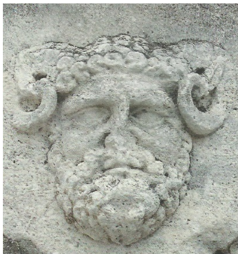
Sl. 14. Jupiter Amon s Foruma

hrama. Kako se hram nalazi na kapitoliju i ima uobičajene tri cele te su nađeni dokazi štovanja Jupitera i Junone, teško je govoriti o hramu carskoga kulta u Jaderu.