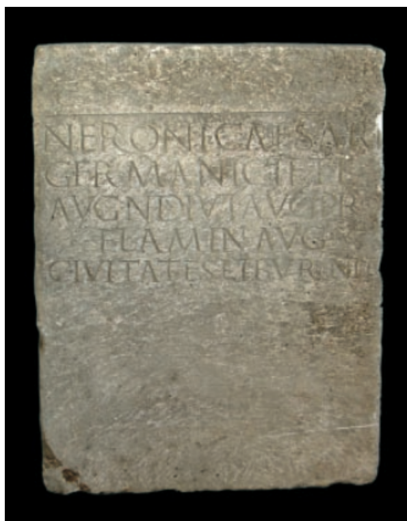
Sl. 6. Baza kipa Nerona Cezara

Neroni Caesari / Germanici f(ilio) Ti(berii) / Aug(usti) n(epoti) Divi Aug(usti) pr[o(nepoti)] / fl(amin)i Aug(ustalis) / civitates Liburniae. 131