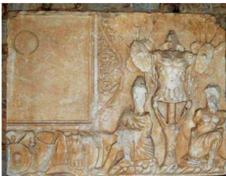
Sl. 4. Ulomak tropeja iz Tilurija (Preuzeto iz N. CAMBI, 2010, 131.)

U Splitu se čuva ploča koja bi, prema mišljenju N. Cambija, mogla biti dio tropeja. Naime, na njoj su prikazani rimsko oružje i oprema, ali ne može se sa sigurnošću tvrditi da je dio tropeja. U Naroni je pronađen još jedan ulomak tropeja koji prikazuje pramac broda te bista žene i orao s vijencem u kandžama. Žena bi mogla biti Viktorija ili Amazonka. N. Cambi povlači paralele s Akcijskim tropejem te smatra da je ovaj postavljen u Naroni kako bi ovjekovječio Augustovu pobjedu, koji je vjerojatno bio i pater kolonije. 126