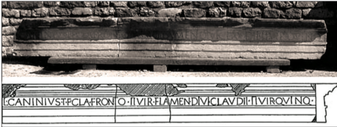
Sl. 16. Arhitrav pronaden u Aseriji

Uz Juliju Tertulu, u Aseriji je zabilježena još jedna svećenica carskoga kulta, sodalis Baebia Saturnina . 232 Cipus na kojem je zabilježen natpis podiže joj prijateljica Iulia Iadestina , koja možda pripada istom kolegiju koji se brine za kult carice. 233