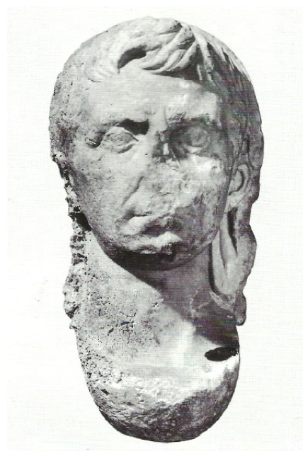
Sl. 11. Portret Oktavijana akcijskog tipa (Preuzeto iz N. CAMBI, 2005, 18.)

Municipij Crexa također dobiva status u vrijeme Tiberija, a kako je natpis koji tome svjedoči pronađen u mjestu Beli, pretpostavlja se da su Cres i Beli imali zajedničko vijeće i ustroj te je sjedište bilo u mjestu Beli. Poznat je portret carske osobe kojoj je lice oštećeno pa se samo može reći da pripada osobi julijevsko-klaudijevske dinastije. 170