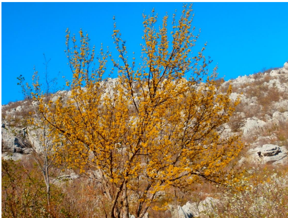
Slika 11. Drijen ( Cornus mas L.)

Drijen ili dren listopadni je grm ili niže stablo prikazano na slici 11 koje može narasti do 5 m visine ( plantea.com ). Svrstavamo ga u porodicu drijenovki ( Cornaceae ) ( plantea.com ). Areal rasprostranjenosti su mu srednja i južna Europa, Mala Azija i Kavkaz (Idžojtić, 2013.). U NP Paklenica nalazimo ga na nadmorskim visinama od 100 do 1.400 m, a posebice na prostoru Grabovih dolina, Njiva, Vickovog dolca i Anića luke pa do zaseoka Ramići i Parići u Paklenici. Ima dvospolne, entomofilne cvjetove s čaškom koju čine 4 sitna lapa dok je vjenčić građen od 4 zlatnožute laticice. Prašnika ima 4. Na kratkim izbojcima nalaze se kuglasti, štitasti cvatovi koji se sastoje od 15 – 20 cvjetova (Idžojtić, 2013.). Drijen cvate prije listanja, točnije u ožujku i travnju ( plantea.com ). Listovi su nasuprotni, jajoliki s cjelovitim rubom ( plantea.com ). Plodovi su sjajne, crvene koštunice dugačke 1,5 do 2 cm (Idžojtić, 2013.). Koštice su ružičastožućkaste boje i sadrže 1 do 2 sjemenke. Plodovi dozrijevaju u kolovozu i rujnu (Idžojtić, 2013.).