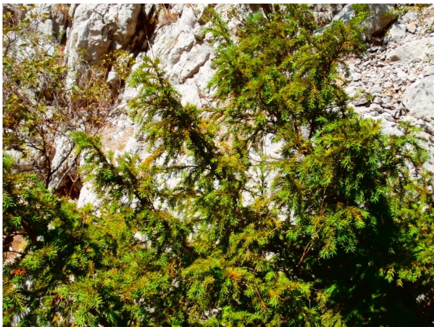
Slika 13. Obična tisa ( Taxus baccata L.)