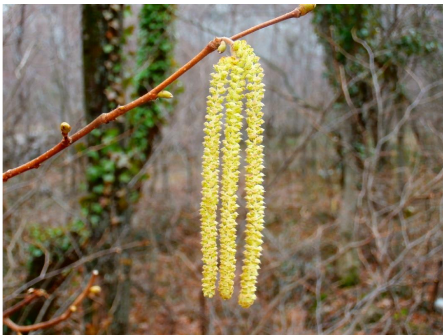
Slika 8. Viseće rese s muškim cvjetovima kod obična lijeske ( Corylus avellana L.)

Obična lijeska raste kao listopadni grm ili niže stablo koje može narasti do 15 m, a najčešće raste u obliku grma visine do 4 m ( plantea.com ). Svrstavamo je u porodicu brezovki ( Betulaceae ) ( plantea.com ). Nalazimo je u Europi, Maloj Aziji i Kavkazu (Idžojtić, 2013.). U NP Paklenica raste na nadmorskim visinama od 250 do 1.100 m, a pretežito je nalazimo na prostoru Vickova dolca, Anića Luke i Nekića dolca. Lijeska ima jednospolne, anemofilne cvjetove. Jednodomna je biljka što bi značilo da se muški i ženski cvjetovi nalaze na istoj biljci. Muški cvjetovi se nalaze u visećim resama prikazanim na slici 8, dugim 2 do 7 cm, a zajedno se nalaze 2 do 4 rese koje prezimljavaju gole (Idžojtić, 2013.). Ženski cvjetovi veliki su oko 0,5 cm i jedva su vidljivi (Idžojtić, 2013.). Razvijaju se na jednogodišnjim izbojcima, cvatovi su zatvoreni u pupu, a za vrijeme cvjetanja vire samo njuške. Cvate u veljači i ožujku, prije listanja (Idžojtić, 2013.). Listovi su obrnuto jajasti s nepravilno nazubljenim rubom i pri osnovi su srcoliki ( plantea.com ). Nakon oprašivanja vjetrom razvijaju se jednosjemeni, smeđi, kuglasti orasi (lješnjaci) s drvenastim usplođem. Svaki orah nalazi se u zvonastom, listolikom, smeđem ovoju koji je razvijen od sraslih predlistića i zalisaka. Sjemenke su jestive i hranjive. Plodovi rastu pojedinačno ili do 4 ploda zajedno. Dozrijevaju u kolovozu i rujnu (Idžojtić, 2013.).