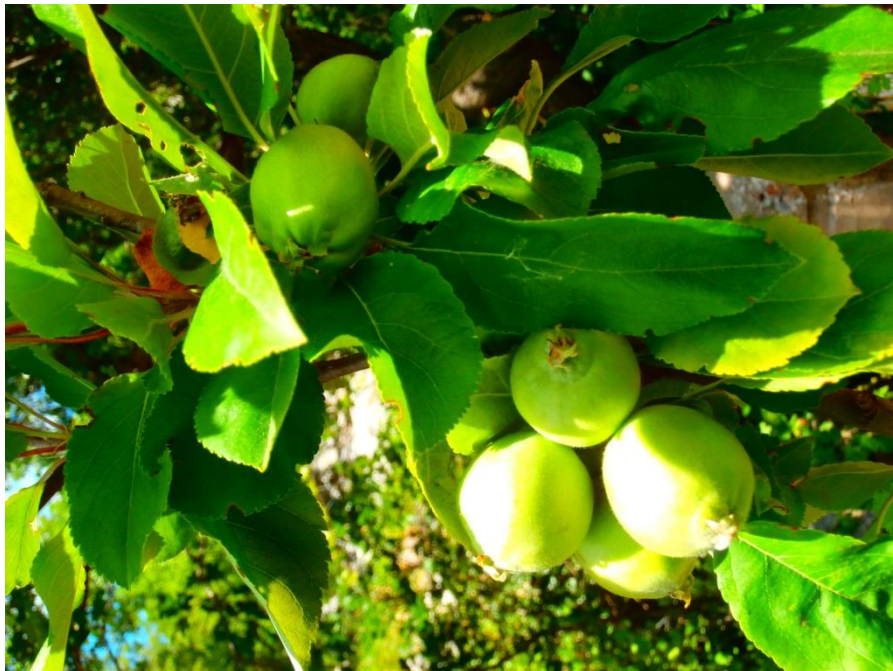
Slika 4. Plod divlje jabuke ( Malus sylvestris (L.) Mill.)

Divlja ili šumska jabuka listopadno je stablo ili grm koje može narasti do 10 m visine ( plantea.com ). Svrstavamo je u porodicu ruža ( Rosaceae ) ( plantea.com ). Areal rasprostranjenosti joj je po cijeloj Europi. Kod nas je jako rijetka i zaštićena biljka. U NP Paklenica nalazimo je na nadmorskim visinama od 300 do 900 m i na lokacijama Anića luka, Grabove doline, Njive Lekine i Lokva (granica Parka na početku Borove kose). Ima dvospolne, entomofilne cvjetove, a čaška je građena od 5 trokutastih lapova koji su iznutra gusto dlakavi, a izvana goli (Idžojtić, 2013.). Vjenčić se sastoji od 5 latica koje mogu biti bijele ili izvana lagano ružičaste. Prašnika ima 15 do 20 (Idžojtić, 2013.). Na vrhovima kratkih izbojaka s listovima, u uspravnim gronjama, nalazi se u skupini po nekoliko cvjetova. Cvate u travnju i svibnju istovremeno s fazom listanja (Idžojtić, 2013.). Listovi su naizmjenični s lagano nazubljenim rubom ( plantea.com ). Plodovi prikazani na slici 4 su žućkasto zeleni i kuglasti. Jezgra se sastoji od 5 pretinaca od kojih svaki sadrži 1 do 2 smeđe, glatke, široke sjemenke (Idžojtić, 2013.). Plodovi dozrijevaju u periodu od kolovoza do listopada (Idžojtić, 2013.).