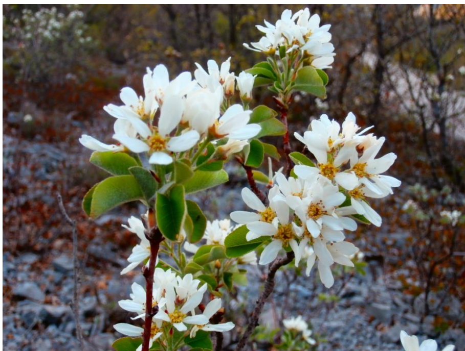
Slika 10. Cvijet kozje jabučice ( Amelanchier ovalis Medik.)

Kozja jabučica, rušvica ili obična krušvica listopadni je grm iz porodice ruža ( Rosacea ) ( plantea.com ). Ima uspravne grane, a raste do 2 m visine ( plantea.com ). Areal rasprostranjenosti joj je Europa ( plantea.com ). Raste na nadmorskim visinama do 1.800 m, a na području NP nalazimo je na nadmorskim visinama od 400 do 1.700 m točnije na lokacijama uz Pisak do Velikih krčevina, te u Liskovom i Velikom dolcu. Ima dvospolne, entomofilne, mirisne cvjetove prikazane na slici 10, te zvonasto cvjetišće koje luči nektar. Čaška se sastoji od 5 dlakavih, crvenkastih lapova, a vjenčić od 5 bijelih, s vanjske strne vunasto dlakavih latica. Prašnika ima 20. Na vrhovima kratkih izbojaka s listovima, u dlakavim grozdovima, nalazi se po 5 do 8 cvjetova zajedno (Idžojtić, 2013.). Cvate od travnja do lipnja, malo prije potpunog razvoja lista ( plantea.com ). Listovi su jednostavni i nepravilno sitno nazubljeni s tupim vrhom ( plantea.com ). Jezgričasti plodovi kuglastog su oblika i plavkasto crne boje, a na vrhu imaju otklonjene lapove čaške. Sadrže do 10 sjajnih, tamnosmeđih srpastih sjemenki (Idžojtić, 2013.). Plodovi dozrijevaju u srpnju i kolovozu (Idžojtić, 2013.).