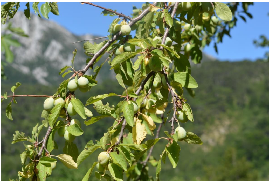
Slika 6. Šljiva ( Prunus domestica L.)

Šljiva je listopadno stablo koje svrstavamo u porodicu ruža ( Rosaceae ) prikazano na slici 6 koje može narasti do 10 m visine ( plantea.com ). Šljivin areal rasprostranjenosti u prirodi nije točno poznat već samo kod uzgoja. Na području NP Paklenica nalazimo je na nadmorskim visinama od 200 do 900 m, te na prostoru oko zaseoka Ramići i Parići te u Suhoj drazi i Bršljanuši u Velikoj Paklenici i zaseoka Jurline i Škiljići na Grabovim dolinama. Stablo je srednje veliko, a može biti manje ili više bujna rasta ( plantea.com ). Šljiva ima dvospolne entomofilne cvjetove s vrčastim cvjetištem koje iznutra luči nektar. Čaška se sastoji od 5 zelenih dlakavih lapova, a vjenčić od 5 bijelih okruglastih do eliptičnih latica (Idžojtić, 2013.). Prašnici nisu jednake dužine, malo su kraći od latica i ima ih 20 (Idžojtić, 2013.). Cvate u travnju i svibnju kada se ujedno odvija i listanje ili neposredno prije listanja (Idžojtić, 2013.). Listovi su naizmjenični, ovalni i na rubu sitno nazubljeni ( plantea.com ). Plodovi su plavkasto crni, eliptičnog oblika, dugački 3 do 6 cm (Idžojtić, 2013.). Plodovi vise na stapci koja je kraća od ploda. Mesnati dio je jestiv i jako sočan i sladak, te se lako odvaja od koštice koja je elipsoidna, plosnata i hrapava. Plodovi dozrijevaju u kolovozu i rujnu (Idžojtić, 2013.).