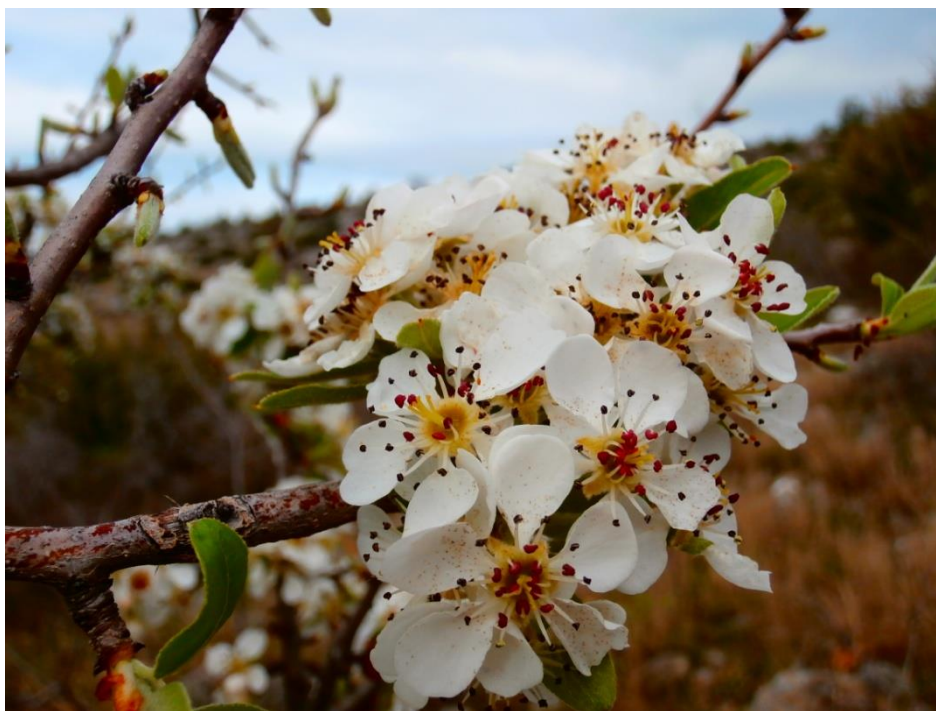
Slika 7. Cvijet divlje kruške ( Pyrus pyraster (L.) Burgsd.)

Divlja kruška raste kao listopadni grm ili stablo, a može narasti i do 20 m visine ( plantea.com ). Svrstavamo je u porodicu ruža ( Rosaceae ) ( plantea.com ). Areal rasprostranjenosti joj je u Europi, a u NP Paklenica nalazimo je na nadmorskim visinama od 100 do 1.000 m, a posebice na lokacijama od ulazne recepcije do parkinga, te na Anića luci, Grabovim dolinama i Lokvi. Ima dvospolne, entomofilne cvjetove jako neugodna mirisa koje prikazane na slici 7 (Idžojtić, 2013.). Cvjetišta je dlakavo, vrčasto i luči nektar. Čaška je građena od 5 dlakavih lapova, a vjenčić od 5 bijelih, ružičasto presvučenih, okruglastih latica. Prašnika ima 15 do 30 (Idžojtić, 2013.). U uspravnim gronjama, na kratkim izbojcima nalazi se zajedno po 3 do 9 cvjetova. Cvate u travnju, a cvjetati počinje nakon osme godine starosti (Idžojtić, 2013.). Listovi su naizmjenični, ušiljenog vrha i valovitog ruba, te jajasto okruglastog oblika ( plantea.com ). Divlje kruška ima kuglaste ili kruškolike, žućkastozelene, jezgričave plodove koji na vrhu imaju veliku, suhu čašku. Jezgra se sastoji od 5 pretinaca, a svaki sadrži po dvije smečkastrocrne, plosnate, sjajne sjemenke (Idžojtić, 2013.). Plodovi dozrijevaju od kolovoza do listopada, a divlja kruška počinje plodonositi od 20. do 30. godine (Idžojtić, 2013.).