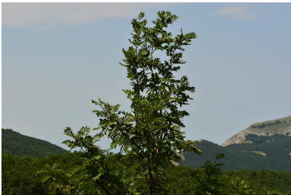
Slika 9. Jarebika ( Sorbus aucuparia L.)

Jarebika ili jasika listopadno je stablo iz porodice ruža ( Rosaceae ) prikazano na slici 9 koje može narasti i do 15 m visine ( plantea.com ). Rasprostranjena je u Europi, Aziji i sjevernoj Africi (Idžojtić, 2013.). Raste na nadmorski visinama do 1.900 m, a na prostoru NP na nadmorskim visinama od 1.400 do 1.700 m, a najviše na području od Čičine doline uz markiranu planinarsku stazu sve do Babina jezera. Ima dvospolne, entomofilne cvjetove neugodna mirisa. Cvjetišta je vrčasto i luči nektar. Čaška se sastoji od 5 trokutastih lapova, a vjenčić od 5 bijelih, okruglastih i pri osnovi vunastih latica. Prašnika ima 20 (Idžojtić, 2013.). Na vrhovima kratkih izbojaka, u uspravnim, polukuglastim, dlakavim gronjama, nalazi se po 200 do 300 cvjetova zajedno (Idžojtić, 2013.). Jarebika cvate u travnju i svibnju ( plantea.com ). Listovi su naizmjenični, neparno perasti i sastavljeni od 9 do 19 nazubljenih listića koji nemaju peteljku ( plantea.com ). Jezgričasti plodovi su kuglasti i narančastocrveni do crveni s ostatkom čaške na vrhu. Jako su kiseli i gorki, a u sirovom stanju su malo i otrovni. Sadrže 2 do 5 duguljaste, smeđe, šiljaste sjemenke (Idžojtić, 2013.). Plodovi dozrijevaju u razdoblju od kolovoza do listopada, te dugo ostaju na izbojcima (Idžojtić, 2013.).