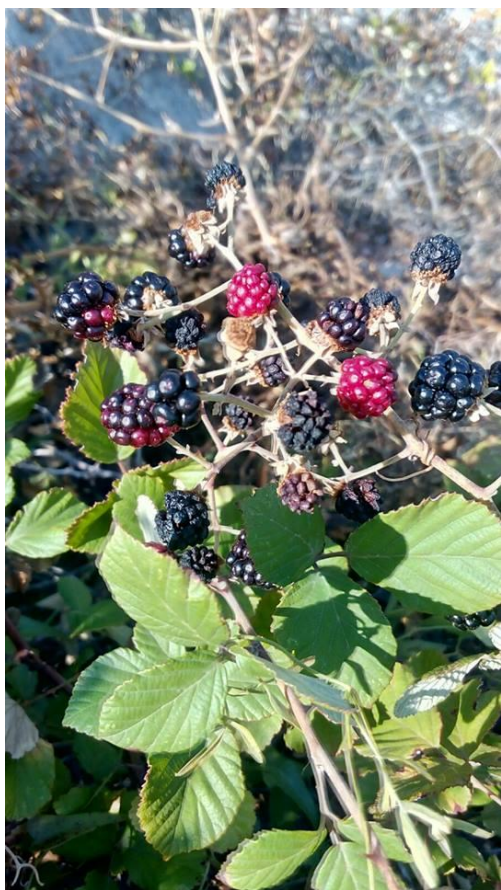
Slika 12. Plod obične kupine ( Rubus fruticosus L.)

Kupina je biljka penjačica iz porodice ruža ( Rosaceae ) ( plantea.com ). Stabljika je prekrivena trnjem i može narasti i do 3 m visine ( plantea.com ). Rasprostranjena je na gotovo čitavom području Europe, u zapadnoj i središnjoj Aziji, sjevernoj Africi i Americi. U NP Paklenica nalazimo je na nadmorskim visinama od 100 do 900 m, odnosno gotovo na čitavom području Parka. Kupina ima dvospolne, entomofilne cvjetove, čašku građenu od 5 zelenih, dlakavih lapova, te vjenčić sastavljen od 5 bijelih latica. Prašnici su brojni. U vršnim metlicama nalazi se do 25 cvjetova zajedno, a cvate u svibnju i lipnju (Idžojtić, 2013.). Listovi su neparno perasti, sastavljeni od 3 do 5 jajastih listića ( plantea.com ). Mnogokoštunica odnosno zbirni plod, prikazan na slici 12, građen je od puno za vrijeme dozrijevanja crvenih, a kasnije crnih jednosjemenih koštunica (Idžojtić, 2013.). Plodovi dozrijevaju u srpnju i kolovozu (Idžojtić, 2013.).