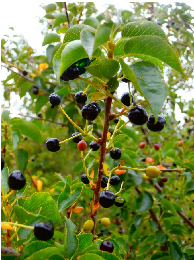
Slika 3. Plod rašeljke ( Prunus mahaleb L.)

Rašeljka raste u obliku listopadnog grma ili nižeg stabla, a može narasti do 10 m visine ( plantea.com ). Svrstavamo je u porodicu ruža ( Rosaceae ) ( plantea.com ). Areal rasprostranjenosti ove biljke je u Europi, Maloj Aziji, Kavkazu i sjevernoj Africi (Idžojtić, 2013.). U NP Paklenica nalazimo je na nadmorskim visinama od 100 do 1.400 m, a ponajviše na prostoru od samog ulaza u Park, duž kanjona i sve do zaseoka Ramići i Parići, te na prostoru Grabovih dolina, Njiva i Bojinca. Vrsta ima dvospolne entomofilne cvjetove, te vrčasto cvjetišta koje iznutra luči nektar. Čaška se sastoji od 5 jajastih lapova, vjenčić od 5 bijelih latica, a prašnika ima 20 -25 čija je dužina jednaka dužini latica (Idžojtić, 2013.). U uspravnim postranim granjama nalazi se 4 do 10 cvjetova. Cvate u travnju i svibnju kada se odvija i listanje (Idžojtić, 2013.). Listovi su sjajni, okruglasto jajoliki sa sitno nazubljenim rubovima ( plantea.com ). Plodovi prikazani na slici 3 crne su, jajaste i na osnovi malo udubljene koštunice, veličine 8 do 10 mm. Slatkastog su okusa i sadržavaju jajastu glatku košticu (Idžojtić, 2013.). Rašeljka može živiti i do 200 godina ( plantea.com ).