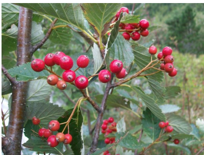
Slika 2. Plod mukinje ( Sorbus aria (L.) Crantz)