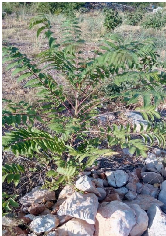
Slika 2. Ailanthus altissima (Mill.) Swingle (Pajsen)

Pajasen je listopadno drvo koje svrstavamo u porodicu Simaroubaceae (slika 2.). Podrijetlom je iz Kine, a kao ukrasna biljka u Europu je unesen 1751. godine. U Hrvatskoj je prvi put zabilježen 1914. godine.