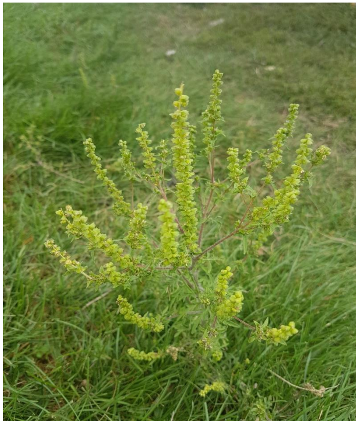
Slika 3. Ambrosia artemisiifolia L. (ambrozija)

Ambrosia artemisiifolia L., jednogodišnja zeljasta biljka prikazana je na slici 2. Jedna je među najpoznatijim invazivnim alohtonim biljnim vrstama i svrstavamo je u porodicu Asteraceae (glavočike) (Ministarstvo kulture, 2009).