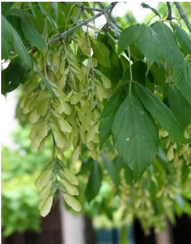
Slika 5. Acer negundo L. (Javor perasti)