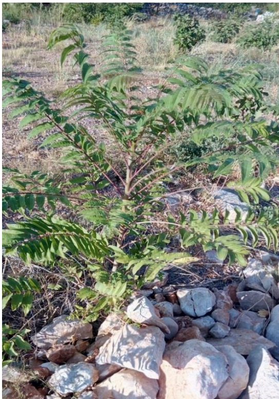
Slika 2. Ailanthus altissima (Mill.) Swingle (Pajsen)

Pajasen je listopadno drvo koje svrstavamo u porodicu Simaroubaceae (slika 2.). Podrijetlom je iz Kine, a kao ukrasna biljka u Europu je unesen 1751. godine. U Hrvatskoj je prvi put zabilježen 1914. godine.