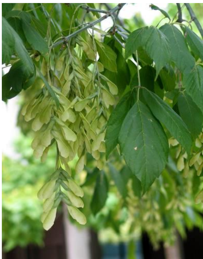
Slika 5. Acer negundo L. (Javor perasti)