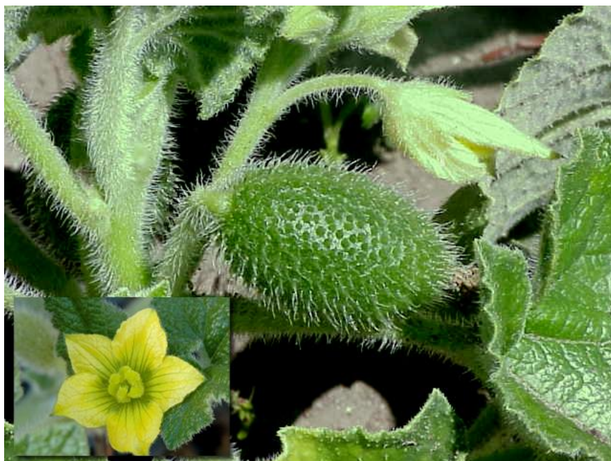
Slika 8. Echinocystis lobata (Michx.) Torr. et Gray (divlji krastavac)

Pripadnik porodice Cucurbitaceae , podrijetlom je iz Sjeverne Amerike. Ova jednogodišnja penjačica prikazana na slici 8. krajem 19. stoljeća namjernim putem je unesena u Europu kao ukrasna i ljekovita biljka.