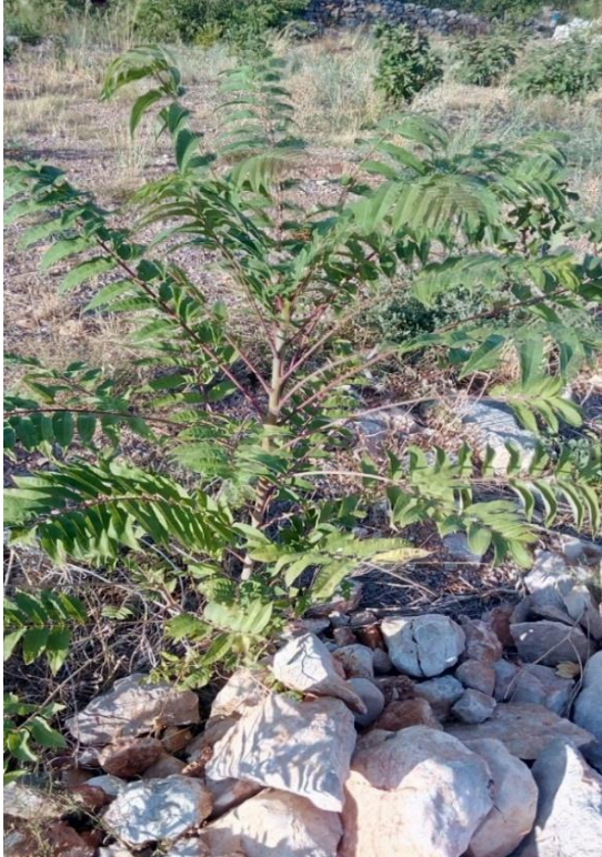
Slika 2. Ailanthus altissima (Mill.) Swingle (Pajsen)

Pajasen je listopadno drvo koje svrstavamo u porodicu Simaroubaceae (slika 2.). Podrijetlom je iz Kine, a kao ukrasna biljka u Europu je unesen 1751. godine. U Hrvatskoj je prvi put zabilježen 1914. godine.