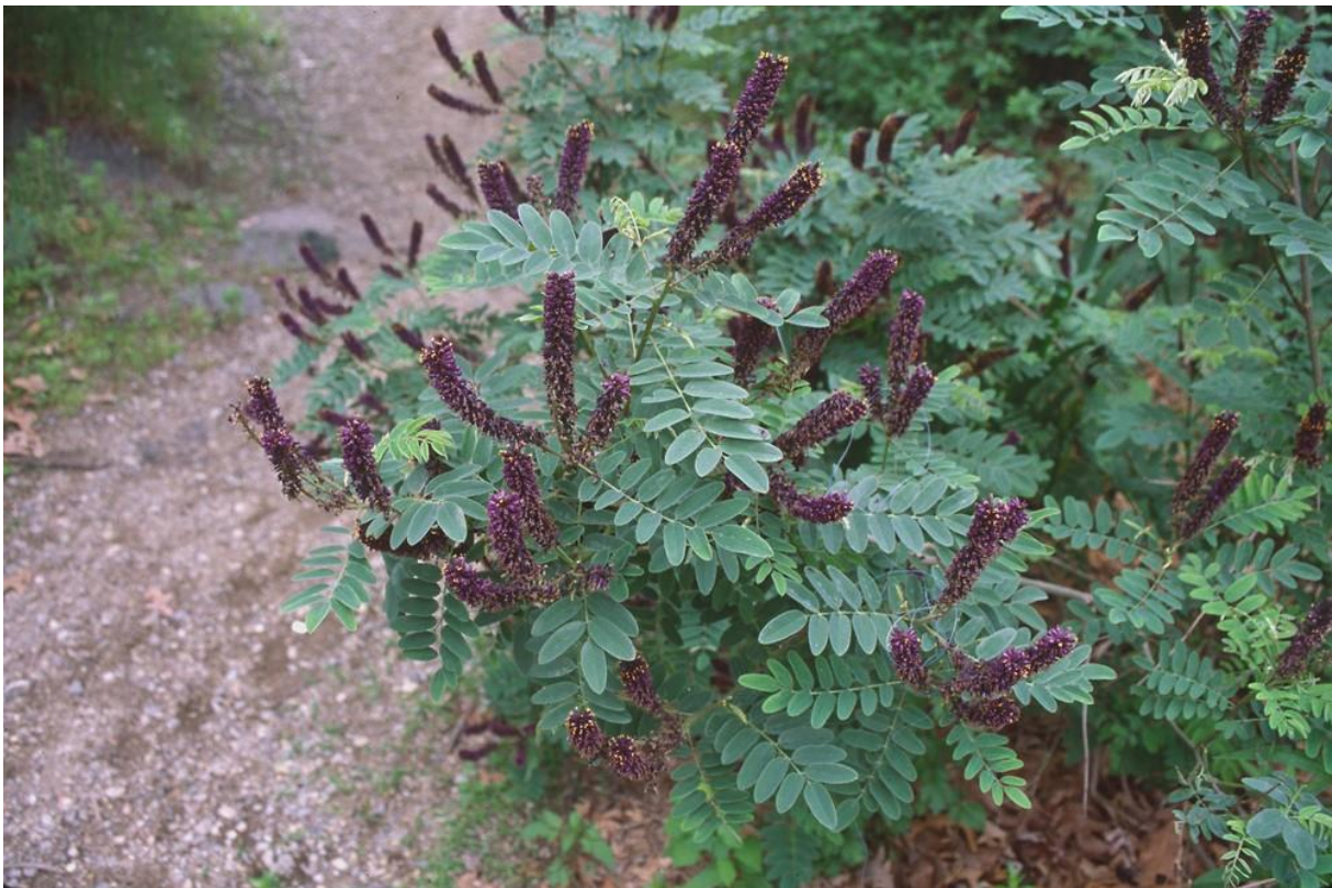
Slika 6. Amorpha fruticosa L. (amorfa)

Amorfa je listopadni grm koji je kao dekorativna i medonosna vrsta prikazana na slici 6. te je namjernim putem unesena iz Sjeverne Amerike 1724. Pronalazimo je u sjeverozapadnoj i istočnoj Hrvatskoj te diljem zemlje uglavnom uz vodotoke. U nizinski dio Hrvatske unesena je početkom 20. stoljeća (Horvat et Franjić ., 2016).