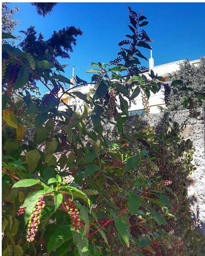
Slika 7. Phytolacca americana L. (vinobojka)

Phytolacca americana L. zeljasta je trajnica koja potječe iz Sjeverne Amerike, a prikazana je na slici 7. kao dekorativna vrsta koja je krajem 18. ili početkom 19. stoljeća namjernim putem unesena u Francusku. U Hrvatskoj je prvi put zabilježen krajem 19. stoljeća, te se raspršila po cijeloj Hrvatskoj osim na planinskim područjima.