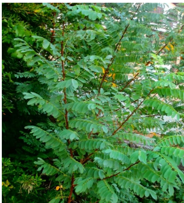
Slika 4. Robinia pseudoacacia L. (bagrem)

Bagrem je listopadno drvo iz porodice Fabaceae, koje vidimo na slici 3. Prvi put je u Europu (Francuska) namjerno unesen 1601. iz Sjeverne Amerike, a zatim u Hrvatsku 1856. Rasprostranjen je gotovo po čitavoj Hrvatskoj, a najviše ga ima u Sjeverozapadnoj Hrvatskoj, Istri i obalnom dijelu Dalmacije s izuzetkom gorsko-planinskoga područja (Horvat et Franjić., 2016).