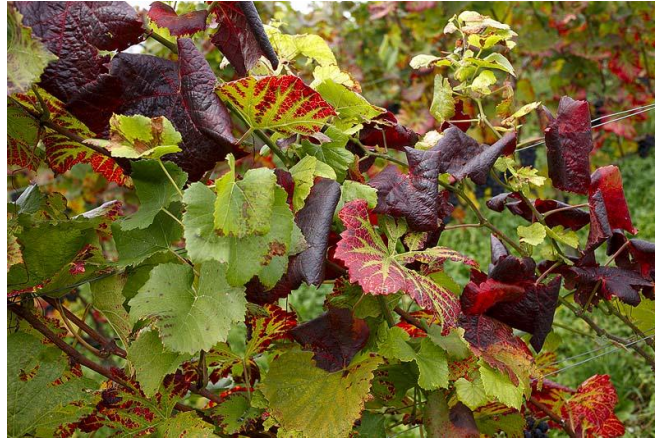
Slika 1. Zlatna žutica vinove loze