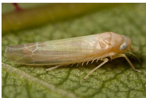
Slika 4. Edwardsiana rosae L.

E. rosea je vrsta duga 3,5 do 4 mm, bijele ili blijedožute do roze boje. Najčešći je štetnik ruže koji osim ruže napada i ostalo voće.