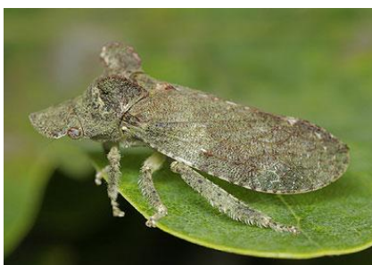
Slika 10. Ledra aurita L.

Karakteristike ove vrste su: dužina tijela od 13 do 18 mm, teško su uočljivi u okolini zbog svoje sive boje.