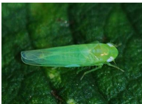
Slika 5. Empoasca spp.

Vrste Empoasca spp. su dužine oko 4 mm, zelenkaste su boje, te štete čine sisanjem sokova iz žila listova.