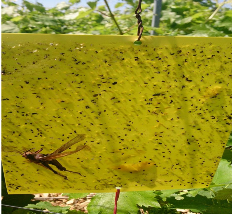
Slika 3. Ulov cvrčaka na žutoj ljepljivoj ploči na lokalitetu Punta skala