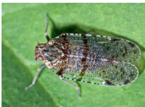
Slika 11. Cixius spp.

Vrste su veličine 6 do 8 mm. Glava je tamne boje dok je tijelo svijetlo sa tamnijim smeđim točkama.