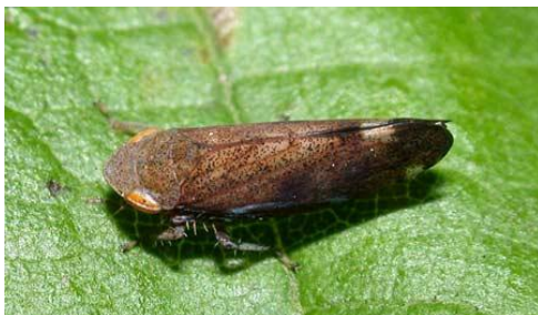
Slika 8. Fieberiella spp.

Vrsta veličine 6 do 8 mm, te se razvija na drvenastim biljkama. Biljke domaćini su vrste iz rodova Rosa i Prunus.