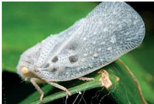
Slika 15. Metcalfa pruinosa S.

Kukac je dug 7 do 8 mm, krila su položena gotovo okomito na tijelo, pepeljaste je boje te je cijeli prekriven voštanim izlučevinama.