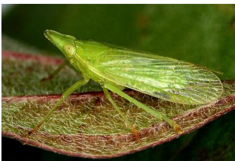
Slika 12. Dictyophara europaea L.

D. europaea je cvrčak zelene boje, veličine do 10 mm te je vrlo specifičnog izgleda.