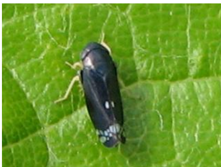
Slika 6. Neoliturus fenestratus H.-S.

N. fenestratus također je nađen na oba lokaliteta. Na lokalitetu Punta skala nađena su 3, a na lokalitetu Baštica 43 primjeraka.