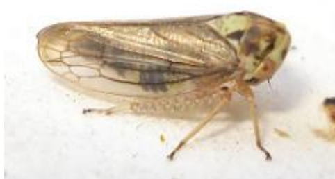
Slika 9. Macropsis spp.

Veličine od 4 do 4.2 mm, žućkaste boje, mjestimice smeđe.