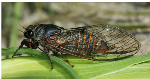
Slika 13. Cicadetta spp.

Nađen je samo jedan primjerak na lokalitetu Punta skala.