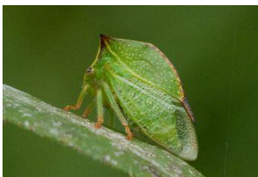
Slika 14. Stictocephala bisonia K. i Y.