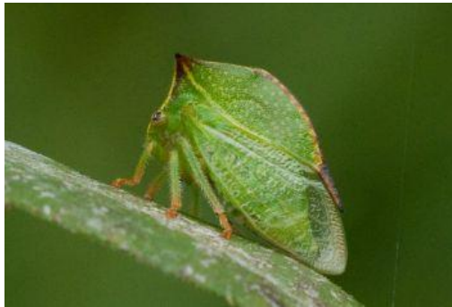
Slika 14. Stictocephala bisonia K. i Y.