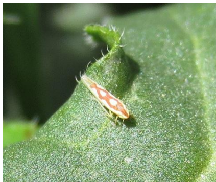
Slika 7. Zygina rhamni F.

Z. rhamni je vrsta veličine 3 do 3,5 mm te je bjelkaste boje sa vrlo uočljivim žarko crvenim ili narančastim šarama po leđima.