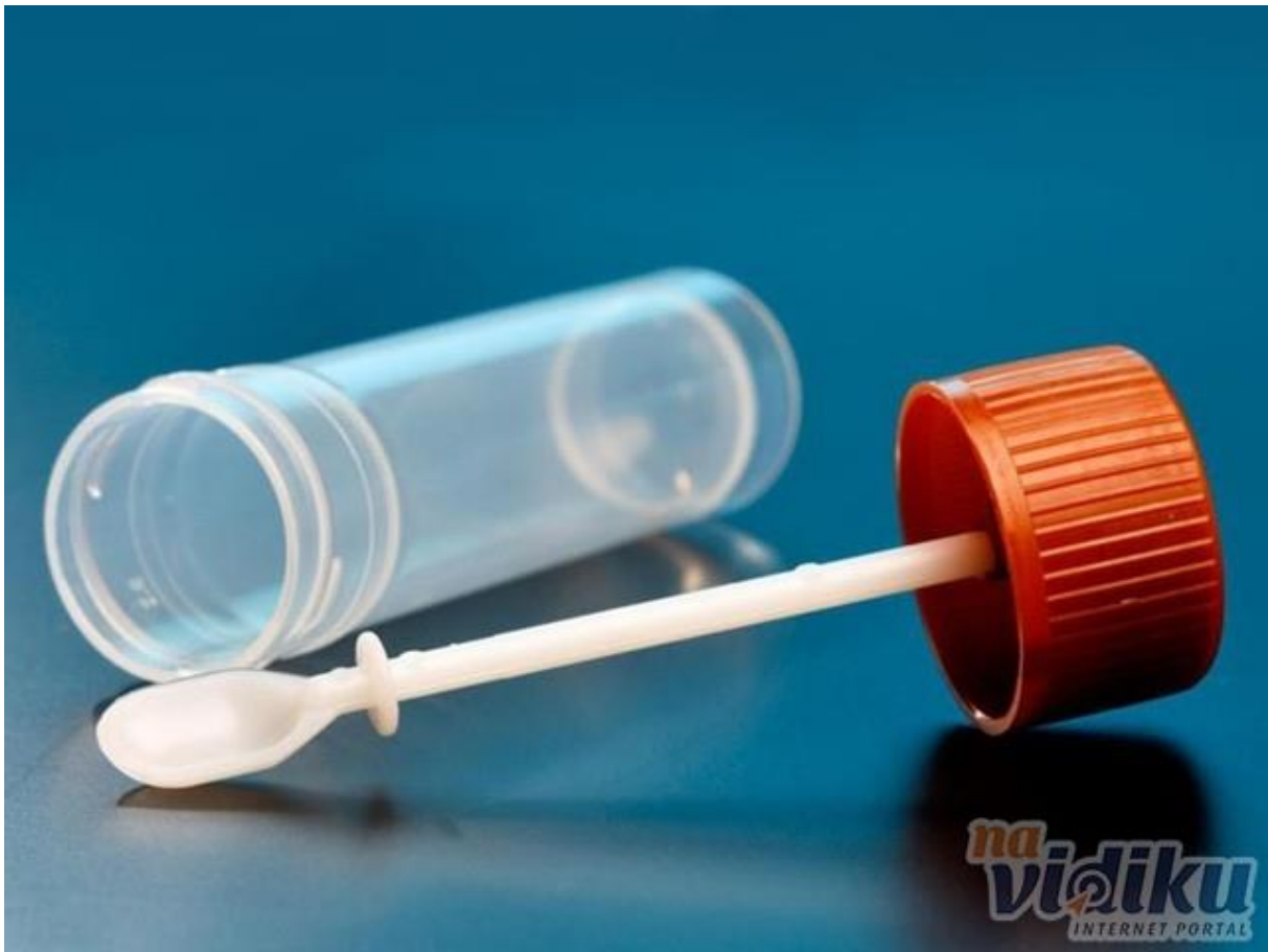
Slika 2. Koprokultura

Izvor: http://www.navidiku.rs/firme/subcatimg/s450/velike/koprokultura8244.jpg pristup: 10.10.2017.