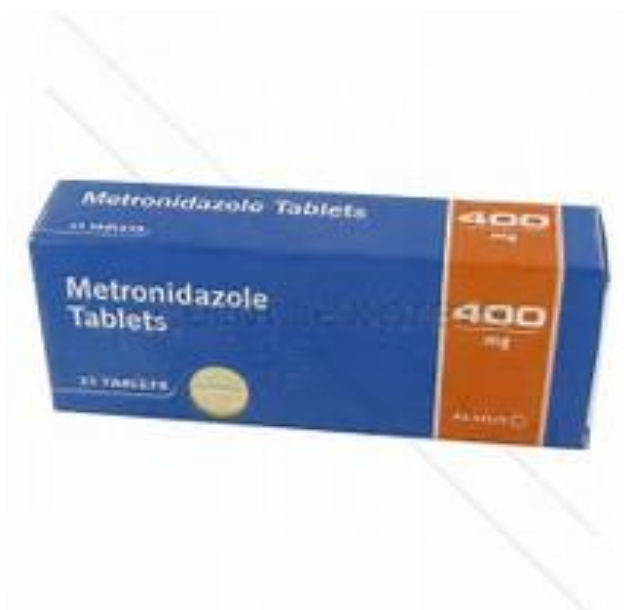
Slika 4. Oralni metronidazol