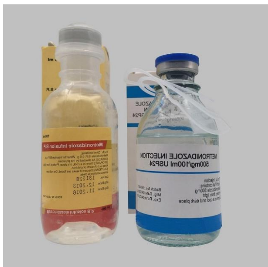
Slika 5. Intravenozni metronidazol