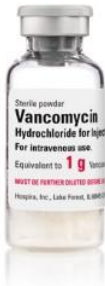
Slika 3. Vankomicin

Izvor: https://www.pfizerinjectables.com/sites/default/files/prod/child/images/0409-6533-01.jpg pristup: 10.10.2017.