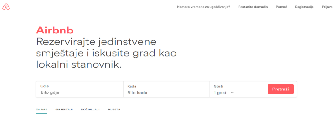
Slika 12. Airbnb - Početna stranica