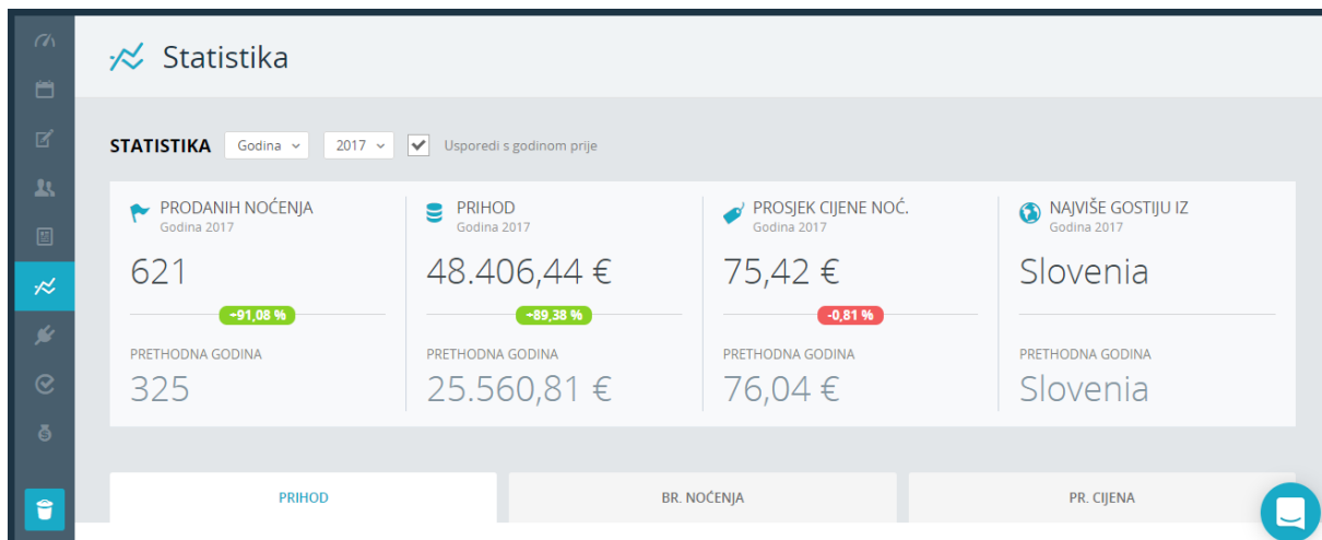
Slika 19. Statistika na Rentlio aplikaciji