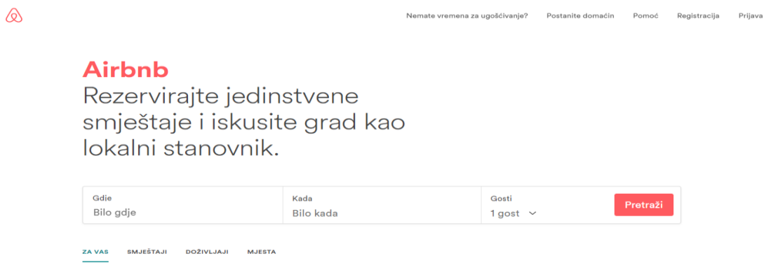
Slika 12. Airbnb - Početna stranica

Izvor: Airbnb , www.airbnb.com , (18.07.2017.)