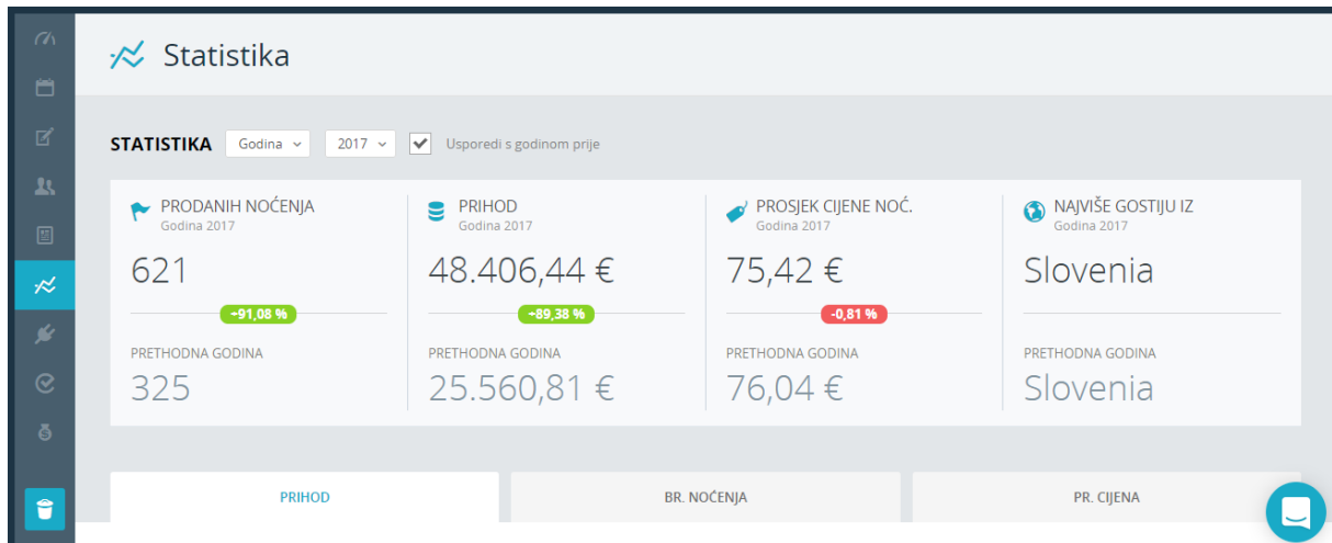
Slika 19. Statistika na Rentlio aplikaciji