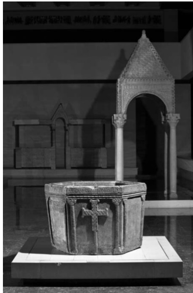
Slika 1. „Višeslavova krstionica“, Muzej hrvatskih arheoloških spomenika u Splitu