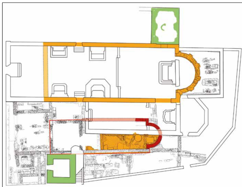
Slika 3. Episkopalni kompleks u Ninu, tlocrt, označeno žutom bojom: 5.-6. st.; označeno crvenom bojom: 7.-8. st.; označeno zelenom bojom: 12.-13. st.