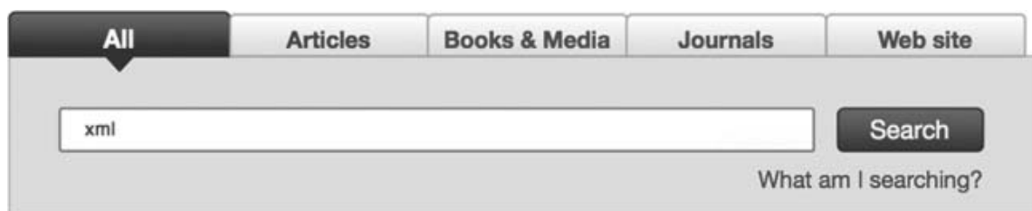
Slika 1; Kombinacija sustava za pronalaženje i sustava za pretraživanje više izvora kroz jedno sučelje 45

set. 44 Dakle, rezultati pretraživanja knjižničnog kataloga, baza podataka i drugih izvora informacija objedinjeni su u jednu listu. Sustavi za pretraživanje više izvora kroz jedno sučelje korištenjem kartica razlikuju se od discovery alata jer korisnik, iako također koristi jedno polje za pretraživanje, mora u sučelju odabrati koje izvore informacija želi uključiti u pretraživanje, a to čini korištenjem kartica od kojih svaka predstavlja određeni izvor ili skupinu izvora informacija najčešće grupiranih prema vrsti građe. Na taj način i dalje se pretražuju zasebni izvori informacija, ali je pretraživanje nešto intuitivnije i jednostavnije. Moguće su i kombinacije dva sustava pa postoji opcija kojom se pretražuje sve zbirke korištenjem samo jednog polja bez odabira pojedinih izvora informacija, ali je moguće i pojedinačno pretraživanje (Slika 1). Oba sustava imaju više prednosti i nedostataka u odnosu jedan na drugoga, o čemu se opsežno raspravlja u literaturi o upotrebljivosti knjižničnih kataloga nove generacije i alata za pronalaženja. Knjižnice bi svakako prije uvođenja određenog proizvoda trebale provoditi istraživanja upotrebljivosti kako bi utvrdila koje je rješenje optimalnije za zajednicu korisnika i to rješenje implementirati na svoje mrežno sjedište. Naravno, uz ove mogući su i drugi pristupi uslugama pretraživanja.