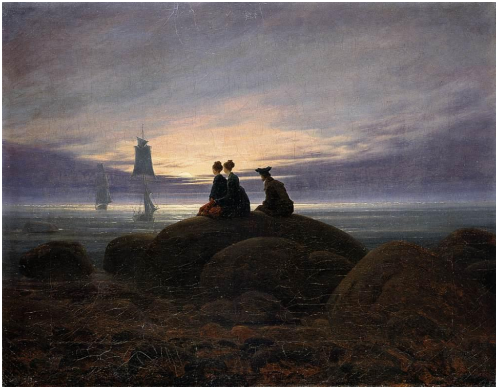
Slika 13 „Izlazak mjeseca na moru“