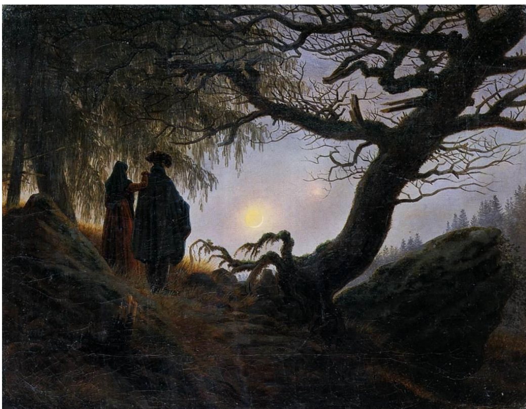
Slika 17 „Muškarac i žena promatraju mjesec“