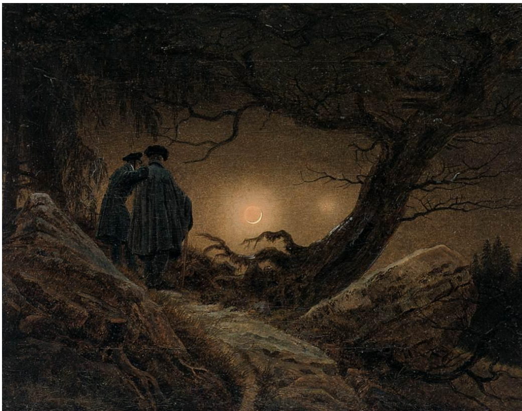
Slika 16 „Promatranje mjeseca“