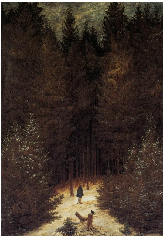
Slika 14 „Lovac u šumi“