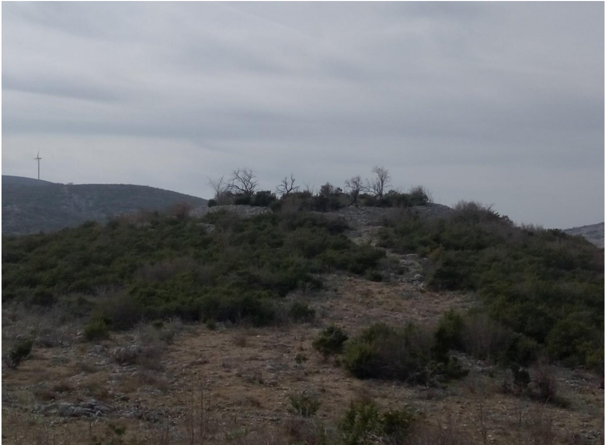
Slika 3 – Gradina Bilin

Nedaleko same gradine, na manjoj uzvisini brda nalazi se i gomila koja bi mogla upućivati na grobni humak. Uokolo same gradine, a ponajviše na sjevernoj strani, tj. u polju između brda Bilin i Praće nalazi se još nekolicina gomila. No, zbog velikog broja ograda koje se također nalaze u tom prostoru, ne možemo sa sigurnošću utvrditi arheološki potencijal.