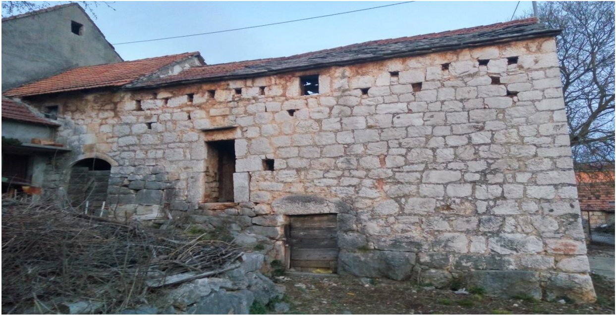
Slika 8 – Kuća Radića i mletački zatvor

Druga, istočna kuća također sadrži dvije kamene ploče sa natpisima (T. Va). Jedna se nalazi na ulazu u donju etažu, dok je druga na dovratniku gornje etaže. Na pločama su upisane godine 1767. i 1798.