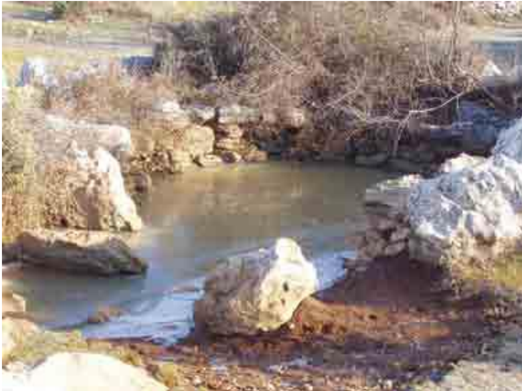
Slika 15 – Lokva Brigeljuša

U usporedbi s Bristovačom, lokva Brigeljuša nalazi se sa suprotne strane brda Šustina, glavica u današnjem zaseoku Šustići, u sjeveroistočnom dijelu sela. Lokva je manjih dimenzija nego ostale i danas je potpuno zapuštena te prekrivena raslinjem. 65 Kao i kod lokve Roženjače nema zidanih bunara u okolici, te se vjerojatno nije koristila cijelu godinu, odnosno nije uvijek sadržavala vodu.