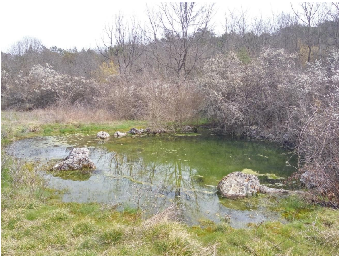
Slika 14 – Lokva Bristovača

Prema brojnosti bunara možemo pretpostaviti kako ova lokva nije pripadala jednom selu, već je snabdijevala šire područje, gdje je svaka zajednica morala sebi osigurati vlastite količine vode. Nadalje, ako pogledamo širi kontekst, vidjet ćemo kako je ovo najkraći put koji vodi preko Trolokvi i Radošića u Kaštela, te dalje prema Splitu, stoga je moguće kako je baš ovim pravcem tekla komunikacija u prošlosti.