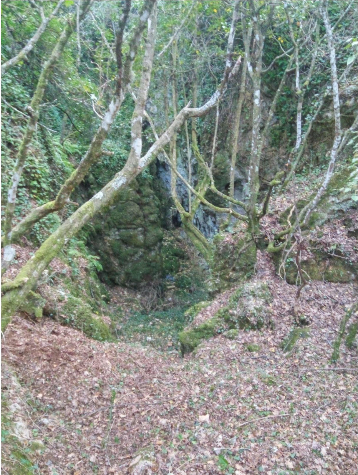
Slika 17 – Pogled na unutrašnjost vrtače u Balovima