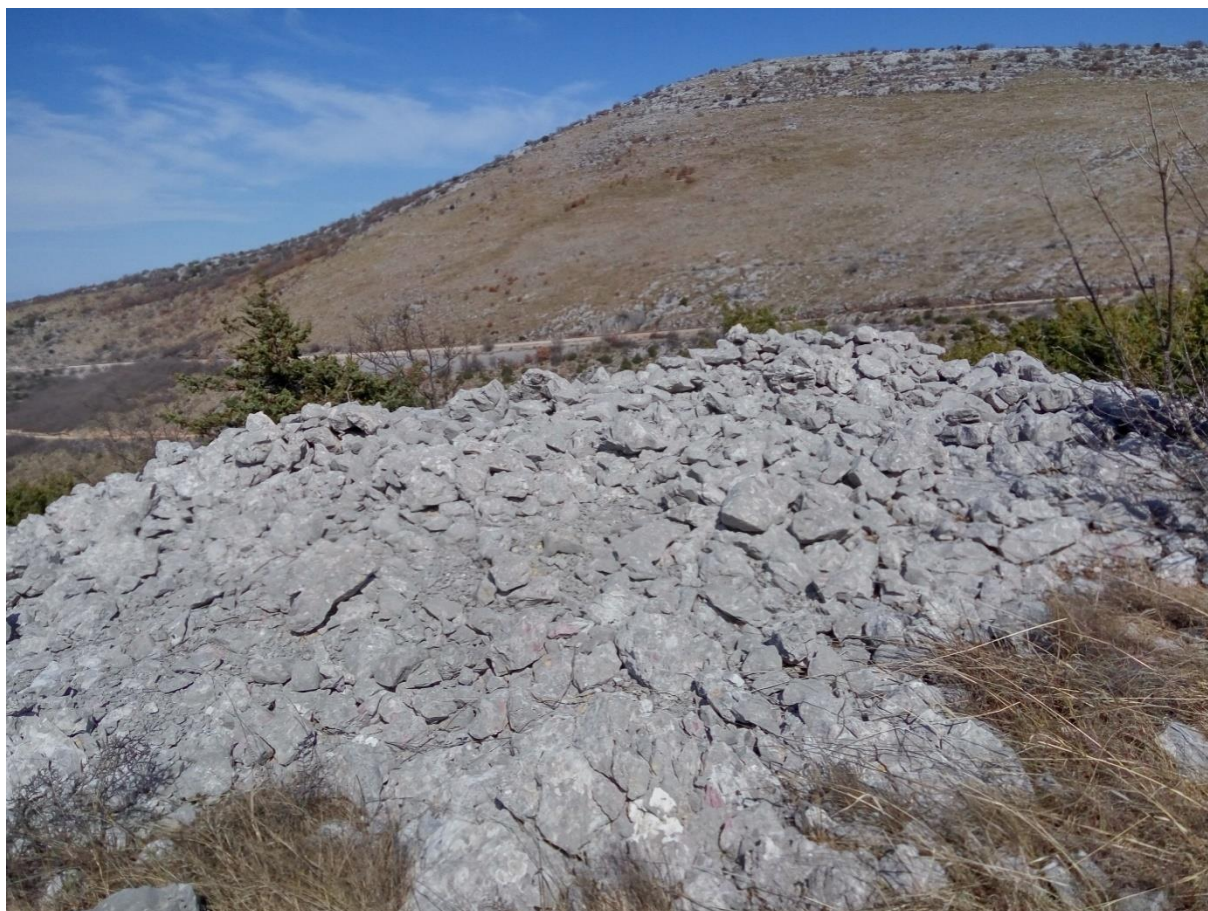
Slika 5 – Manja gomila u Nožinama

Ove dvije gomile nalaze se uz cestu koja vodi iz Prgometa prema Primorskom Dolcu. Smješteni su u zaseoku Nožine podno brda Ljubeć. Manja gomila ima promjer 4 do 5 metara i visinu 1,5-2 metra. Dvadesetak metara sjeverno nalazi se veća gomila promjera 10 do 12 metara i visine 2,5 do 3 metra. Nisu pronađeni nikakvi pokretni materijalni nalazi, a na vrhu su vidljive kasnije kružne formacije, vjerojatno manji zakloni za vojnike napravljeni za vrijeme recentnih sukoba. S obe gomile pruža se izvrstan pogled prema prodolini Primorskog Dolca, te brdu Ljubeć i Brdašće. Nedaleko od ove dvije gomile nalazi se i treća, najveća od spomenutih. Sve tri gomile su već spomenute u literaturi. 42 Na istočnoj strani, blizu gomila, nalazi se vrtača, a obzirom na blizinu možda se i tu krije potencijalni arheološki lokalitet.