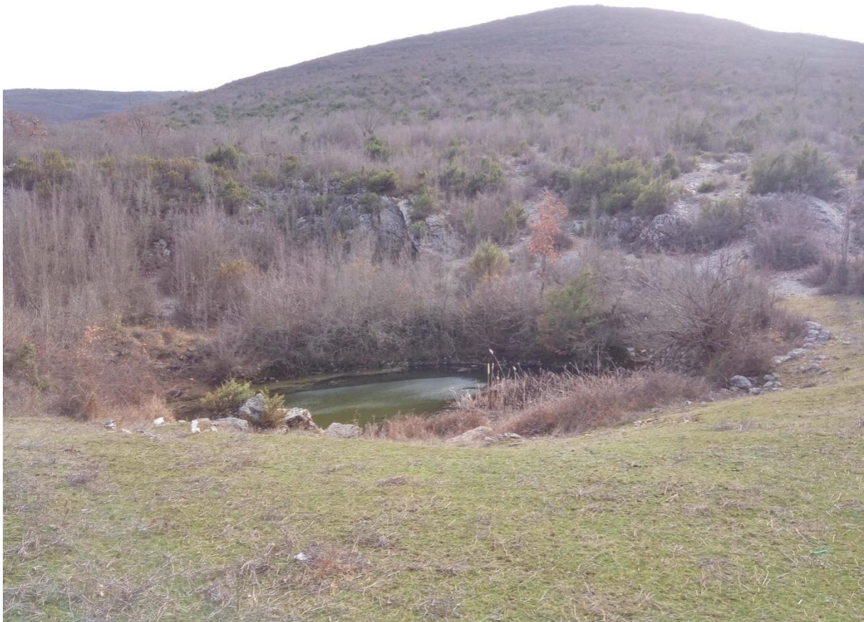
Slika 11 – Lokva Roženjača

Lokva Roženjača smjestila se 2 kilometra zapadno od lokve Kosmać u podnožju brdskog masiva Praća. Nalazi se u manjoj vrtači površine 130m 2 . Obložena je suhozidom, a prirodni joj je ulaz bio sa sjeverne strane. Zanimljivo je primijetiti nedostatak zidanih bunara kao na svim drugim lokvama u selu, što se može protumačiti činjenicom kako u bližoj okolini nema zaseoka. Pregledavajući austrijske karte iz sredine XIX. st. može se vidjeti put koji je vodio preko lokve i brda sve do Vidove gradine u susjednoj Prapatnici. Postoji mogućnost da su lokva i gradina u korelaciji. U blizini lokve nalazi se polje koje je na Hrvatskoj osnovnoj karti označeno imenom „Zlopolje“ čiji naziv može upućivati na potencijali arheološki lokalitet, a ovaj naziv i danas koriste mještani obližnjeg zaseoka. U ogradama pokraj same lokve lako se mogu primijetiti veći kameni blokovi ugrađeni u suhozide čiji oblik neodoljivo podsjeća na poklopnice grobova (T. VII).