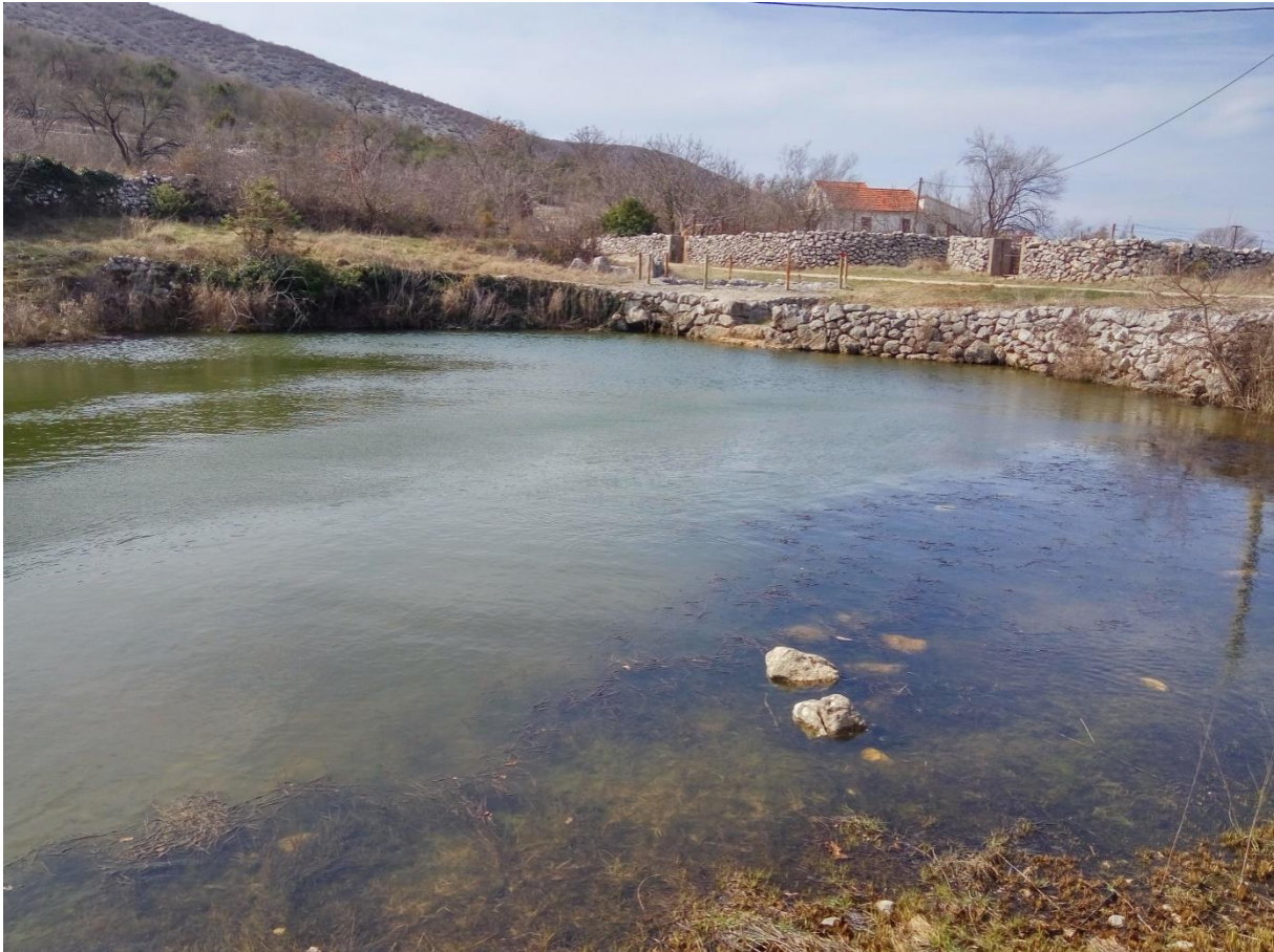
Slika 10 – Lokva Kosmać

Lokva Kosmać nalazi se na istoku sela u zaseoku Šećeri. Smještena je u podnožju brda Znoilo, s njegove sjeverne strane, na kojem se nalaze ostatci gradinskog naselja i mletačke utvrde. Lokva je nepravilnog elipsastog oblika površine 330m 2 . Obzidana je suhozidom, a ulaz joj se nalazi sa sjeverne strane. Sa zapadne strane nalaze se dva manja bunara promjera 4 do 5 metara. I bunari i lokva nalaze se u dobrom stanju te su najbolje sačuvani primjerci u selu. Oko lokve nisu pronađeni pokretni nalazi, već samo jedna gomila 200 metara sjevernije. Sam naziv Kosmać označava stari naziv zaseoka ili pak zasebnog sela kako ga nalazimo u Lučićevom zemljovidu trogirskog kotara iz 1673. godine. 62