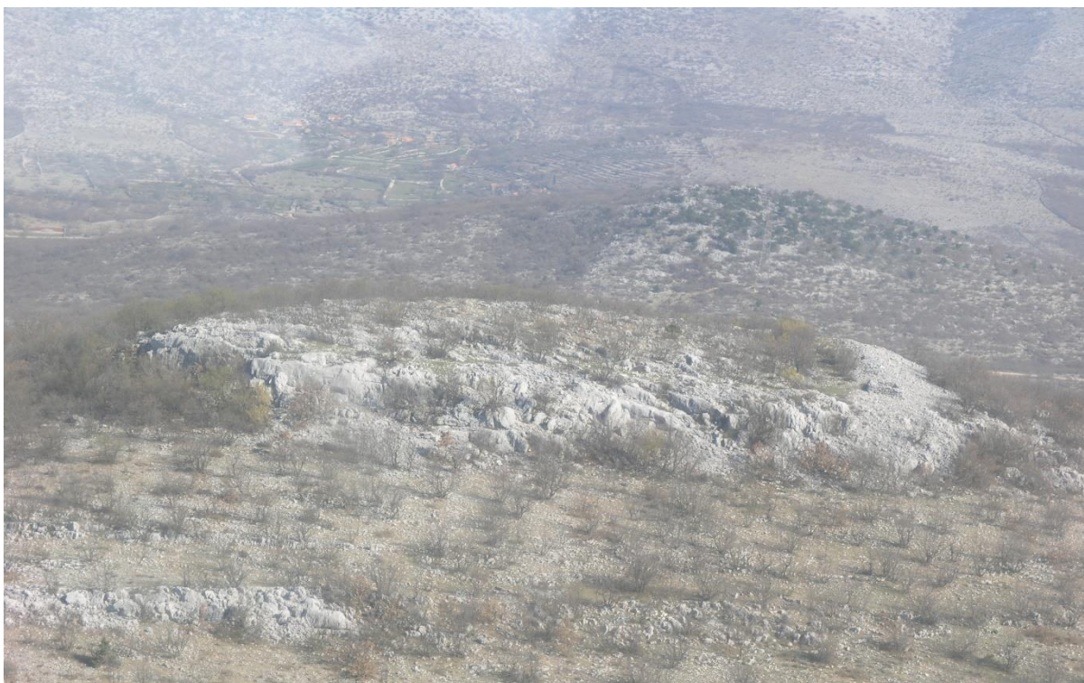
Slika 2 – Gradina Velika Vrljica