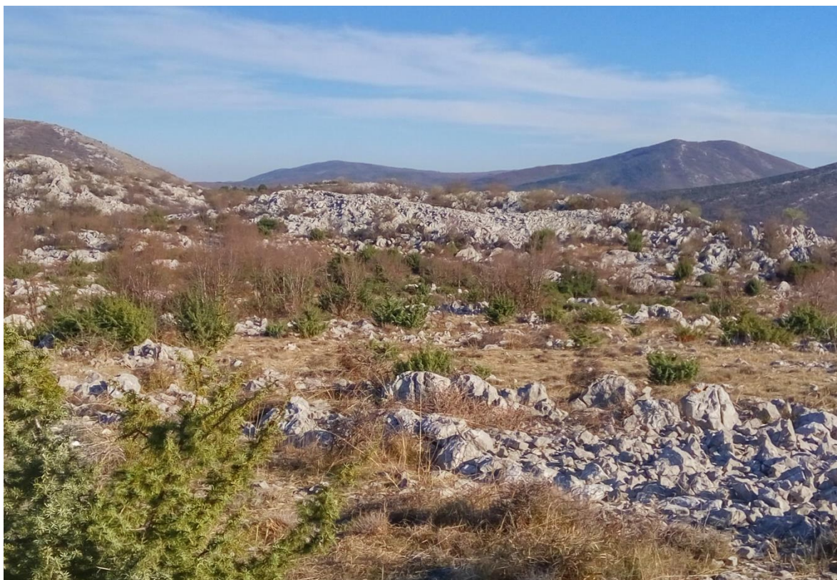
Slika 4 – Gradina Brdašce

Gradina se nalazi na brdu imena Brdašce u istočnom dijelu Primorskog Dolca. Brdo je položeno u smjeru istok-zapad te razdvaja zaseok Bakovići od predjela koji se zove Gornji Dolac. Iz smjera Bakovića, krećući se sa sjevera prema jugu, vrlo je lako pristupiti gradini. Visinska razlika od podnožja do vrha iznosi oko 70 metara, a padina se blago spušta prema selu. S južne strane padina je mnogo strmija i nepristupačnija pa je ovdje razlika u visini gotovo 150 metara. Gradina je polukružnog oblika, izrazito malih dimenzija, te se prema ostacima suhozida može utvrditi kako ogradni zid nije bio visok. Plato gradine ispresijecan je živom stijenom. Time je prostor za trajni boravak unutar gradine sveden na minimum. Suhozid okružuje tri strane gradine, dok se na jugu nalazi strma stijena prirodnog vapnenca. S obzirom na to kako se prema jugu pruža fantastičan pogled na prodolinu, gradina je mogla svoju svrhu imati kao prostor s kojeg se lako nadzirao prirodni put kroz selo. Unutar i uokolo gradine nije pronađeno pokretnih nalaza, a i pregledom okolnog terena nisu uočeni ostatci gomila, stoga je moguće pretpostaviti kako se gradina koristila samo povremeno.