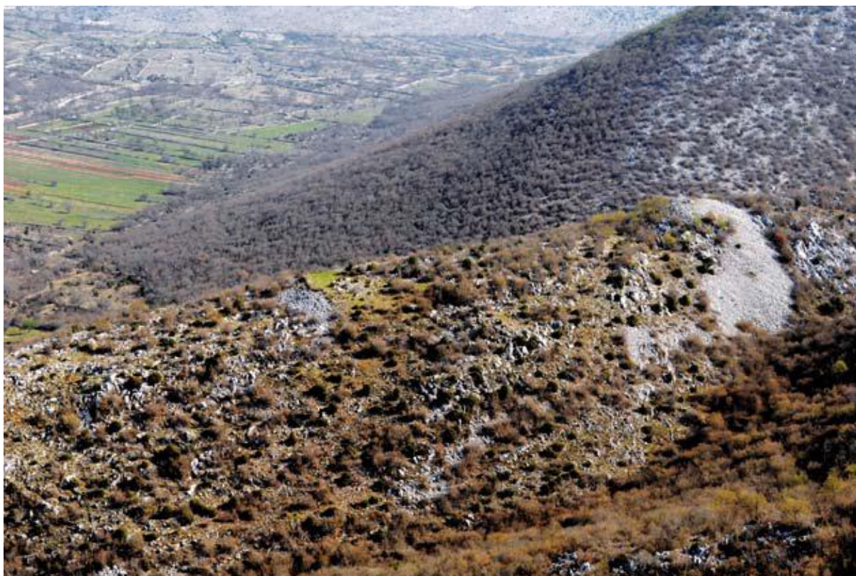
Slika 1 – Gradina Markovine