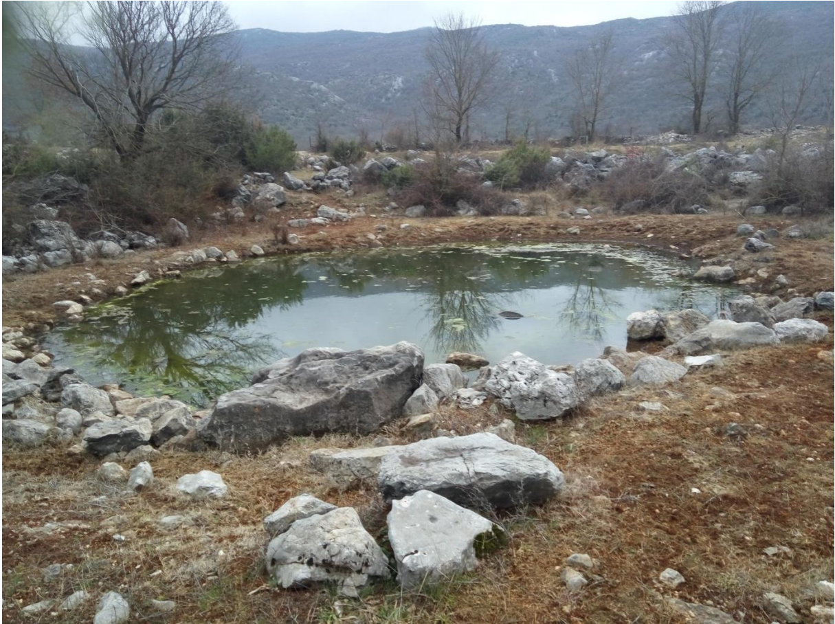
Slika 12 – Lokva Suvova