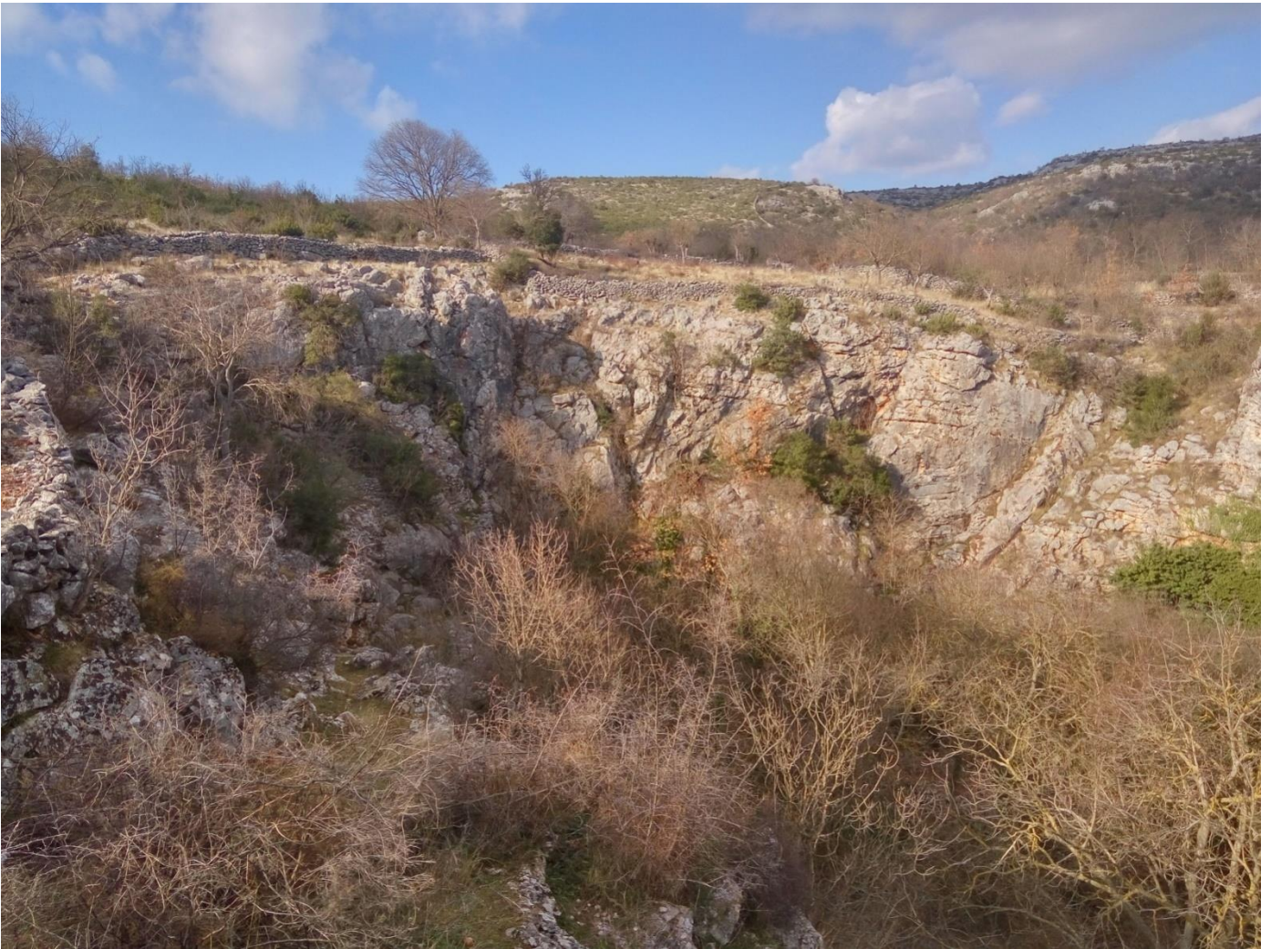
Slika 16 – Samograd u Stojacima