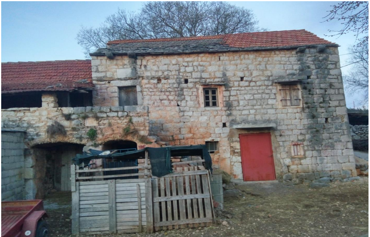
Slika 9 – Istočna kuća Radića

Druga, istočna kuća također sadrži dvije kamene ploče sa natpisima (T. Va). Jedna se nalazi na ulazu u donju etažu, dok je druga na dovratniku gornje etaže. Na pločama su upisane godine 1767. i 1798.