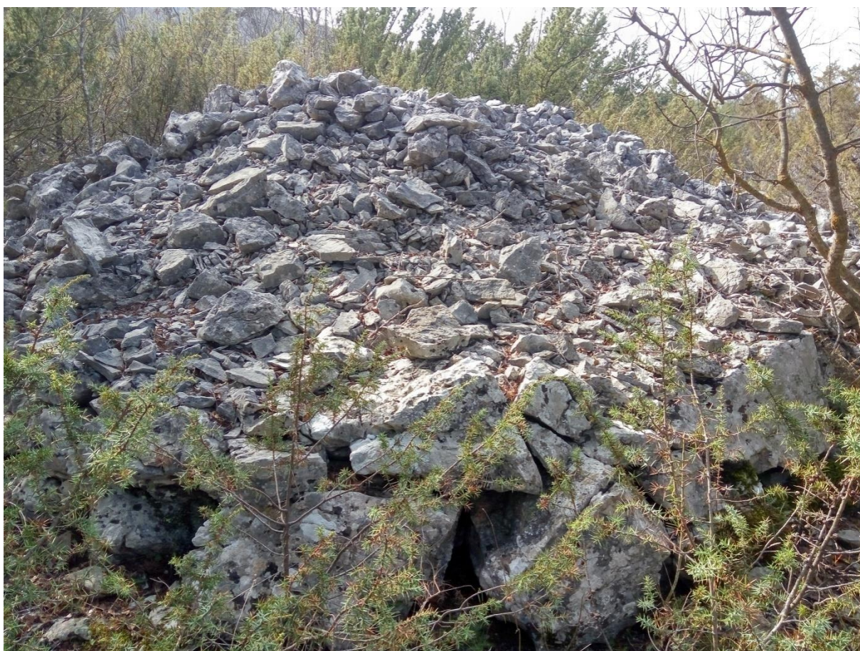
Slika 6 – Gomila pokraj lokve Kosmać

Gomila se nalazi u teško pristupačnom i zaraslom dijelu polja oko 150 metara sjeveroistočno od lokve Kosmać. Promjer joj iznosi 3 do 4 metra, a visina oko 2 metra. Na donjem dijelu uočavaju se veći kameni blokovi koji tvore svojevrsnu ogradu. Uokolo se nalaze brojni suhozidi, međutim nema nikakve razlike među njima. Ne može se ustvrditi jesu li podignuti nekad u davnoj prošlosti ili su pak recentne gradnje.