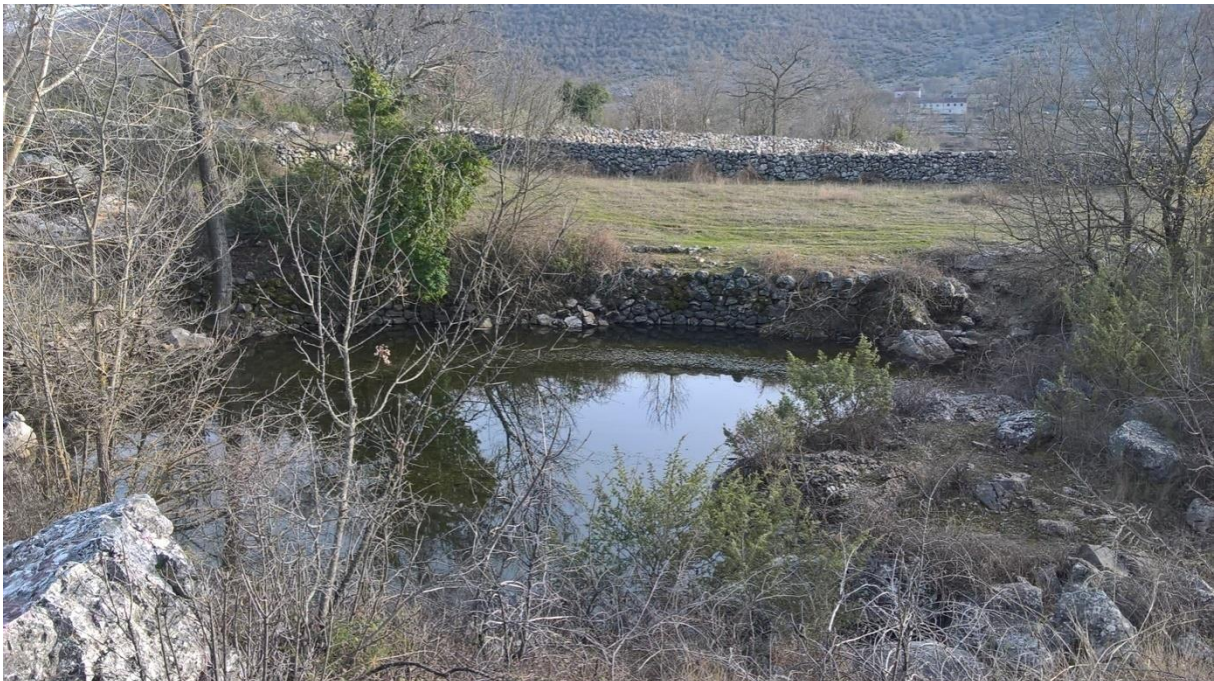
Slika 13 – Lokva Bilin

Lokva je nepravilnoga elipsastog oblika, sa malom istakom na jugozapadnoj strani koja je ujedno služila kao ulaz. Unutrašnjost lokve obložena je suhozidom, no zbog neodržavanja prijeti joj propadanje. Pored lokve, s njene zapadne strane, nalazi se zidani bunar koji je zbog zapuštenosti potpuno obrastao.