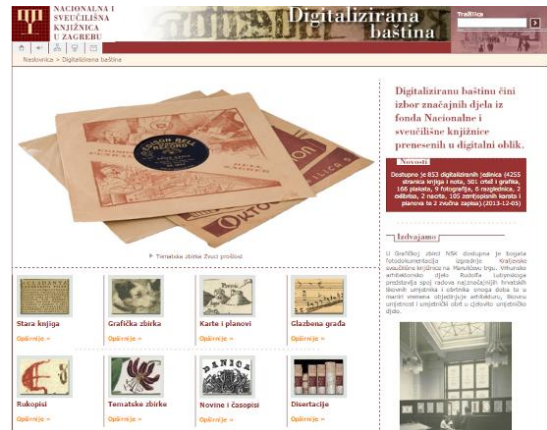
Slika 2. Početne stranice digitaliziranih zbirki u Hrvatskoj: 1) Spalatina, Gradska knjižnica Marka Marulića, Split; 2) Digitalizirana baština iz fonda Nacionalne i sveučilišne knjižnice, Zagreb.

Ministarstvo kulture 2005. godine imenovalo je 13 članova Radne skupine za digitalizaciju arhivske, knjižnične i muzejske (AKM) građe čija je zadaća bila izraditi prijedlog nacionalnog programa digitalizacije AKM građe. U okviru ovog prijedloga Radna skupina je prepoznala tri glavna zadatka: