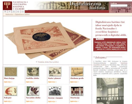
Slika 2. Početne stranice digitaliziranih zbirki u Hrvatskoj: 1) Spalatina, Gradska knjižnica Marka Marulića, Split; 2) Digitalizirana baština iz fonda Nacionalne i sveučilišne knjižnice, Zagreb.

Ministarstvo kulture 2005. godine imenovalo je 13 članova Radne skupine za digitalizaciju arhivske, knjižnične i muzejske (AKM) građe čija je zadaća bila izraditi prijedlog nacionalnog programa digitalizacije AKM građe. U okviru ovog prijedloga Radna skupina je prepoznala tri glavna zadatka: