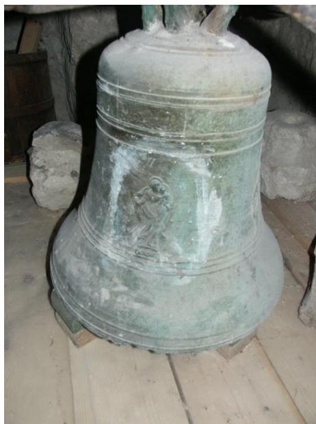
Slika 18. Staro novigradsko zvono