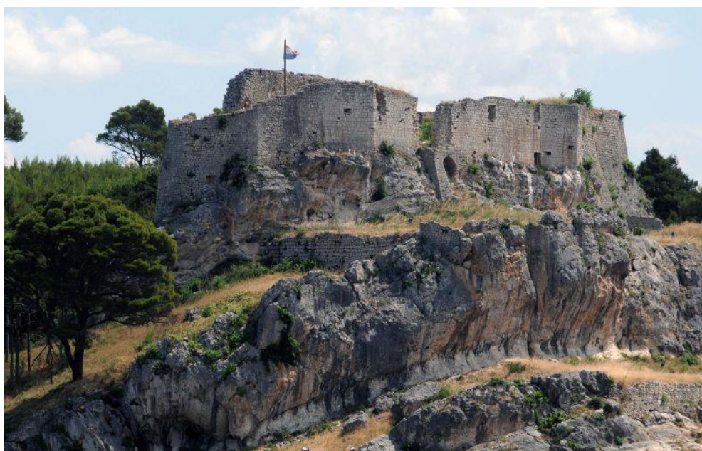
Slika 8. Tvrđava Fortica