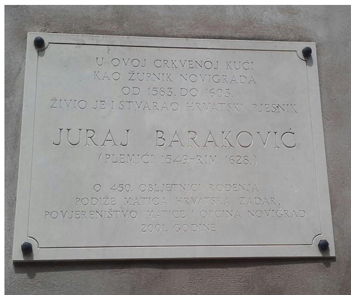
Slika 16. Spomen ploča Jurja Barakovića

Juraj Baraković je bio svećenik koji je djelovao u Novigradu kao župnik desetak godina. Osnovnu i humanističku školu je završio u Zadru, a visoku školu, najvjerojatnije teologiju, u Italiji. Juraj Baraković je bio zadarski pjesnik iz 16. i 17. stoljeća, koji se prvi put spominje kao klerik 1564. godine, a kao svećenik tek 1586. godine. Prema Stjepanu Antoljaku postoje tri dokumenta koja smještaju Jurja Barakovića u Novigrad. Prvi dokument potječe iz 1594. godine u kojem se spominje „Zorzi Barakovich parochod Novegradi“, drugi dokument je iz 1598. godine u kojem je napisano da je Baraković, novigradski župnik, odgovarao poglavarima jer nije bio prisutan u svojoj župi za vrijeme apostolske vizitacije. Zadnji dokument u kojem se govori o Barakoviću je iz 1603. godine u kojem se navodi da je Baraković već tu dvadesetak godina. Nakon 1603. godine odlazi u Šibenik, gdje ostaje do kraja života. 69