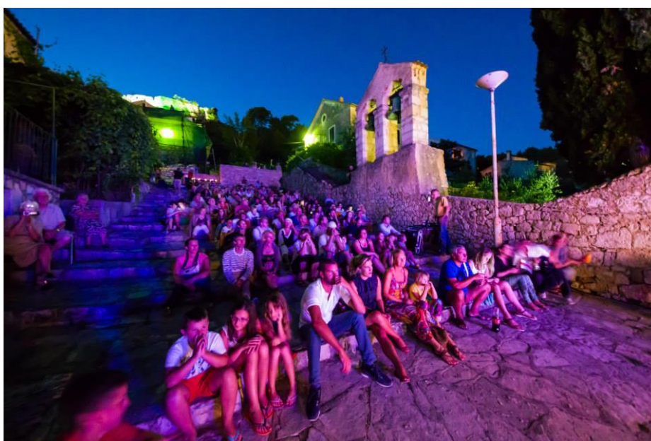
Slika 14. jazz koncert na škalinama