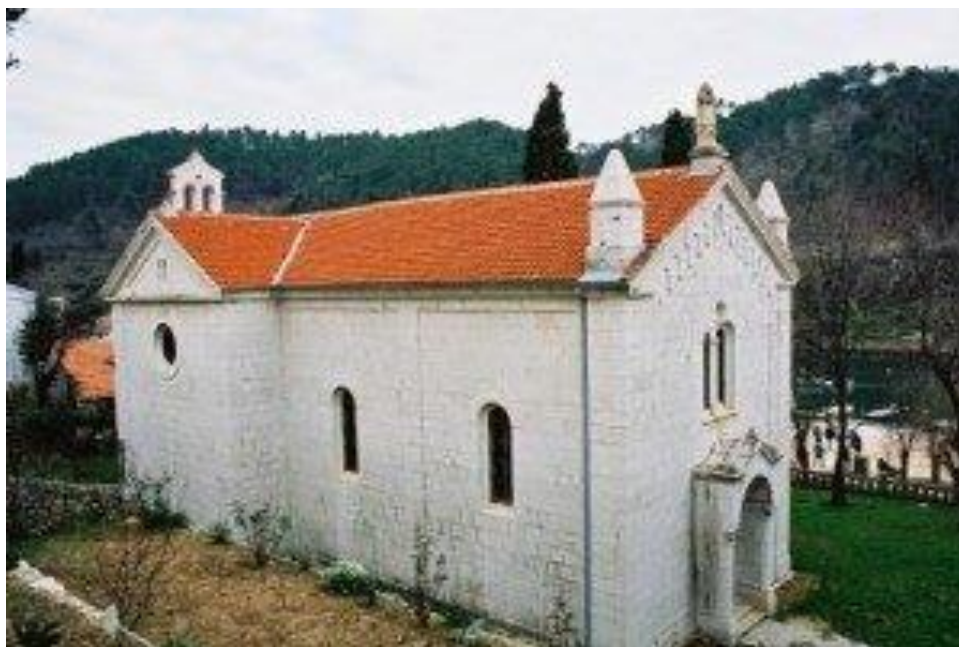
Slika 10. Crkva Porodenja Blažene Djevice Marije