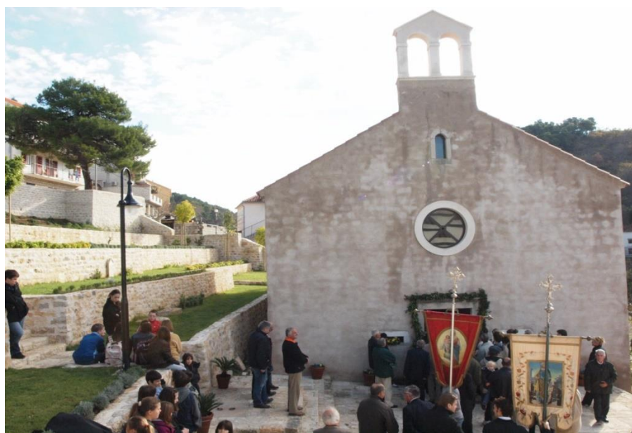
Slika 9. Crkva svete Kate