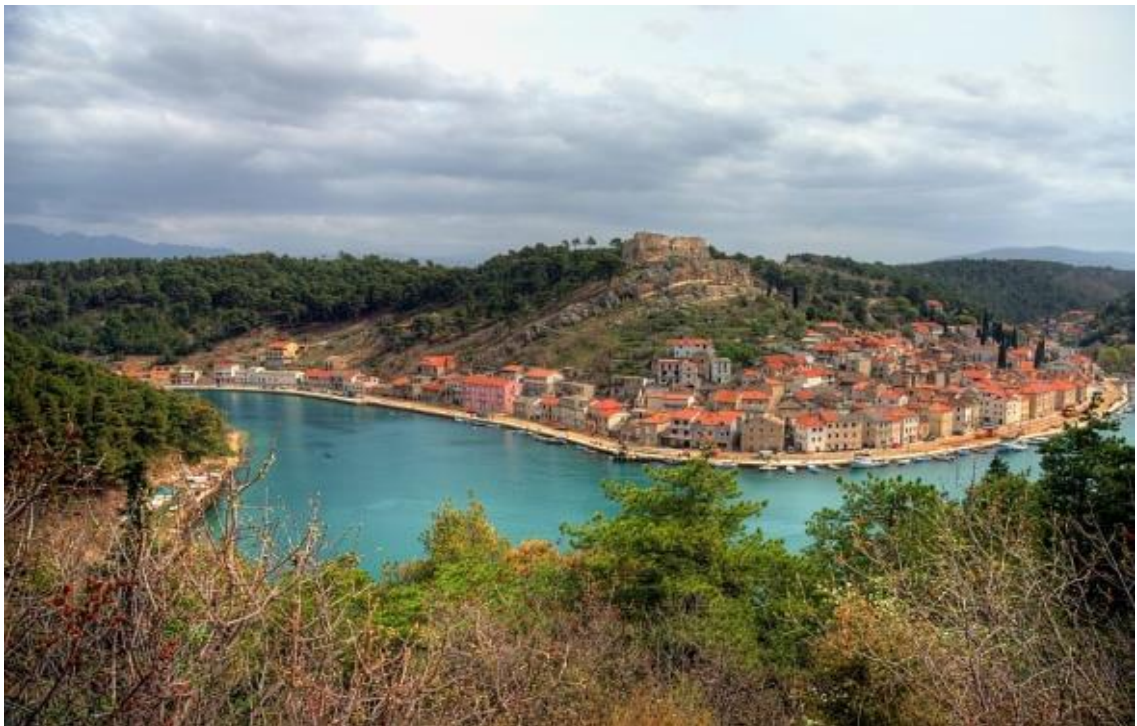
Slika 1. Novigrad