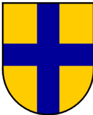
Slika 3. Grb Općine Novigrad