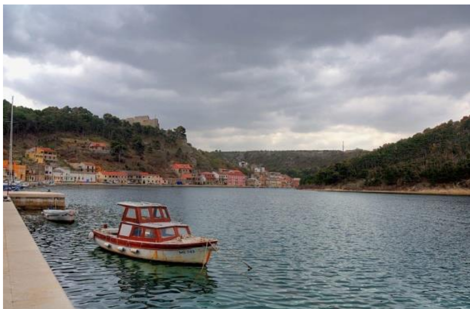
Slika 2. Novigradsko more