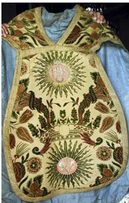
Slika 6. „Planita“ kraljice Elizabete