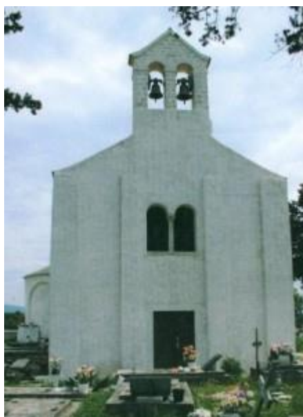
Slika 11. Pročelje crkve svetog Martina