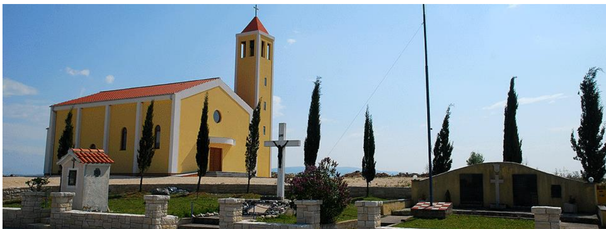
Slika 7. Crkva Pomoćnice kršćana, Paljuv