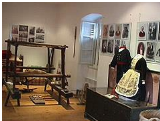
Slika 13. Prikaz unutrašnjosti muzeja