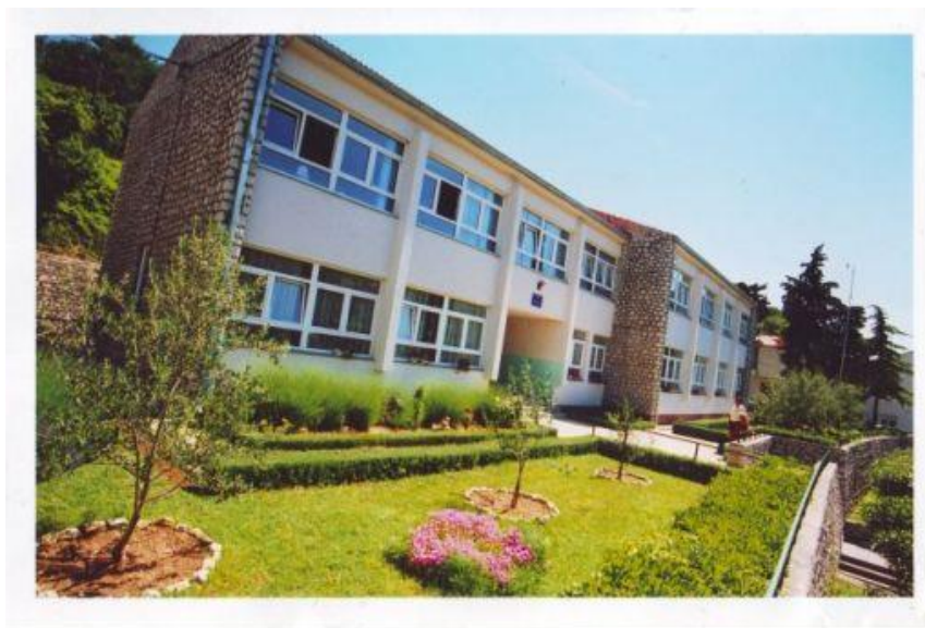
Slika 5. Osnovna škola u Novigradu