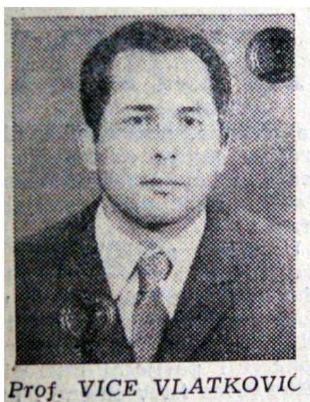
Slika 17. Profesor Vice Vlatković