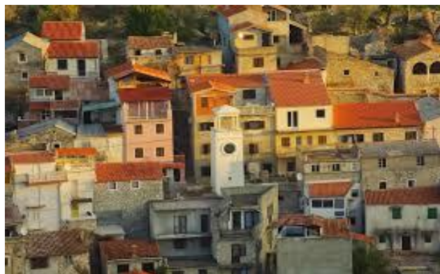
Slika 12. Općinski areloj

https://www.kroati.de/kroatiendalmatien/novigrad.html