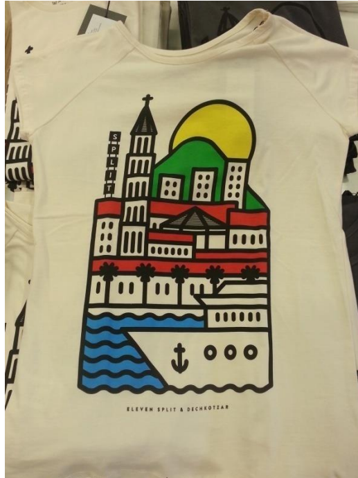
Slika 14: Majica s motivom Splita

Većina magneta kao što su ovi prikazani na prethodnoj ilustraciji zapravo potječe iz Kine. Zapravo je vrlo malo onih koji su proizvodi hrvatskih obrtnika, jer ovako jeftini suvenirni distribuiraju se po još jeftinijim cijenama na tržišta diljem svijeta, pa tako i u Hrvatsku.