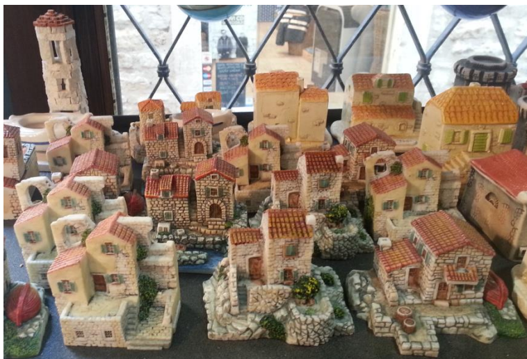
Slika 8: Minijaturne replike kućica

Ovaj suvenir na slici prikazuje Dioklecijanovu palaču i njen nekadašnji, izvorni izgled, a djelo je domaćega obrtnika.