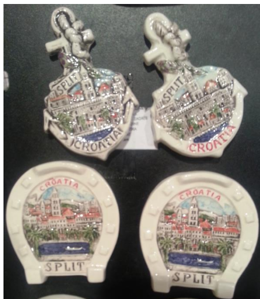
Slika 13: Magneti s motivima Splita

Uz šalice, najbrojniji suveniri markeri su i ostale keramičke posude s natpisima. Na prethodnoj slici prikazane su tri vrste posuda s natpisom, mediteranskoga izgleda s motivom masline i natpisom Croatia .