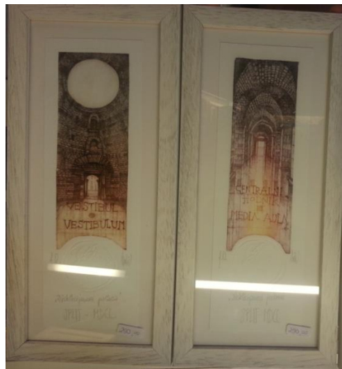
Slika 4: Umjetničko djelo kao suvenir 2

Slični motivi mogu se pronaći i na sljedećoj slici, no prikazani su nešto drugačijim stilom.