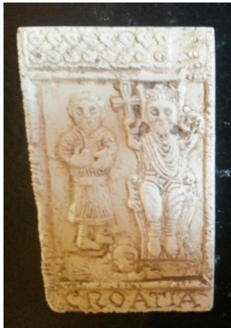
Slika 10: Minijturna replika reljefa s likom kralja

Nešto drugačiji prikaz istih takvih kućica predočava slika 9. Ono što ove kućice karakterizira su znatno intenzivnije boje i svakako činjenica da su ipak proizvod hrvatskog obrtništva.