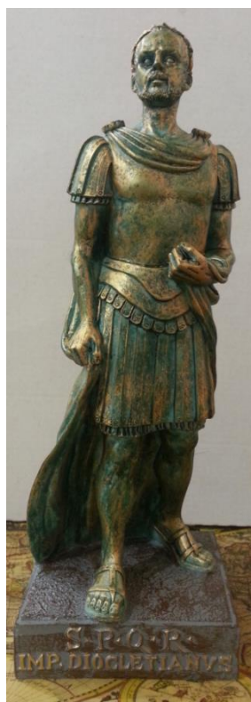
Slika 11: Minijaturna replika cara Dioklecijana