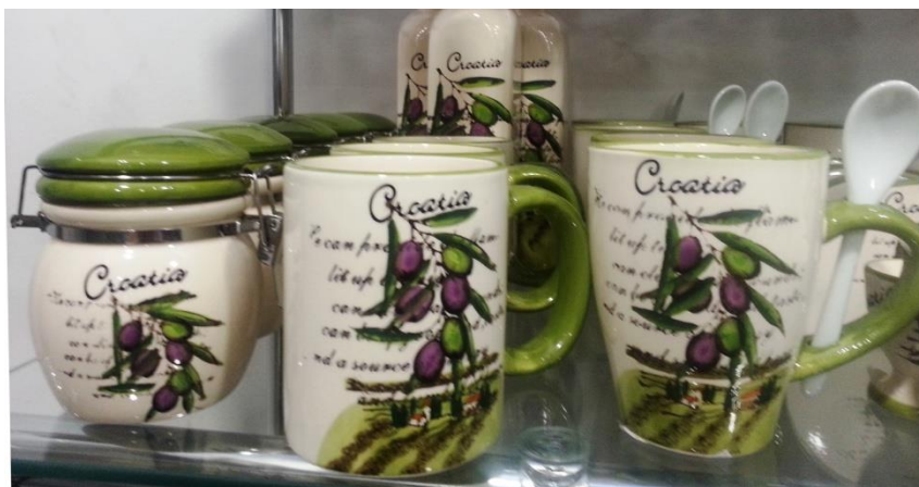
Slika 12: Keramičke posude s natpisima