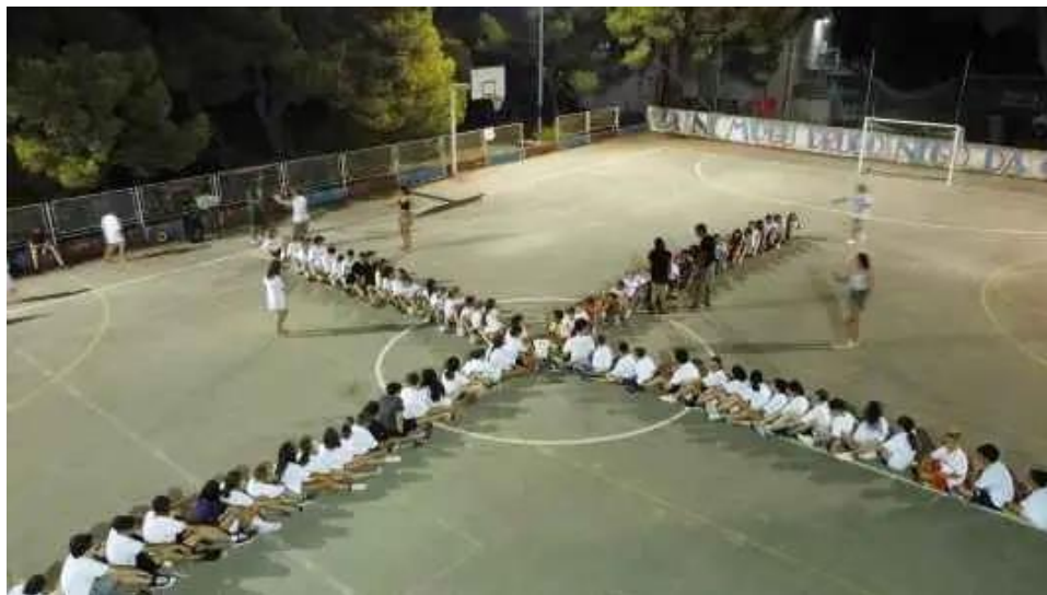
Slika 3. Primjer Eroclub kampa