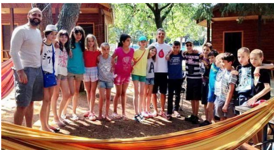
Slika 4. Kamp Veli Jože

Kamp Veli Jože nalazi se u Savudriji, Istra. Posebnost dječje ponude kampa je Ljetni aikido kamp koji se provodi u suradnji sa sportskom udrugom. Aikido, japanska borilačka vještina, promiče nenasilno rješavanje sukoba među djecom, istovremeno usađujući vrijednosti discipline, koncentracije i smirenosti.