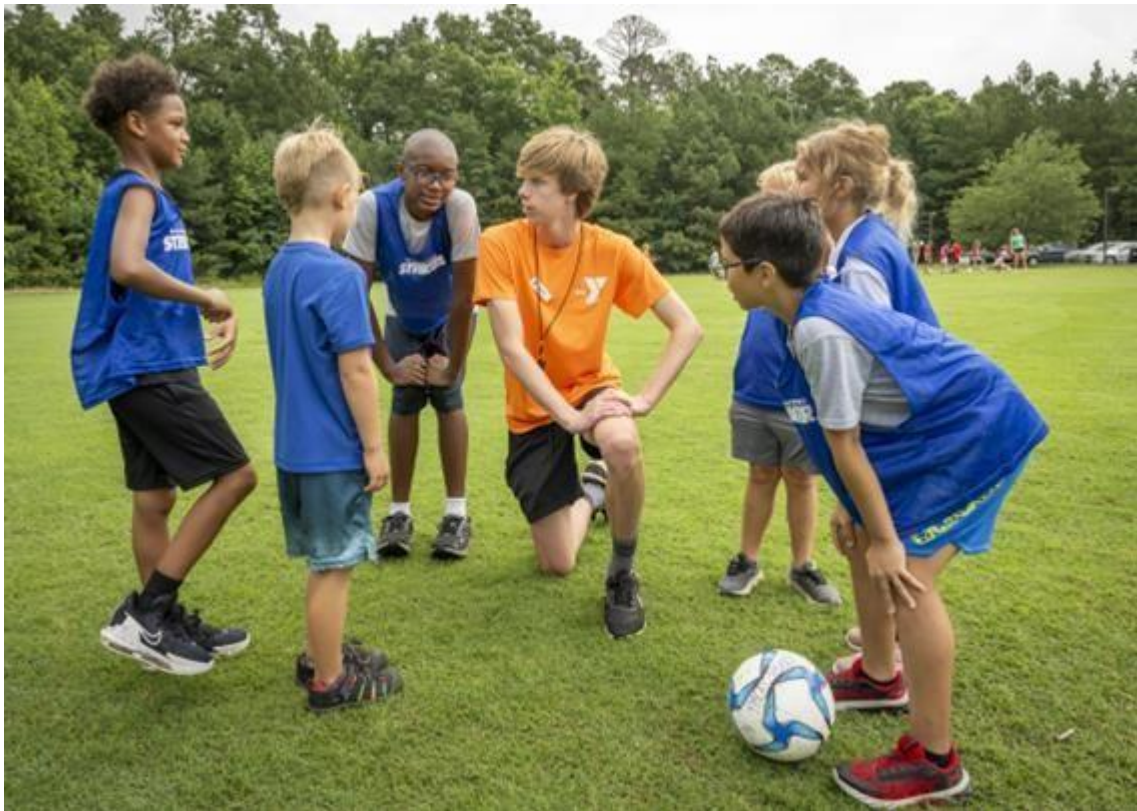
Slika 1. Primjer sportskog kampa za djecu