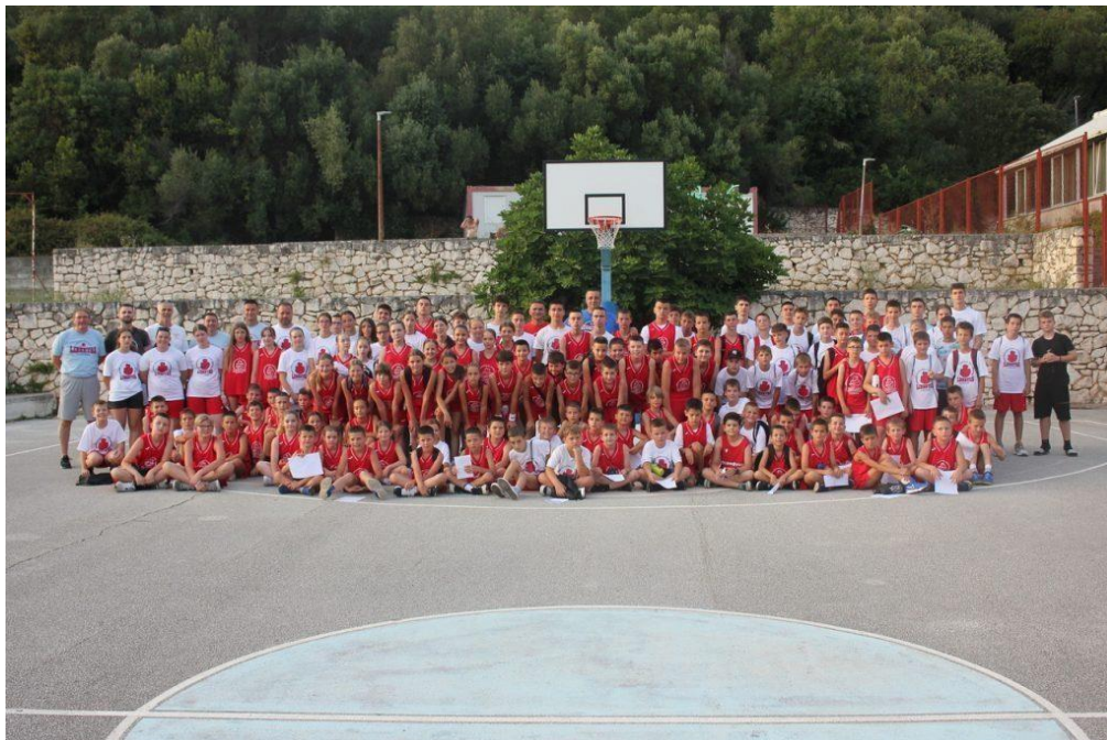
Slika 9. Kamp Libertas

Kamp se održava u Dubrovniku, lokaciji koja pruža izvrstan spoj povoljnoga vremena, robusnih sportskih objekata i blizine mora. Obično se treninzi održavaju na košarkaškim terenima u Dubrovniku, koji imaju najsuvremenije sadržaje za trening i natjecanje. Sudionici vježbaju na vanjskim i unutarnjim terenima, što im omogućuje da se priviknu na različita okruženja za igru. Rasporedi treninga su prilagodljivi; mogu se održavati na otvorenom kako bi se iskoristila ugodna mediteranska klima ili u zatvorenom prostoru kada uvjeti zahtijevaju zaštitu od prekomjerne sunčeve svjetlosti. Prioritet kampa je sigurnost svih polaznika, osiguravanje odgovarajućeg nadzora i zapošljavanje dobro obučениh trenera koji održavaju sigurnu atmosferu treninga. Osim toga, djeca su smještena u udobnim smještajima, poput kampusa ili hotela u Dubrovniku, s opsežnim planovima prehrane i određenim razdobljima odmora. Osim sportskih treninga, Dubrovački košarkaški kamp potiče prilike za društvenu interakciju, omogućujući djeci da sklope nova prijateljstva i poboljšaju svoje društvene vještine. Grupne aktivnosti, uključujući timske igre, izlete i večernja okupljanja, olakšavaju druženje među sudionicima, čineći kamp iskustvom za pamćenje. Također, kamp organizira prijateljske utakmice i mini-turnire pružajući djeci priliku da svoje stečene vještine primijene u praktičnim okruženjima naglašavajući pritom važnost sportskoga duha i poštene igre (KK Dubrovnik, n.d.).