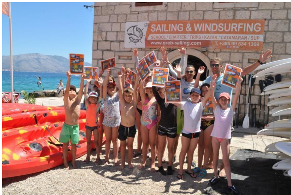
Slika 10. Kamp sportova na vodi na Korčuli

Sigurnost ostaje glavna briga u kampu, a sve aktivnosti vezane uz vodu provode se pod budnim nadzorom iskusnih instruktora koji posjeduju veliko iskustvo u radu s djecom i adolescentima. Sudionici dobivaju sveobuhvatnu obuku o sigurnosnim protokolima na vodi, ispravnom korištenju sigurnosne opreme i osnovnim tehnikama prve pomoći. Kamp je opremljen najsuvremenijim plovilima, uključujući brodove, čamce, daske i kajake, koji su dizajnirani da maksimiziraju sigurnost i udobnost za sve polaznike. Osim tehničkih kompetencija, kurikulum naglašava važnost upravljanja okolišem i očuvanja morskih ekosustava. Programi često uključuju ekološke radionice na kojima djeca stječu uvid u očuvanje mora, odgovorno gospodarenje otpadom i održivo korištenje prirodnih resursa. Smješten uz obalu Korčule, kamp vodenih sportova ima pristup netaknutim i mirnim uvalama, pružajući idealno okruženje za sigurne i ugodne vodene aktivnosti. Mogućnosti smještaja za djecu i obitelji su mobilne kućice, apartmani ili obiteljski bungalovi u sklopu kampa. Objekti obično nude niz bitnih sadržaja, kao što su mogućnosti objedovanja, sportski tereni, fitness centri i bazeni, osiguravajući da sudionici imaju ispunjeno iskustvo dok uživaju u ljepoti prirode.