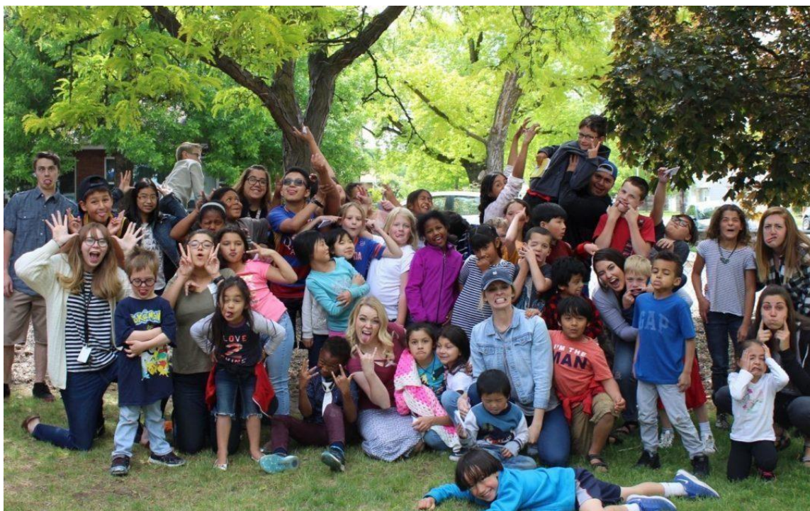
Slika 8. Boys and Girls Club Sports Camps