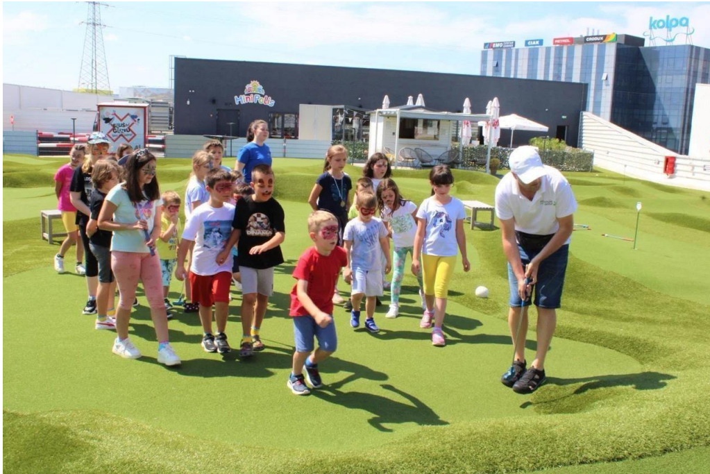
Slika 2. Primjer MiniPolis kampa