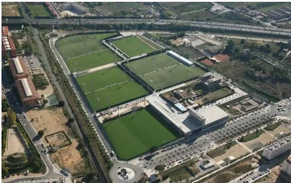
Slika 7. La Masia Football Camp