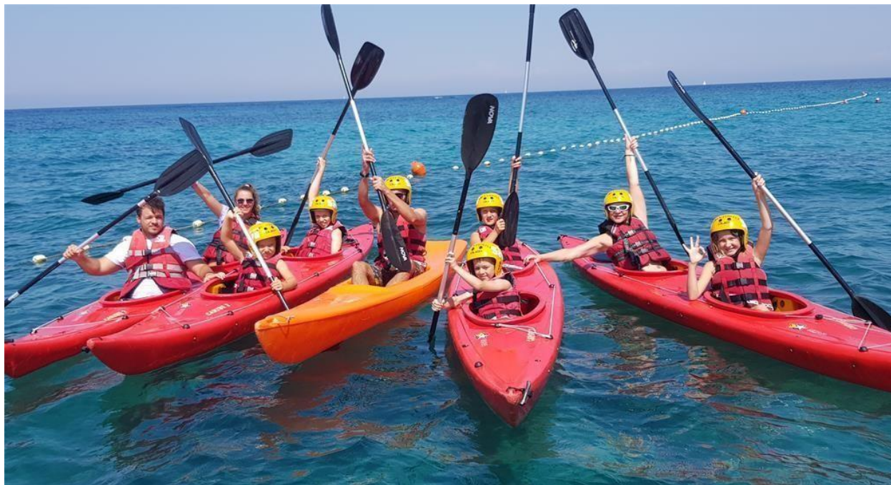
Slika 11. Ljetovanje uz Nazor

priliku komunicirati i učiti o svojim kolegama iz Slovenije, Francuske, Austrije, Njemačke, Češke, Poljske i Rusije. Bave se sportskim aktivnostima i večernjim zabavnim programom koji se održava svake noći tijekom njihovoga boravka. Među najtraženijim desetodnevni programima u kampu je „Avanturistički kamp“ namijenjen mladima od 7 do 18 godina.