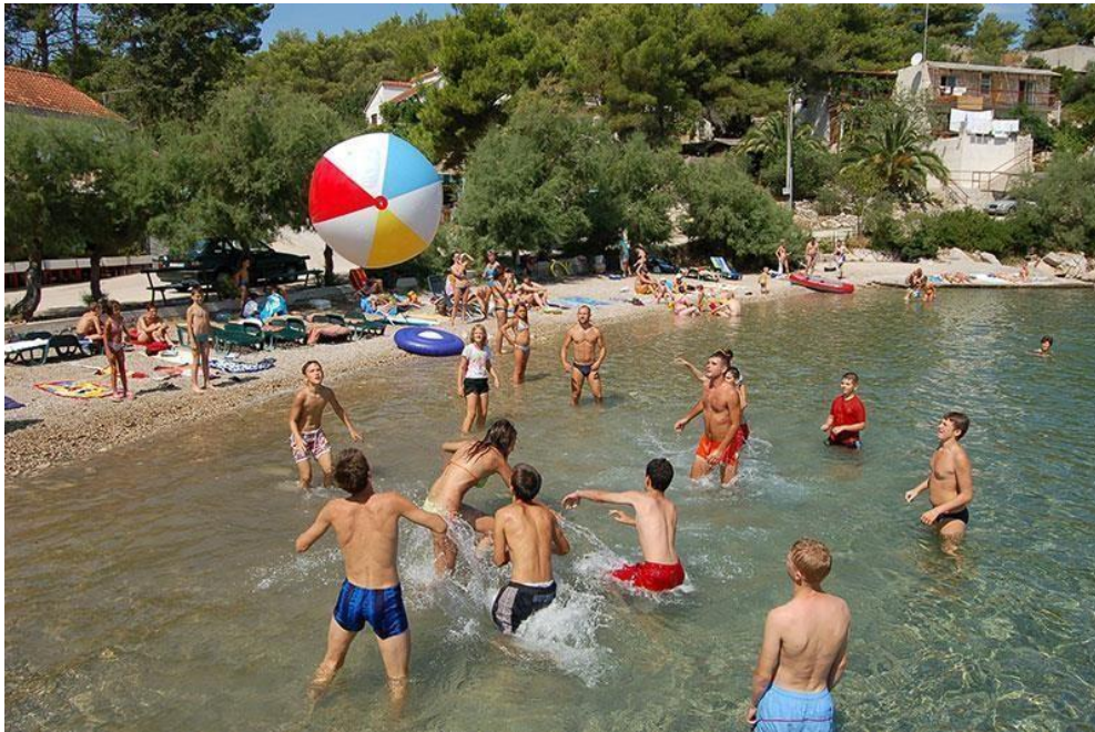
Slika 12. Euroclub – Engleski ljetni kamp

„Euroclub“ ljetni kamp nalazi se u Brodarici, u blizini Šibenika, unutar zaštićene zajednice koja ima privatnu plažu i bazen. Ovaj kamp namijenjen je djeci i adolescentima od 7 do 17 godina. Sudionici imaju priliku birati između niza radionica što im omogućuje da spoje užitek s obrazovnom vrijednošću. Svi programi izvode se na engleskom jeziku, a poduku vode izvorni govornici i kvalificirani edukatori engleskoga jezika s Oxford English Academy. Bez obzira na odabrani program, sudionici se mogu uključiti u široku lepezu sportskih, kreativnih i rekreativnih aktivnosti tijekom svoga slobodnoga vremena, uključujući kvizove, turnire i igre. Ove aktivnosti osmišljene su za povećanje samopoštovanja i poticanje društvene interakcije. Trajanje boravka u English Campu kreće se od jednog do četiri tjedna, s tipičnim dvotjednim razdobljem koje se preporučuje za učinkovito aktiviranje pasivnoga znanja engleskoga jezika. Dodatno, sudionici mogu odabrati opciju ADVENTURE CAMP, dvotjedni program koji obuhvaća različite pustolovne izlete i aktivnosti kao što su jet ski, tubing, streličarstvo, go-karting, adrenalinski park, zip-line, paintball ili rafting na Cetini.