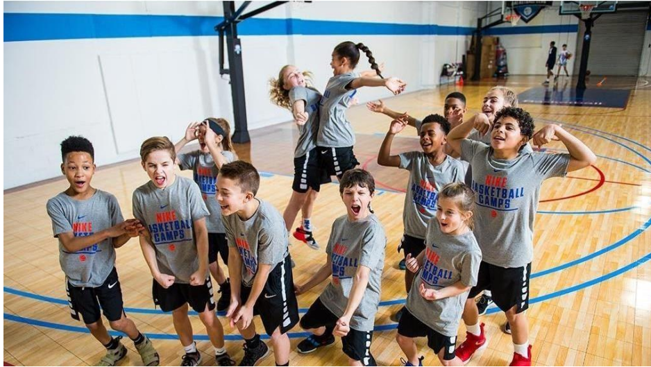
Slika 6. Nike Sports Camps