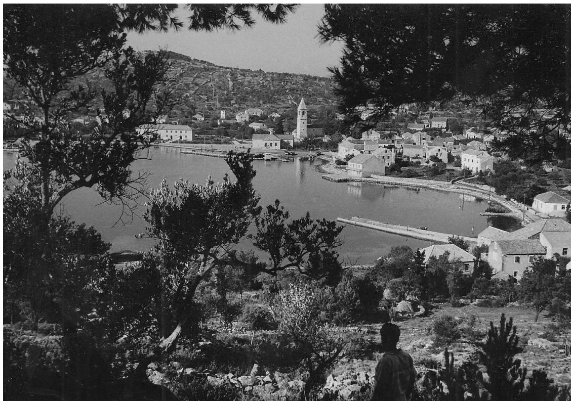
Prilog 21: Zaglav prije izgradnje Zelene punte (razglednica, foto Brkan, 1950-ih godina) 19

Za razliku od nekoć kada je bio velik fizički napor za vožnju brodom na vesla, danas je taj napor znatno umanjen. Veslači su tada bili u prvom planu, dok su današnji brodari zapravo u drugom planu, a sudionici brodske procesije nekad od gužve ni ne znaju tko ih prevozi. Danas se u procesiju uključuju veliki ribarski i turistički brodovi koji mogu primiti velik broj putnika, dok su nekadašnji guci bili mnogo manjih gabarita. S dolaskom komunističke vlasti u Hrvatskoj ponovno je pokrenut kulturni život u mjestu. S gradnjom zadružnog doma koja je završena 1949. godine Kukljičani dobivaju prostorije u kojima se ponovno pokrenuo društveni život. Primjerice, tu su se organizirala gostovanja glumaca iz Narodnog kazališta Zadar, otvorena je dvorana za plesne večeri te se počinje razvijati i glazbeni život s dolaskom učitelja Slavka Raškaja koji je glazbeno školovao mladiće. No, 1959. godine Slavko Raškaj i članovi osnovanog glazbenog sastava odlaze iz Kukljice čime ponovno dolazi do oslabljivanja kulturnog života (Maričić 2003: 77). Tijekom idućih desetljeća nakon 50-ih godina 20. stoljeća, intenzivira se razvoj infrastrukture mjesta, velika pozornost pridaje se uređenju šireg područja priobalja, pa su tako projektirani parkovi zadružnog doma te posađeni borovi i tamarisi (Maričić 2003: 27).