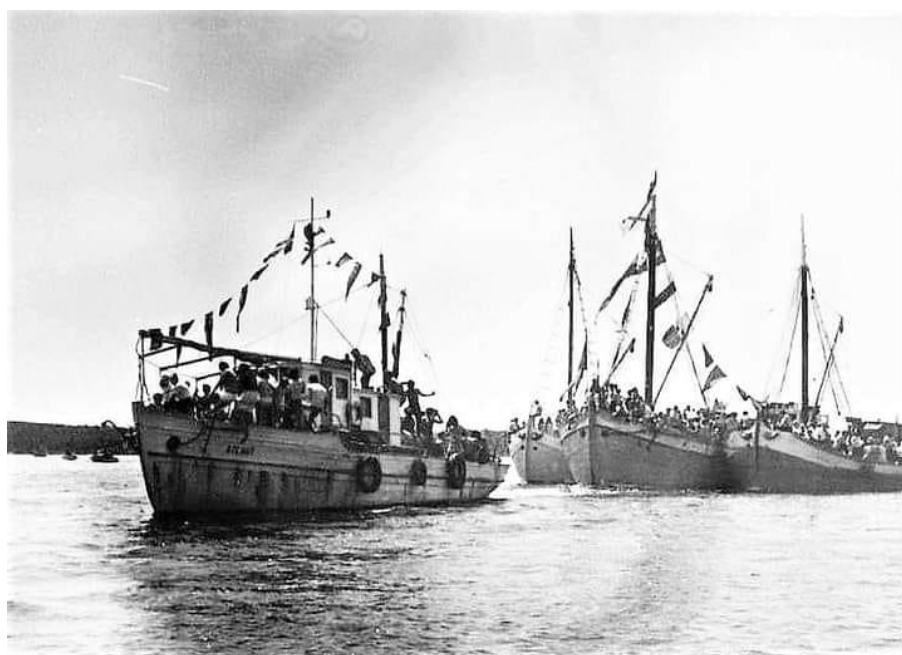
Prilog 25: Brodovi u procesiji 22