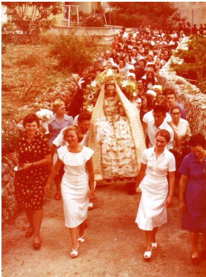
Prilog 23: Procesija 1977. godine