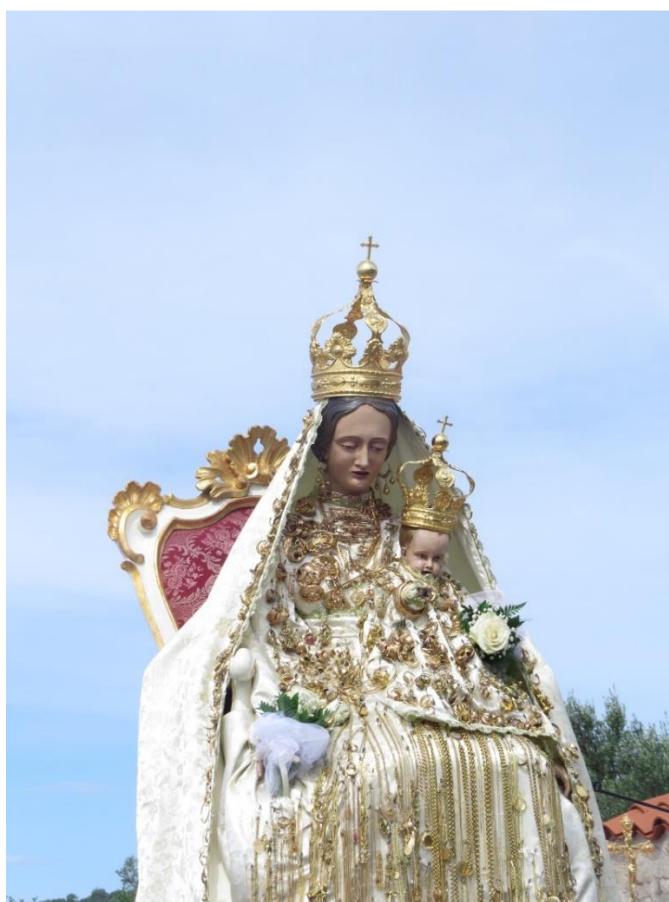
Prilog 5: Kip Gospe od Sniga ukrašen zavjetnim zlatom, 2020. (autorica)

Naše žene zavit su činile Gospu našu zlatom su kitile Ta nakana i dan-danas ista Naša majka sva u zlatu blista Ona nam je ufanje i vira Lipa naša sjana zvizda mora Ona nam je ruža koja cvita Kukljičanom priko bila svita 11