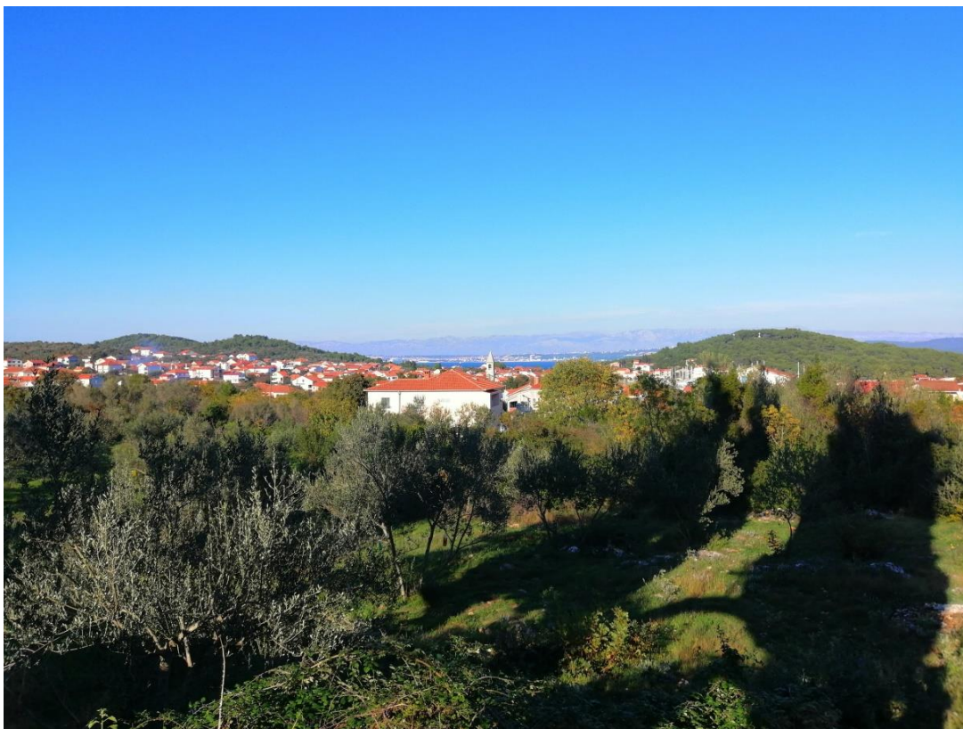
Prilog 2: Pogled na Kukljicu (autorica)

ostatak godine, pogotovo u kontekstu gašenja ljetne turističke sezone. Naime, tada se turističke djelatnosti obustavljaju, te navedeni objekti zatvaraju svoja vrata sve do iduće turističke sezone čime Druga Kukljica ostavlja dojam ispražnjenosti. Glavna cesta kojom se ulazi u Kukljicu, odnosno cesta kojom se silazi s Otočke ceste u Kukljicu mjesto je na kojem percipiram točku prostorne diobe, prijelaz jedne Kukljice u drugu. Na tom mjestu nalazi se plakat većih dimenzija s prikazom Gospe od Sniga 2 i pjesmom koja joj je posvećena. Taj je plakat prvi naglašeni marker u prostoru na koji se neminovno nailazi u kretanju prema mjestu – bilo kroz mjesto ili dok se u Kukljicu dolazi. To mjesto zapravo bih simbolički mogla promatrati kao točku u kojoj se povezuju i umrežavaju društveni prostori koji su fokus mojeg istraživanja i obuhvaćaju identitetske i turističke odrednice zajednice, vidljive ujedno i u prostoru.