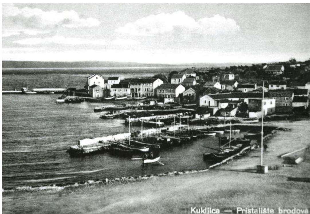
Prilog 1: Razglednica iz razdoblja prije Drugog svjetskog rata 1

Osim uzgoja proizvoda za vlastite potrebe u većim količinama proizvodilo se vino i maslinovo ulje namijenjeno prodaji u gradu što je imalo veliku ekonomsku važnost za otočane. Vinogradarstvo u Kukljici stagniralo je tijekom vinske krize 1890. godine, pa se obnovilo borbom protiv peronospore nakon Prvog svjetskog rata, ali ponovno stagnira i gotovo nestaje nakon Drugog svjetskog rata (Maričić 2003: 115-119). Ribarstvo je kao važna privredna grana u Kukljici započelo u prvoj polovini 19. stoljeća, iako je to ondje jedna od najvažnijih djelatnosti stoljećima. U to vrijeme uz Kali, Sali na Dugom otoku i otok Iž, Kukljica je bila prepoznatljiva kao vrlo važno ribarsko mjesto u zadarskom arhipelagu. Zbog različitih društveno–ekonomskih promjena i ribarstvo u Kukljici imalo je svoje padove, međutim od 70-ih godina 20. stoljeća ponovno je ojačalo. Početkom 2000-ih Kukljica je imala 14 jakih ribarskih brodova s dubinskim kočama (Maričić, 2003: 120), dok ih danas (2024), primjerice, prema mojim kazivačima, ima sedam.