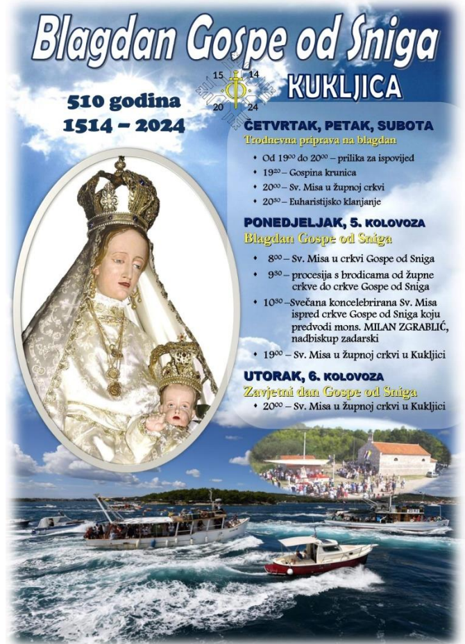
Prilog 4: Plakat programa proslave iz 2024. godine

Dakle, okupljanje mještana počinje ispred župne crkve sv. Pavla u središtu Kukljice kada se iznose zastave bratovština i Gospe od Sniga. Mještani zatim formiraju procesiju koja se odvija u svečanom tonu. Na početku procesije su župnik, sakristani, muškarac koji nosi križ, za njim idu žene (od kojih su neke članice KUD-a Kukljica) i mlade djevojke odjevene u bijele haljine 10 te ostali mještani. Procesija se od župne crkve spušta i pješice prolazi kratak put uz more kroz mjesto do privezišta gdje brodari čekaju sa svojim brodovima različitih veličina i namjena. Kada procesija pristigne do pristaništa, sudionici se spontano raspoređuju po brodovima. Vlasnici brodova dočekuju sudionike te im pomažu da se smjeste u brodove prije polaska. Brodarima je čast prevoziti sudionike te se velika pozornost pridaje pripremi brodova za procesiju. U danima prije hodočašća, brodovi se čiste, uređuju i ukrašavaju šarenim