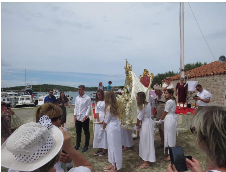
Prilog 6: Djevojke u bijelom podižu kip Gospe od Sniga prije ulaska u brodsku procesiju, 2020. (autorica)

vrste ponašanja zbog kojih antropolozi ljude smatraju hodočasticima neminovno će se mijenjati tijekom vremena (Coleman 2002: 362), jer je riječ o fluidnom fenomenu koji je vrlo prilagodljiv različitim promjenama.