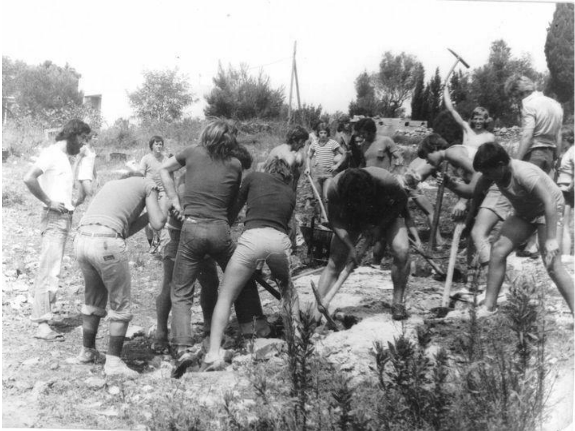
Prilog 22: Jedna od radnih akcija u Kukljici 1976. godine 20

Turizam u Kukljici postaje se intenzivno razvijati kroz djelatnosti turističkog naselja Zelena punta koje je s počelo 1971. godine. U istom razdoblju praksa štovanja Gospe od Sniga vraća se u prvotni ambijent – ponovno se počinje odvijati brodskim putem, ali ne na vesla, nego u motoriziranim brodovima. Raniji oblici turizma u Kukljici počeli su i prije, no sa Zelenom puntom započeo je prvi masivniji i organiziraniji oblik turizma čije je djelovanje utjecalo na širu zajednicu. Zelenu puntu neki mještani nazivaju nekadašnjom „žilom kucavicom“ mjesta te se razdoblje turističkog procvata od 70-ih godina 20. stoljeća pa do Domovinskog rata iz perspektive mještana smatra razdobljem vrlo snažnog razvoja mjesta koje postaje prepoznatljivo na karti Jadrana. Zelena punta imala je kapaciteta za više stotina turista i posjetitelja, u njoj su se organizirali razni zabavni i glazbeni događaji, te je oko 60 mještana bilo u njoj zaposleno. I danas u sjećanjima kazivača ovo se razdoblje ističe kao vrlo perspektivno i povoljno u kontekstu razvoja Kukljice. Osim u ekonomskom smislu, u Kukljici