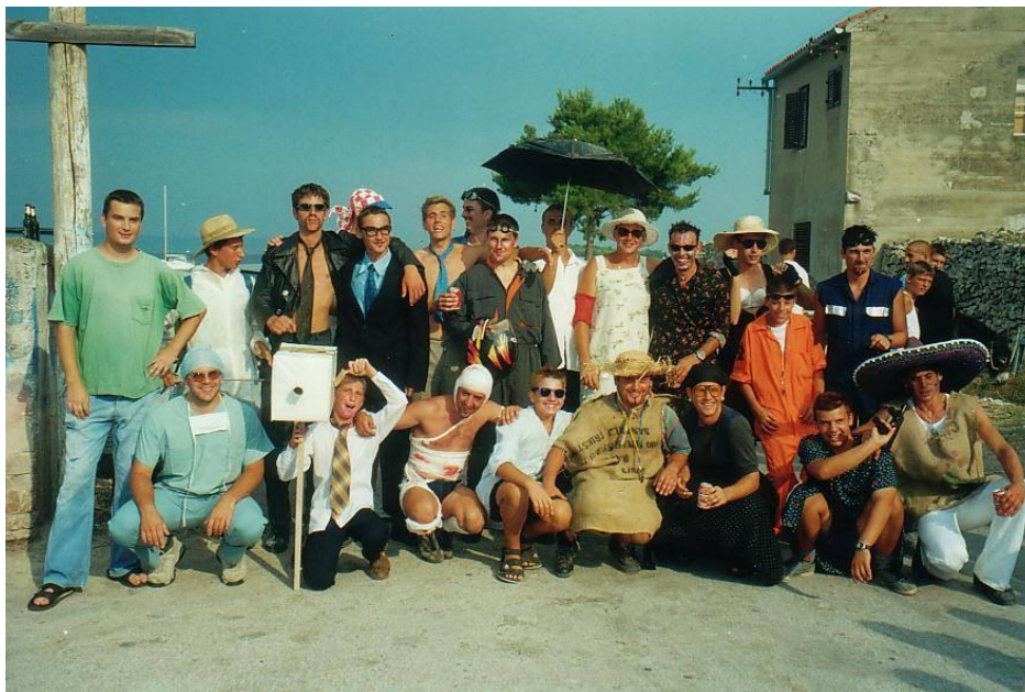
Prilog 33: Pripreme za feštu 1999. godine 34

To je glavna fešta Kukljice u cijeloj turističkoj sezoni, koja djeluje kao simbol njihove zajednice i iznutra i prema van.