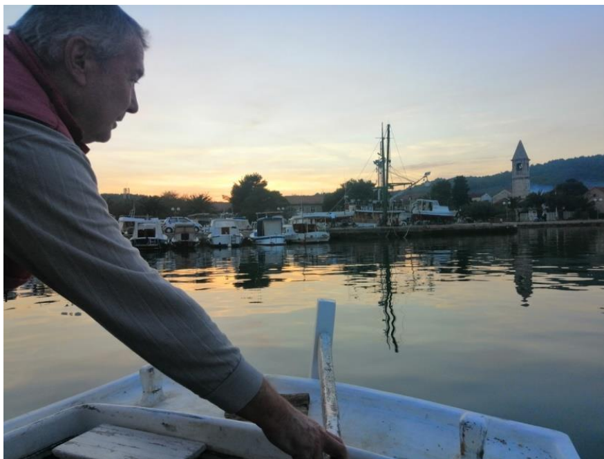
Prilog 15: Isplovljavanje „u lignje“ sa sugovornikom

Naime, provođenjem vremena među zajednicom istraživač nastoji postići percepciju o sličnosti između sebe i grupe, jer cilj mu je da ga se s vremenom prepoznaje kao nešto poznato (Atkinson i Hammersley 2005: 39). No, neovisno o pandemiji COVID-19 koja je mogla utjecati na proces povezivanja s mještanima, važno je uzeti u obzir da se ovo istraživanje provodilo u maloj, gusto premreženoj zajednici te da pokušaj pristupanja izvana ne može biti zajamčen. To su istraživanja koja zahtijevaju upornost, strpljenje, prihvaćanje neizvjesnosti, promišljanje strategija u procesu umrežavanja uz pomoć pojedinaca koji omogućuju ulaz u određene dijelove terena što katkad zahtjeva i ponavljanje pokušaja ulaska u određene aspekte zajednice (Feldman i sur. 2003: 55,57). Važno je prihvatiti da čak i kada se pristup određenom aspektu terena i ostvari to ne jamči da će ostati otvoren, već je nužno raditi na njegovu održavanju. Osim toga, u procesu dolaženja do podataka tijekom etnografskog istraživanja nekad je potrebno i pregovaranje, u smislu suptilnog manevriranja u poziciji iz koje je moguće dobiti određene podatke (Atkinson i Hammersley 2007: 61).