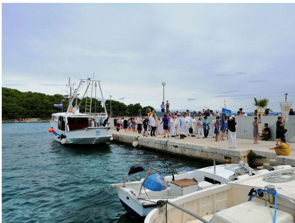
Prilog 8: Vraćanje iz brodske procesije s kipom Gospe 2020.godine