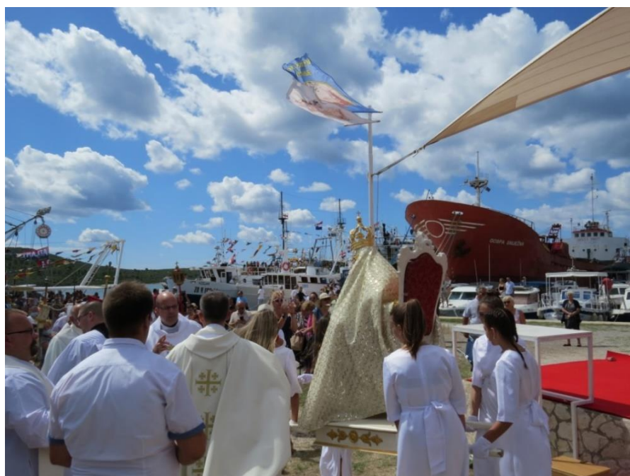
Prilog 10: Djevojke u bijelom odnose kip Gospe od Sniga u brod, 2021.