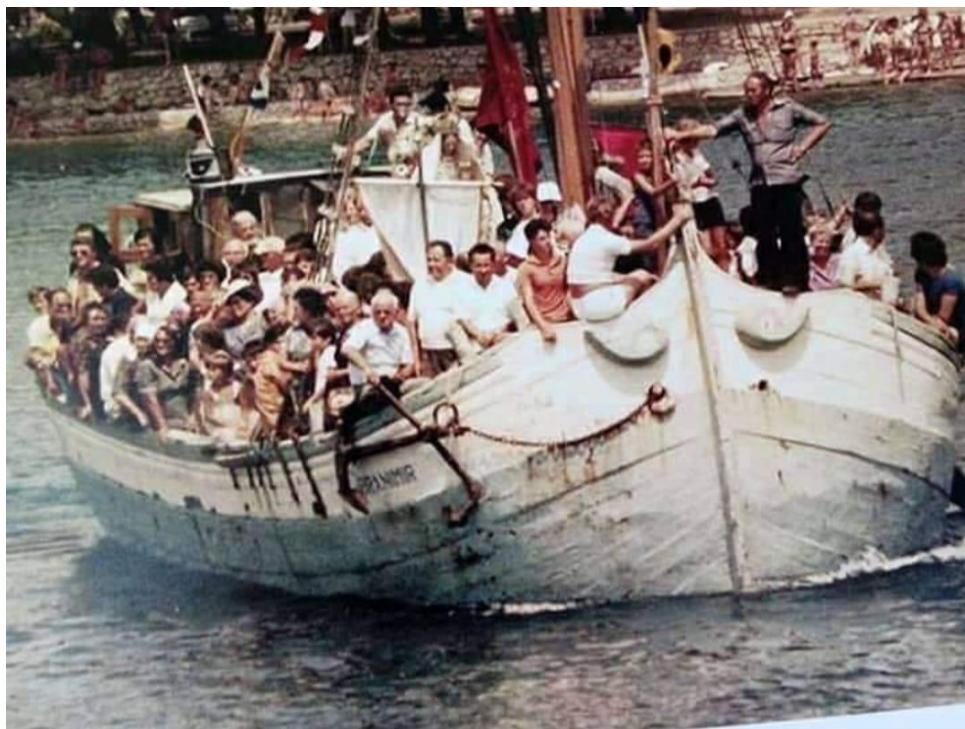
Prilog 24: Prevoženje kipa Gospe od Sniga u trabakulu Branimir 1979. ili 1980. godine 21