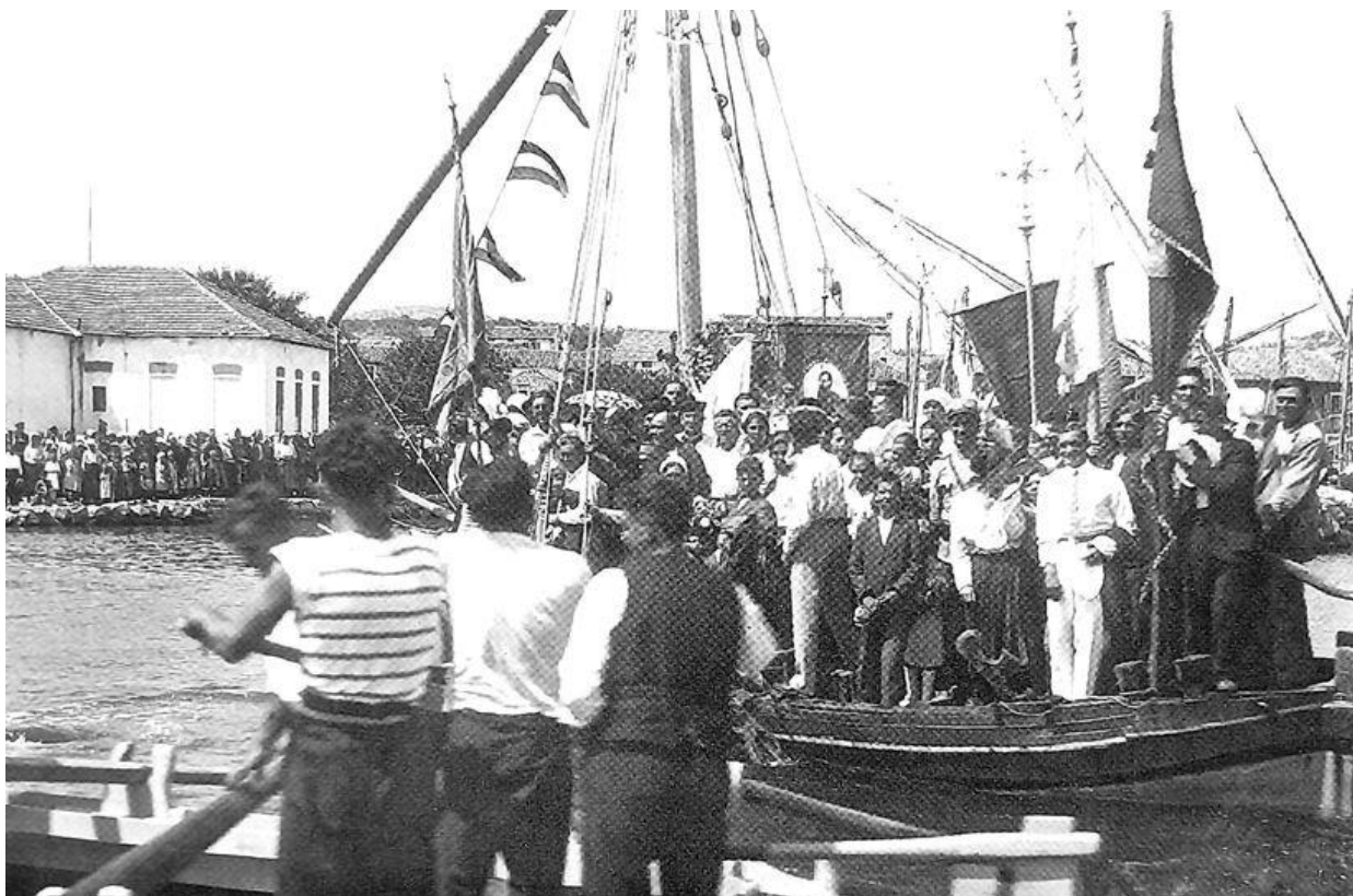
Prilog 18: Proslava Gospe od Sniga prije Drugog svjetskog rata 16

Međutim, u razdoblju od kraja 40-ih pa do početka 70-ih godina 20. stoljeća, procesija se povremeno održavala u promijenjenom obliku. Naime, prema mojim kazivačima, tadašnje jugoslavenske vlasti nisu podržavale održavanje vjerske procesije brodom, stoga su mještani u procesiju išli kopnenim putem. Riječ je o starom putu, kako ga mještani nazivaju, kojim se išlo uzbrdo preko naselja do uvale Ždrelašćica. Iz sjećanja jedne kazivačice put je trajao otprilike 45 minuta te je bio poprilično zahtjevan, pogotovo iz perspektive nositeljica kipa.