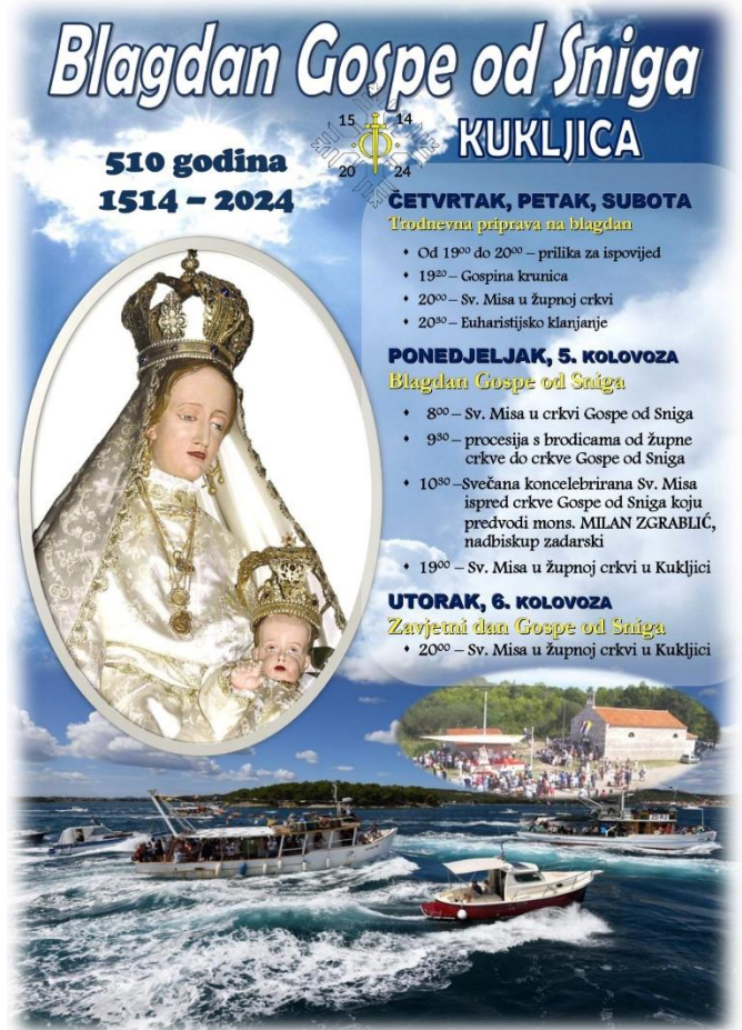
Prilog 4: Plakat programa proslave iz 2024. godine

Dakle, okupljanje mještana počinje ispred župne crkve sv. Pavla u središtu Kukljice kada se iznose zastave bratovština i Gospe od Sniga. Mještani zatim formiraju procesiju koja se odvija u svečanom tonu. Na početku procesije su župnik, sakristani, muškarac koji nosi križ, za njim idu žene (od kojih su neke članice KUD-a Kukljica) i mlade djevojke odjevene u bijele haljine 10 te ostali mještani. Procesija se od župne crkve spušta i pješice prolazi kratak put uz more kroz mjesto do privezišta gdje brodari čekaju sa svojim brodovima različitih veličina i namjena. Kada procesija pristigne do pristaništa, sudionici se spontano raspoređuju po brodovima. Vlasnici brodova dočekuju sudionike te im pomažu da se smjeste u brodove prije polaska. Brodarima je čast prevoziti sudionike te se velika pozornost pridaje pripremi brodova za procesiju. U danima prije hodočašća, brodovi se čiste, uređuju i ukrašavaju šarenim