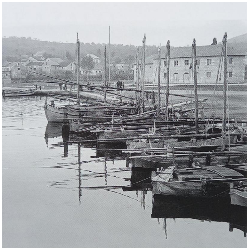
Prilog 20: Stari brodovi na jedra u portu 1960. godine 18

jedina počast koju su imali, a onda bi oni regatali, ko će se okrenuti, ko će napraviti više điri oko Gospe. (...) ali onda poslije rata potpuno se promijenio tip te procesije, više nema tog regatanja. Sad se isto okreću oko Gospe, ali gliseri dakle to je palo na taj motorizirani nivo kad dolaze čak i opasnosti da jedan drugog udari. Počela je dolaziti lučka kapetanija da malo to nadgleda. Marija je dolazila u prvo vrijeme, obvezno dolazila mi rečemo u porat. To znači tu ispred škole, tu se napravilo dosta prostora, ako je koji brod bio vezan, to bi odvezali, napravili joj mjesto, tu je došo taj veliki brod, iskricali su Mariju, a onda su se postavile žene u red jedna za drugom, klečale su, jedna iza druge sve mimo škole pa sve do gore do ulaza u crkvu. Stalno je bio red, a ne samo naše ženske. To su dolazile ženske iz Kali, iz Preka, iz Pašmana možda još i najviše, Pašmonke. Na taj su žene molile, jer svaka je imala...ako je bolest u kući, imala je posebnu svoju molitvu da Marija... ljudi su častili Mariju jako. Tako da, ali kad je to prestalo, prestalo je to ja ne znam kada točno, ali moralo je prestati već oko 70-e godine, kad su prebacili da se iskrca Marija na rivi.