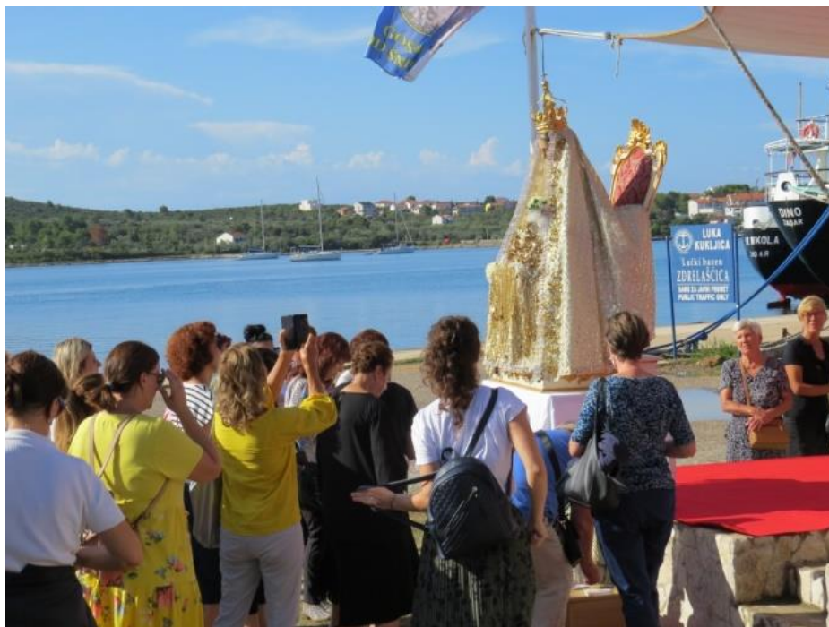
Prilog 9: Žene prilaze kipu Gospe od Sniga, 2021.