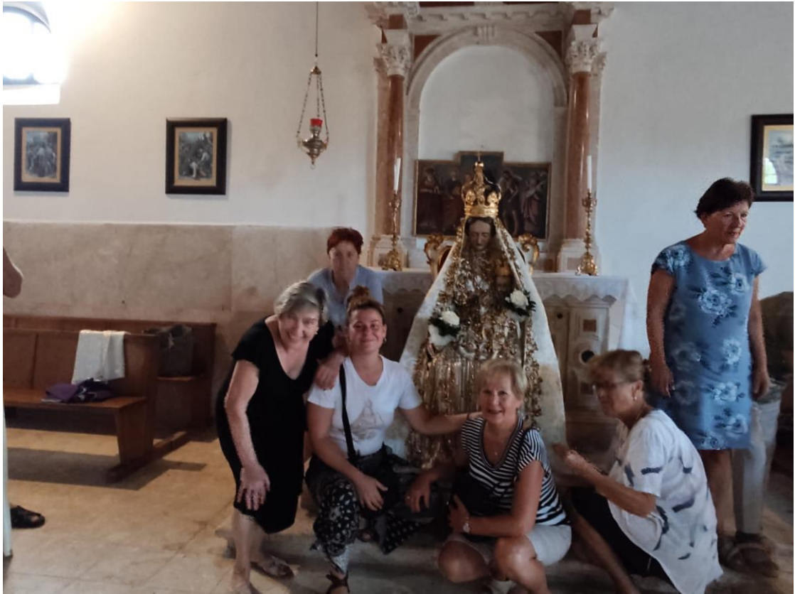
Prilog 16: Sudjelovanje u ukrašavanju kipa Gospe od Sniga s mještankama, 2024. (autorica)

Članovi zajednice svojim radnjama i ulogama posljedično utječu na funkcioniranje zajednice, pa tako naposljetku i na odražavanje prakse hodočašća. S obzirom na to da je riječ o društvenim prostorima, promatram ih kao fluidne, fragilne i promjenjive pod pretpostavkom da članovi određenih skupina mogu aktivno producirati, ali i pregovarati, moguće i promijeniti svoju poziciju, ulogu i interes koji ih je za istu skupinu vezao. S prethodno opisanim vrlo usko povezana je i činjenica da je za svaku skupinu potreban novi, poseban ulaz s obzirom na to da svaka ima svoja pravila i načine funkcioniranja. Iz metodološki relevantnog gledišta, pristup svakoj skupini zahtijevao je nova promišljanja, planiranje i različite načine pokušaja povezivanja s njezinim akterima, često uz pomoć pojedinaca koji nisu dio promatrane skupine. U tom smislu potrebno je imati nekoga tko pripada zajednici, koja može stajati uz istraživača, odnosno osobu koja će pomoći istraživaču u izgradnji mreže ljudi (Feldman et al. 2003:55). Prva kontakt-osoba koju sam već ranije spomenula, poznanstvom i dobrim odnosom povezana je s mnogo različitih aktera u području koje istražujem. Tako mi je pomogla otvoriti određene krugove ljudi, te je iz moje perspektive bila poveznica između najvećeg broja različitih svjetova Kukljice, osoba kojoj sam se mogla