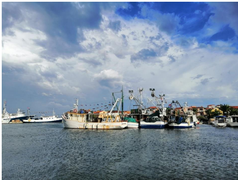
Prilog 3: Brodovi ukrašeni zastavicama fotografirani prije proslave

izgradnju crkve ulagani čak i u razdobljima kada su zadarske župe na kopnu i otocima bile suočene s teškim uvjetima i siromaštvom, što se očituje u oslobađanju od plaćanja crkvene desetine i odlasku svećenika iz nekih otočnih župa. Zbog niskih prihoda i smanjenog broja stanovnika, mnoga su sela teško mogla samostalno uzdržavati svećenika, pa je bilo lakše da ih u tome sudjeluje više (Dundović, 2021:80,85).