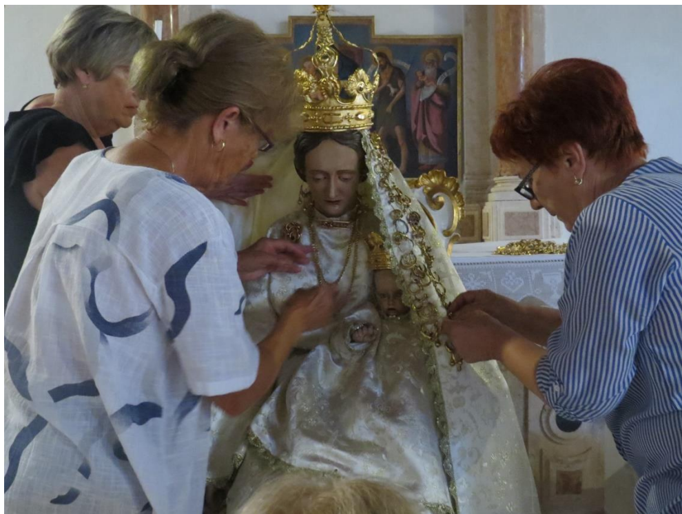
Prilog 30: Ukrašavanje kipa Gospe od Sniga zavjetnim zlatom (autorica)

Nakon što mi je omogućen pristup crkvenom krugu kao društvenom prostoru koji se pokazao vrlo važnim za razumijevanje organizacije i održavanja hodočašća Gospi od Sniga u Kukljici sudjelovala sam u dijelu pripreme za hodočašće, a to je uređenje Gospina kipa 2022. godine, Na jednak način sudjelovanje se nastavilo i u kolovozu 2023. i 2024. godine. Ponovno je to bila skupina koju čine isključivo žene. Iz istraživačke perspektive sudjelovanje u ukrašavanju kipa zavjetnim zlatom i razgovori koji su se pritom vodili bili su ključni trenuci to su bili ključni trenuci u kontekstu povezivanja i stvaranja bliskosti s mještankama. Prijelaz iz situacije promatranja u omogućeno sudjelovanje u ukrašavanju kipa bio je vrlo važan istraživački trenutak koji je pridonio osjećaju prihvaćenosti i zadobivanja povjerenja od skupine mještanki. Navedeni trenutci podsjetili su me na razmišljanja Johna Eadea koji argumentira da dijalogom s drugima istraživač može ući i u proces reflektiranja vlastitog identiteta i tako u određenim situacijama postati više promatrajući sudionik, nego sudjelujući promatrač (Eade, 2024: 19).