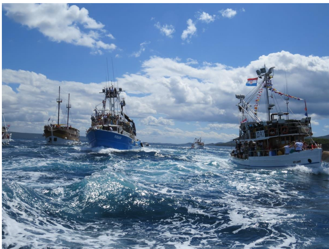
Prilog 12: Vožnja u brodskoj procesiji na povratku u Kukljicu