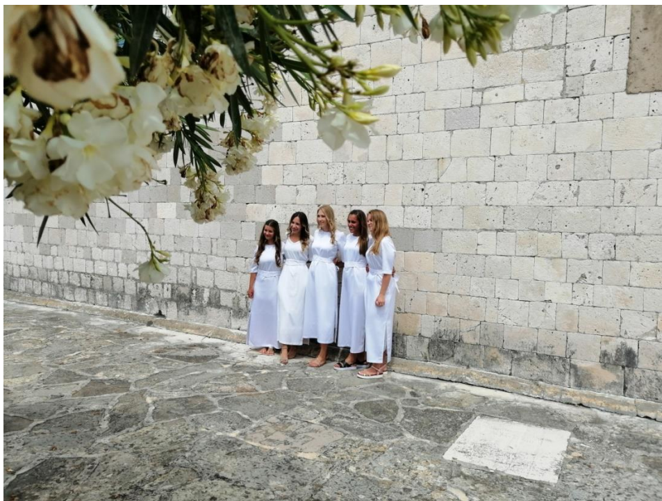
Prilog 29: Djevojke u bijelom kod crkve sv. Pavla u Kukljici 2020. godine (autorica)

No, nositeljice pjevačkog dijela prakse žene su starije životne dobi koje su članice KUD-a Kukljica koji je nekoć bio vrlo aktivno društvo koje danas ima probleme s održavanjem broja članova. Autorica pjesama posvećenih njihovoj zaštitnici, nekoć i prvi glas u tom zboru, i dalje pjeva u toj grupi pjevačica te se još uvijek smatra glavnom, no očito je da zbog fizičkih ograničenja to više ne može biti. U posljednjih nekoliko godina veću ulogu preuzimaju ostale pjevačice u zboru, međutim neminovno se nameće pitanje o tome tko će u mlađoj generaciji preuzeti te uloge i nastaviti pjevačku praksu. Kao i kod prethodnog primjera, tako i u primjeru članica KUD-a, prijenos specifičnih znanja je izazov zbog manjeg broja mladih, ali promjena interesa.