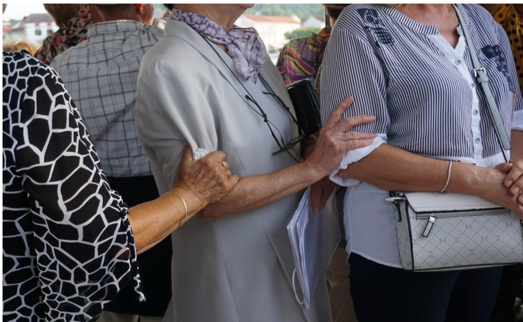
Prilog 11: Žene tijekom povratka brodom u Kukljicu, 2022.