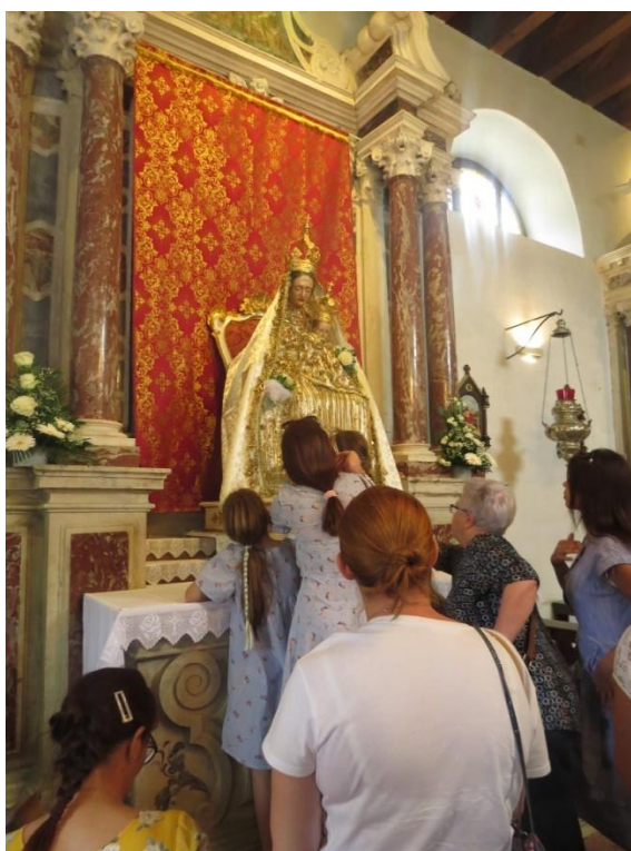
Prilog 14: Unošenje kipa Gospe od Sniga u župnu crkvu sv. Pavla, 2020.