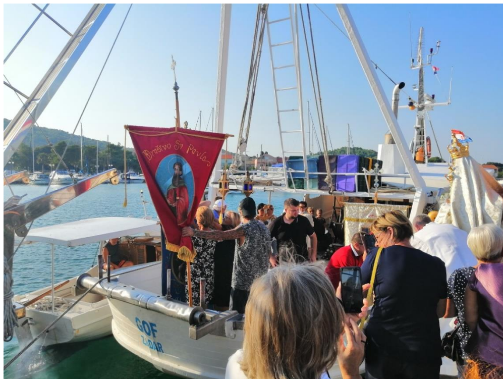
Prilog 7: Prenošenje kipa Gospe u brod „Gof“ 2020.godine