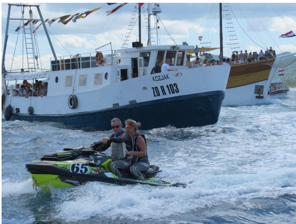
Prilog 13: Vožnja brodom u procesiji