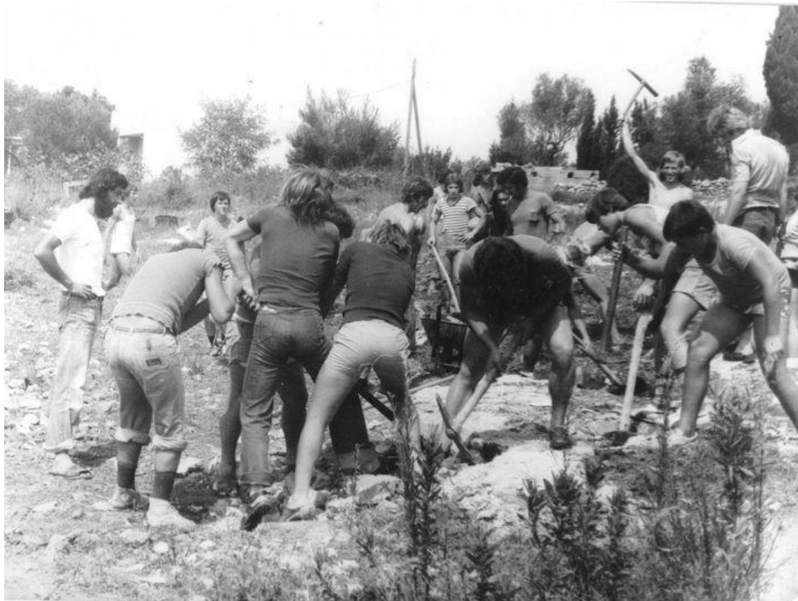
Prilog 22: Jedna od radnih akcija u Kukljici 1976. godine 20

Turizam u Kukljici postaje se intenzivno razvijati kroz djelatnosti turističkog naselja Zelena punta koje je s počelo 1971. godine. U istom razdoblju praksa štovanja Gospe od Sniga vraća se u prvotni ambijent – ponovno se počinje odvijati brodskim putem, ali ne na vesla, nego u motoriziranim brodovima. Raniji oblici turizma u Kukljici počeli su i prije, no sa Zelenom puntom započeo je prvi masivniji i organiziraniji oblik turizma čije je djelovanje utjecalo na širu zajednicu. Zelenu puntu neki mještani nazivaju nekadašnjom „žilom kucavicom“ mjesta te se razdoblje turističkog procvata od 70-ih godina 20. stoljeća pa do Domovinskog rata iz perspektive mještana smatra razdobljem vrlo snažnog razvoja mjesta koje postaje prepoznatljivo na karti Jadrana. Zelena punta imala je kapaciteta za više stotina turista i posjetitelja, u njoj su se organizirali razni zabavni i glazbeni događaji, te je oko 60 mještana bilo u njoj zaposleno. I danas u sjećanjima kazivača ovo se razdoblje ističe kao vrlo perspektivno i povoljno u kontekstu razvoja Kukljice. Osim u ekonomskom smislu, u Kukljici