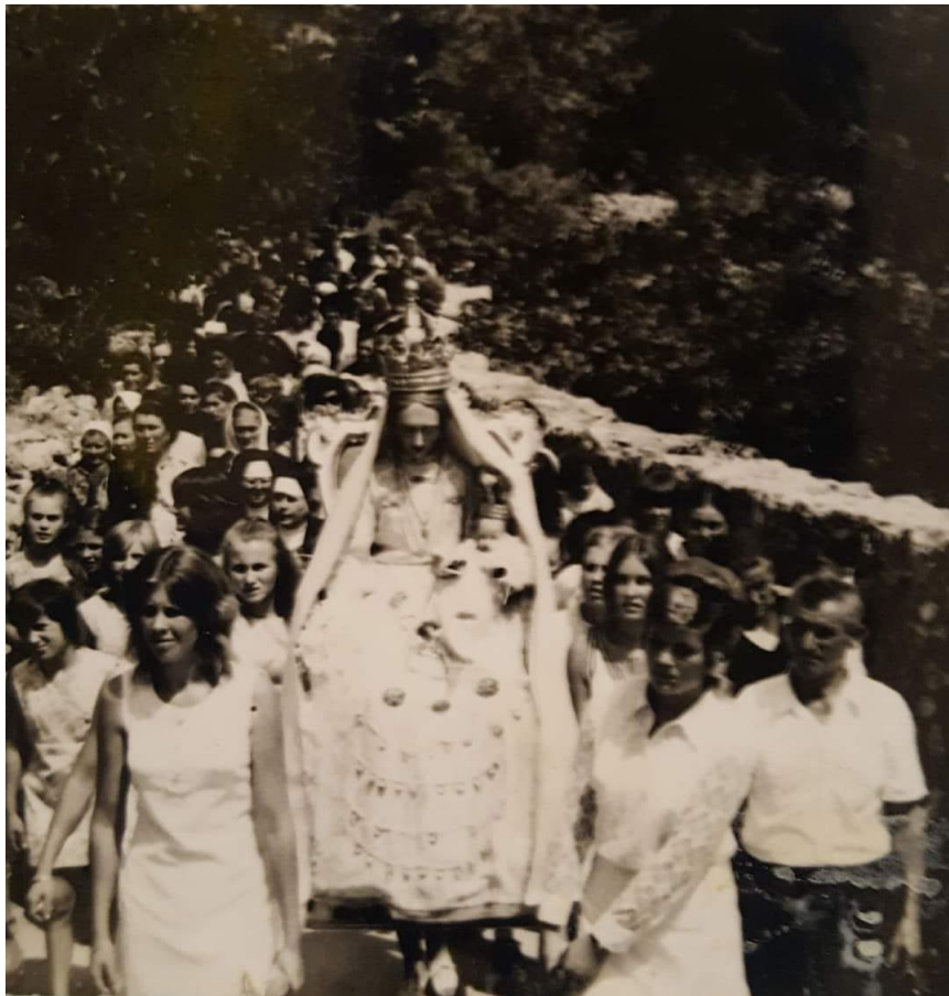
Prilog 19 : Nošenje kipa starim putem 1971. godine 17

Poslije rata, to znate, 48e, 49e., vlast je probala prekinuti tu lijepu tradiciju, lučka kapetanija nije dala dozvolu da se ide po moru, pa se išlo preko kopna. Mislim da su treće godine vlasti ponovno dozvolile da ide kako je išlo po moru (...), ali da vlast je zabranila i danas bi išlo po kopnu, to se ne bi prekinula ta tradicija. To što je u narodu pogotovo tradicija znate to, i vjera. To se ne iskorijeni nikada. To, to, toga nema ko će to iskorijenit. Kada bi zabranili i po kopnu, narod bi našo načina da to prebaci. Znate, to vam je tako.