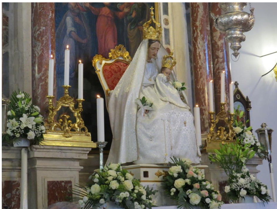
Prilog 28: Kip Gospe od Sniga nakon procesije u župnoj crkvi sv. Pavla, 2023.

naziva ritualna koherencija – riječ je o poretku, u čemu je vrijeme srž stvari. Tako se utvrđuje interni vremenski redosljed pojedinih radnji u čemu se svaka nadovezuje na prethodnu. No, nije samo ponavljanje poanta, nego se uprisutnjuje i nekadašnji važan događaj (predaja o Gospi od Sniga). Ponavljanje i uprisutnjavanje dva su načelno drukčija oblika jednog odnosa, koji označuje sve rituale, čiji je cilj očuvanje (Assman 2005: 19, 20).