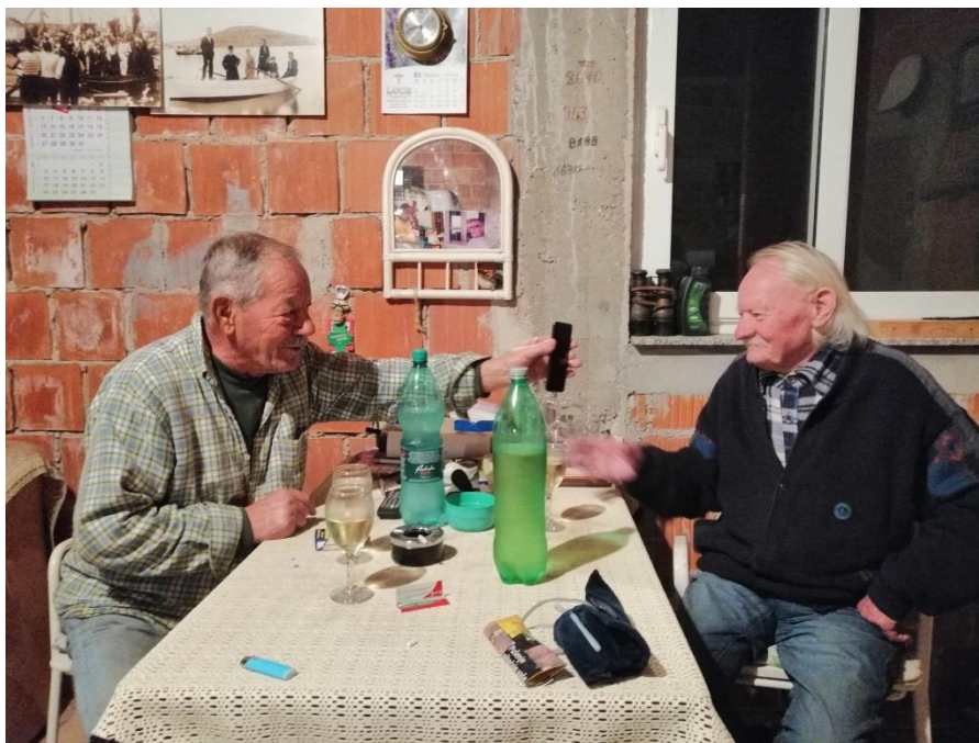
Prilog 17: U druženju sa sugovornicima (autorica)

krucijalne. Atkinson i Hammersley tvrde da dob istraživača u nekim situacijama može biti prednost, jer smatraju da je mlađoj osobi - početniku lakše funkcionirati u marginaliziranoj poziciji outsajdera, ali i prihvatiti ulogu „prihvatljive nekompetencije“ (Lofland, 1971). Takav položaj prema mišljenju autora zapravo je dobar, jer gledanjem, postavljanjem pitanja, pravljem grešaka etnograf može steći dobar uvid u društvenu strukturu okružja u kojem se nalazi i tako razumjeti kulturu istraživanih. Usto, istraživač ne može pobjeći od implikacije roda – od načina na koji rodna pozicija katkad onemogućuje određene aktivnosti i situacije, dok istodobno otvara neke druge (Atkinson i Hammersley 2007: 74,78). Žene u Kukljici čine velik dio aktivnih u kontekstu organizacije i održavanja istraživane prakse. U tom smislu postoje podskupine koje su isključivo ženske (djevojke u bijelom, žene koje ukrašavaju Gospin kip, žene koje pjevaju na brodu), stoga smatram da je moje pripadanje istoj rodnoj kategoriji bila olakšavajuća karika. Muškarci, primjerice, uopće nemaju pristup praksi oblačenja i ukrašavanju kipa, a meni je kao ženskoj osobi ipak bio omogućen pristup.