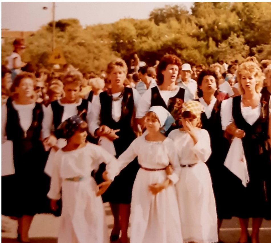
Prilog 26: KUD Kukljica prilikom fešte 23