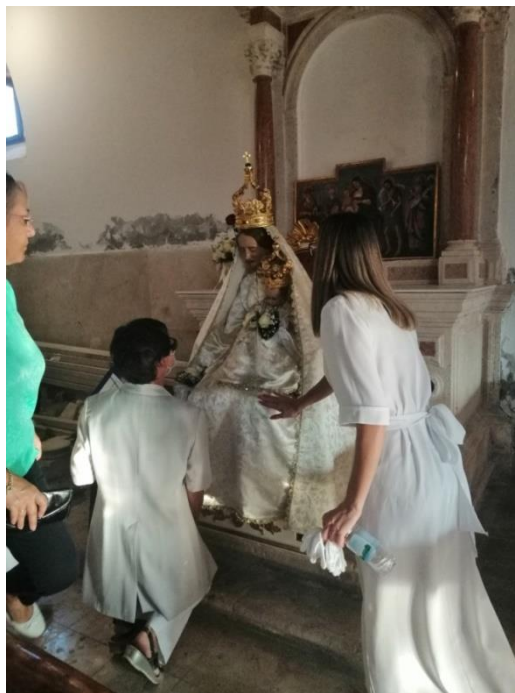
Prilog 31: Trenutak molitve i dodirivanja kipa Gospe od Sniga, 2020. godina (autorica)

Da, baš osjetiš. Da nisam imala i Gospu i Boga i Isusa uza se ne bi pobijedila šta sam pobijedila. Ne bi proživjela ovih 30 godin što sam proživila. Ali zapamti jedno – vjera je vjera.