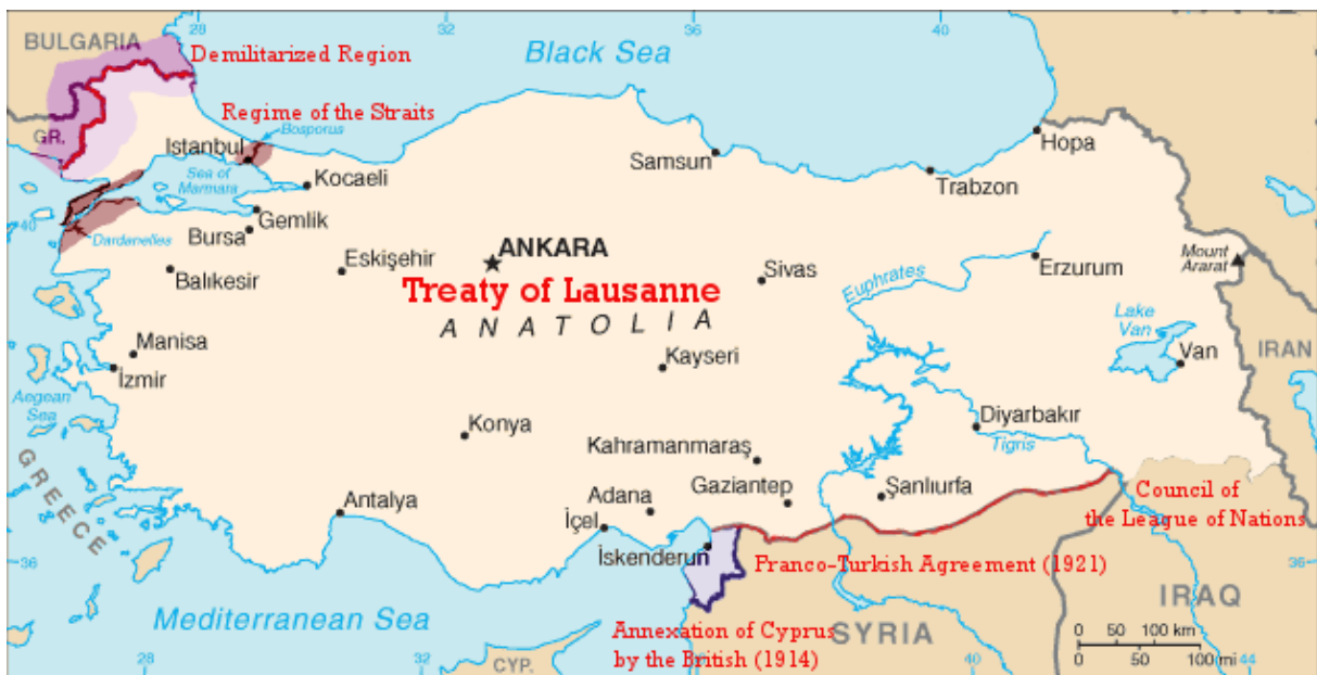
Slika 8. Današnje granice na temelju Ugovora iz Lausanne

Teritorijalni obuhvat Osmanskog Carstva predstavlja prvi dio ugovora i zahvaća 2., 3., 4. i 5. članak te definira granice Turske. Članak 2. određuje granicu s Bugarskom, od ušća rijeke Rezove do rijeke Marice. Tursko-sirijska granica određena je prema tursko-francuskim sporazumom u Ankari 1921. Granica između Turske i Iraka utvrđuje se u prijateljskom aranžmanu koji će biti zaključen između Turske i Velike Britanije u roku od devet mjeseci. U slučaju da se između dviju vlada ne postigne dogovor u navedenom roku, spor će se uputiti Vijeću Lige naroda. Problem Turske i Iraka bio je grad Mosul, a riješen je tek 1925. kada je Liga naroda odredila da Mosul pripada Iraku. Prava se pregovaračka borba vodila oko kontrole nad Bosporom i Dardanelima. Konvencija o tjesnacima trajala je trinaest godina, a zamijenjena je ugovorom u Montreuxu 1936. Na kraju je Turska preuzela kontrolu nad tjesnacima posebnim odredbama reguliranim međunarodnim trgovačkim prometom