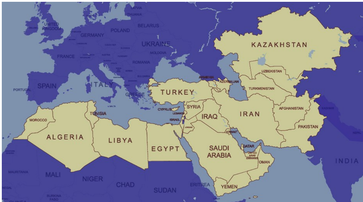
Slika 1. Države Velikog Bliskog istoka