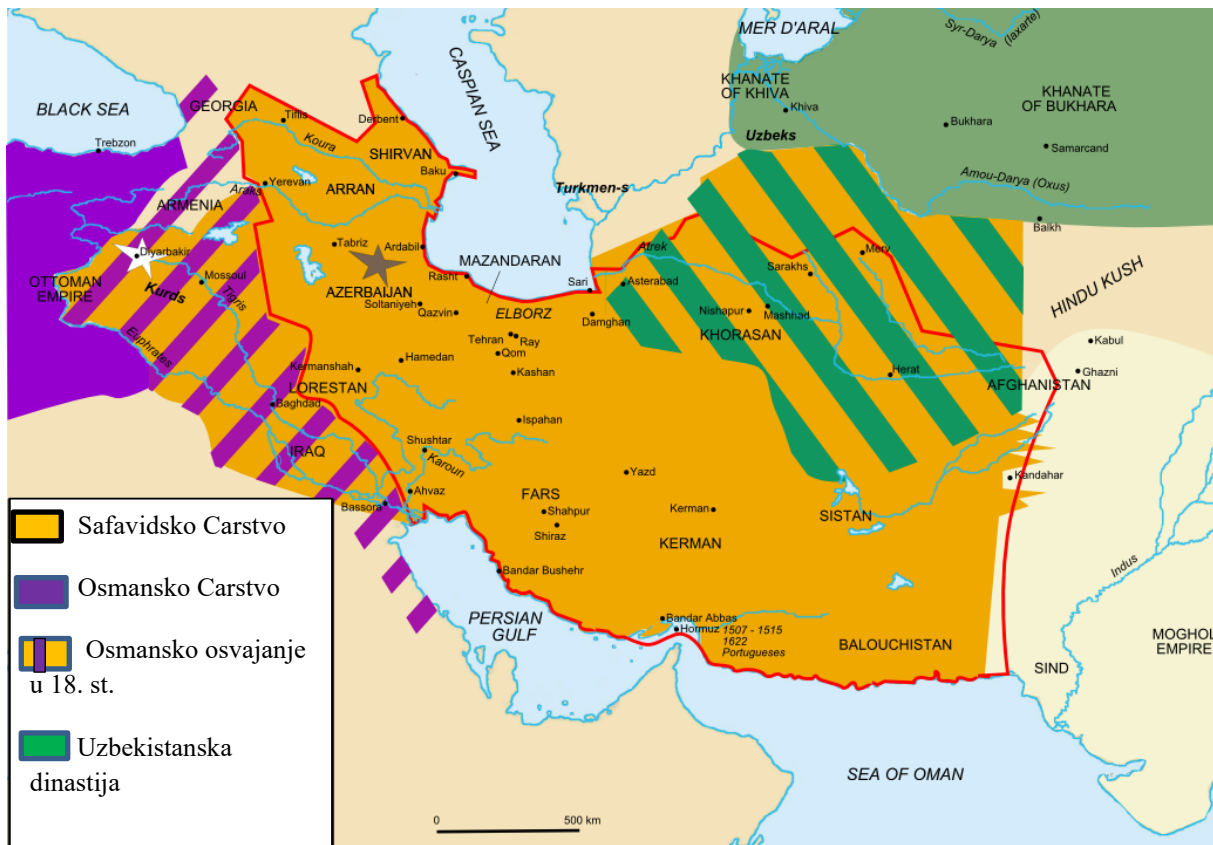
Slika 4. Granica između Osmanskog i Safavidskog Carstva