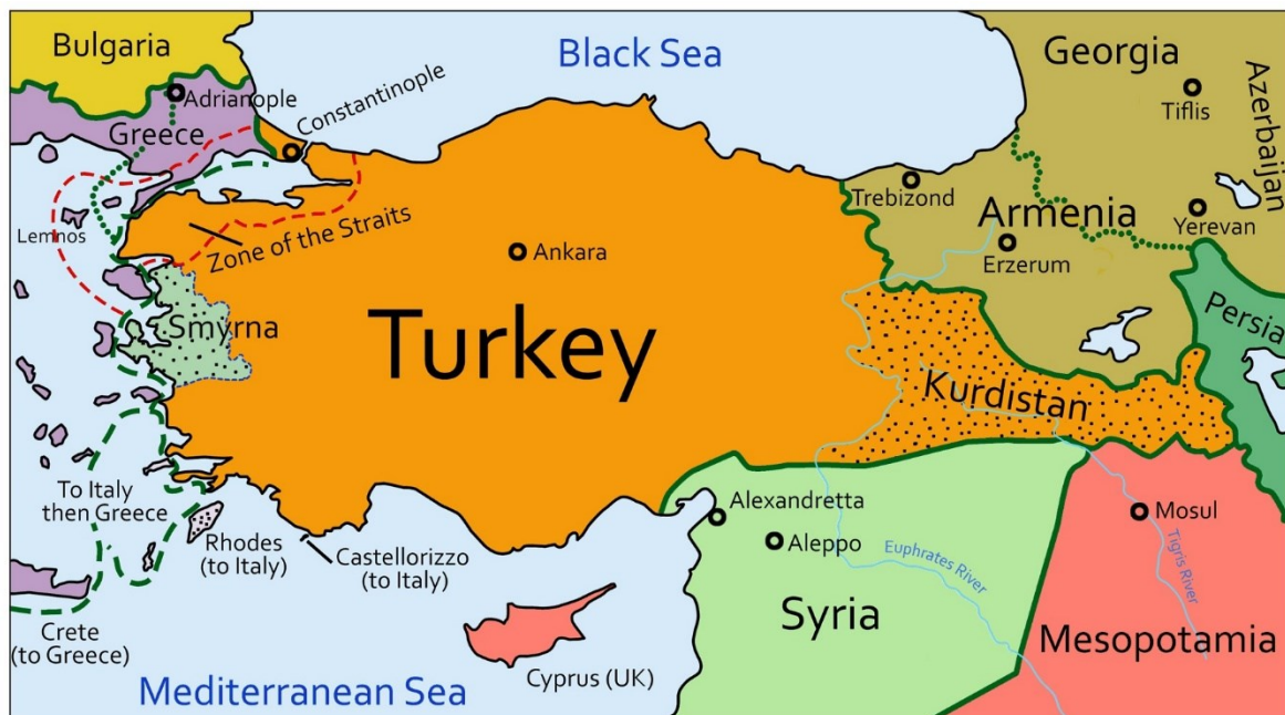
Slika 7. Podjela Osmanskog Carstva iz Sevresa

Prvi svjetski rat dobio je veliku potporu javnosti te euforiju velikih vođa koji su predviđali kratak rat s kojim će doći do svojih ciljeva. Dogodilo se upravo suprotno; četiri godine ratovanja s velikim brojem žrtava, preko 25 milijuna ljudi, te uništenje međunarodnog poretka. Došlo je do slamanja velikog starog sustava u kojem su dominirali Rusko, Austro-Ugarsko i Osmansko Carstvo. Mirovni je ugovor potpisan s Osmanskim Carstvom u Sevresu 1920. godine, a glavno je obilježje ugovora nova podjela Bliskog istoka. Osmansko je Carstvo moralo ograničiti vojsku na 50 700 ljudi, a financije su stavljene pod savezničku birokraciju. Važan dio predstavlja odredba koja se dotiče Kurdistanu. Naime, prema tom ugovoru Kurdistan je trebao dobiti svoju autonomiju (Stevenson, 2014).