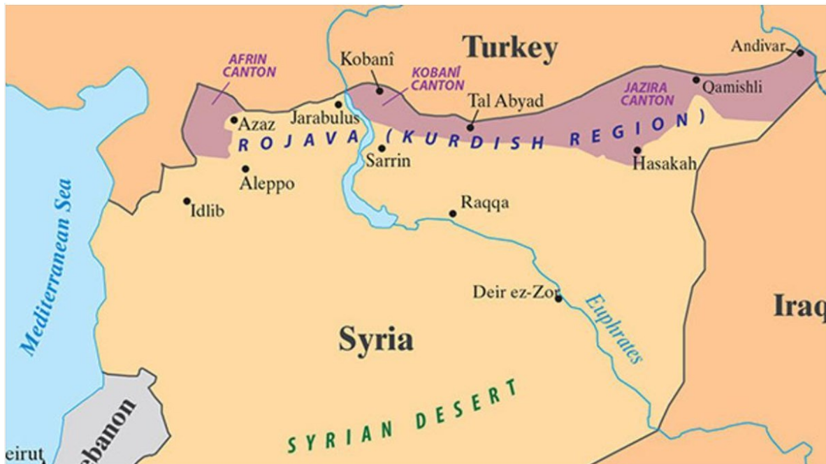
Slika 3. Sirijski Kurdistan