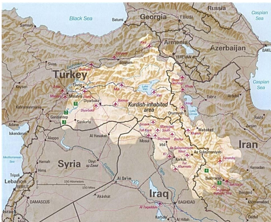
Slika 2. Područja naseljena Kurdima

Fizičko-geografsko područje Kurdistana podijeljeno je u dvije različite regije. Veći dio regije predstavlja planinski dio s prosječnom visinom između 1000 i 1500 metara. Najviši vrhovi prelaze 5000 metara i nalaze se u Turskoj; točnije planina Ararat s visinom od 5156 metara. Za taj prostor karakteristične su zavale i zaravni koje su okružene planinskim masivima, a kao poseban dio izdvajaju se slani jezerski bazeni. Drugi dio regije predstavlja niži reljef kojeg zahvaćaju sirijsko-mosulska Mezopotamija te rijeka Dijala s tokom prema Bagdadu. Prostor koje zahvaća Kurdistan nalazi u sjevernom umjerenom pojasu, točnije između 37° i 48° N. Zbog različitih klimatskih uvjeta gospodarska je aktivnost u promatranom prostoru vezana za periodičnu stočarsku ispašu u planinskim dijelovima te obogaćeno poljoprivrednu aktivnost u nizinskom dijelu (Pavić, 1971).