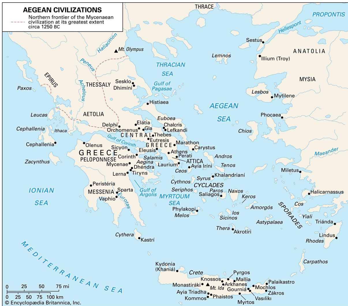
Slika 1. Kartografski prikaz brončanodobne Grčke ( https://cdn.britannica.com/32/1032-050-538DDC72/sites-Aegean-civilizations.jpg 21.1.2024.)

Ono što se danas naziva mikenskim citadelama su bile zapravo palače opasane kiklopskim zidinama, ispod kojih bi se tradicionalno nalazio donji grad u kojem su živjele niže klase. 75 Palače su bile administrativna, kulturna, ekonomska i religijska središta Mikenske kulture. U samim palačama nalazili su se megaroni kao centralne kraljevske prostorije. Dvorske i administrativne uloge bile su podijeljene među ratničkom aristokracijom, ali i među krupnim zemljoposjednicima, koji su činili lokalnu administraciju van prijestolnice, odnosno dvora. 76 Većinu naroda su činile niže klase koje su obavljale niz različitih poslova za palaču,