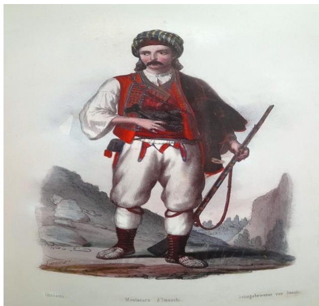
Foto N.1. Imoćanin

I pantaloni di lana, o "gaće", erano chiusi con "sponama" e "ključima". Sulla parte anteriore avevano tasche chiamate "promaje", e si stringevano con una cintura chiamata "svitnjak" o un cinturino. I pantaloni festivi erano realizzati in lana blu o verde. Attorno alle tasche, al taglio della "promaja" e lungo le gambe erano decorati con un nastro di lana rossa ritorta e lana rossa inserita. La cintura era legata con diverse cinture. In occasioni festive, sopra la cintura veniva indossato un "pripašaj" di pelle, in cui si tenevano armi, attrezzi per la pipa e altre necessità. Spesso era decorato con borchie metalliche "pulije". Sulla camicia si indossava un gilet senza maniche, "jačerma", fatto di pregiata lana blu o verde di Venezia. Era decorato con fili di seta ritorti "brusom" o "gajtanom", e sul petto con applicazioni di fili d'oro - frange di seta e "puceti" di filigrana d'argento. Gli uomini a volte indossavano due gilet, "presomitača" e "ječerma", sopra i quali si indossava un cappotto con maniche "kumparan", che di solito veniva portato appeso sulla spalla sinistra. Sulla testa si portava un "crljena kapa", mentre le scarpe erano semplici, indossando calze "čorape" e "opanci". Le armi, che una volta erano