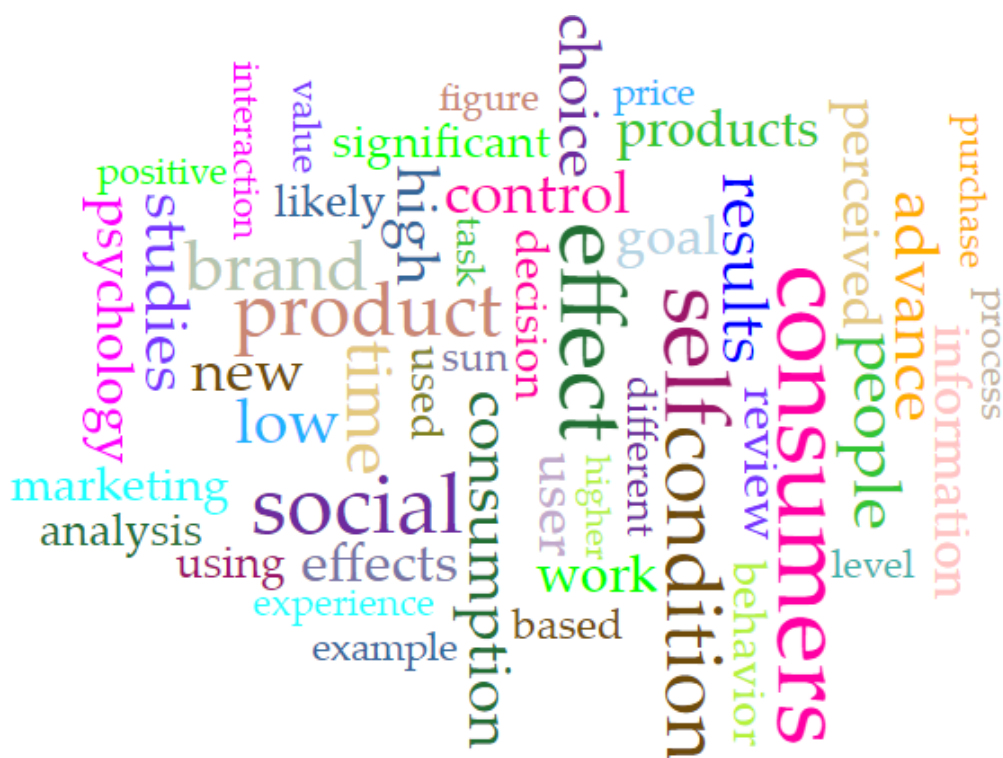
Slika 5. Oblak najfrekventnijih riječi iz korpusa vremenskoga razdoblja od 2015. do 2022. godine

Izvedbom kalkulacije modeliranja tema, dobiveni su sljedeći rezultati: