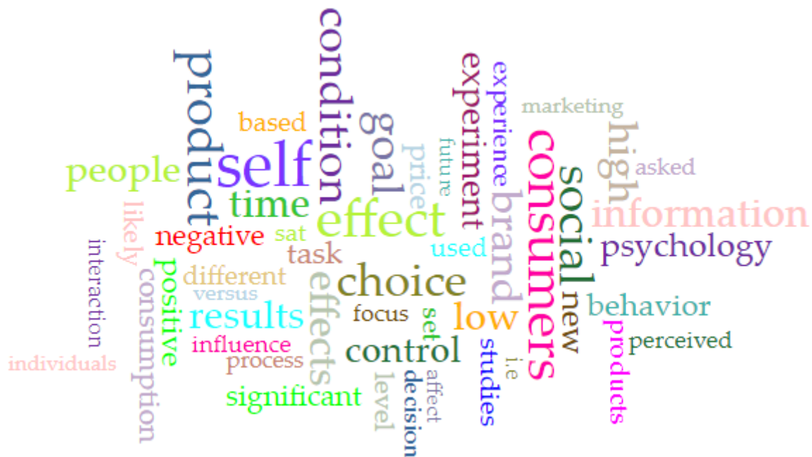
Slika 4. Oblak najfrekventnijih riječi iz korpusa vremenskoga razdoblja od 2005. do 2014. godine

snažno usredotočen na individualne i osobne koncepte, možda baveći se temama poput samopercepcije, samopoimanja ili samoidentiteta. Isto tako, ovaj korpus je veći skoro za 65% od prethodnoga korpusa, što može značiti da je generalna zainteresiranost za istraživanje potrošača povećana.