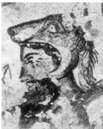
Slika 3. Aita sa vučjom kapom na glavi iz Grobnice Orka II. (N. T. de Grummond, E. Simon, 2006, 71).

u obliku psa, ali se kao vladar podzemlja isključivo prikazuje Aita , dok se Calu spominje u kontekstu mrtvih koji njemu odlaze. 26