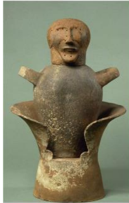
Slika 2. Urna iz 7. st. pr. n. e. s prikazom lica pokojnika iz grada Chiusi.

teritorija razvijaju stav prema smrti i sudbini koji je često pesimističan. U ovom razdoblju se na freskama u grobnicama često pojavljuju Charun i Vanth , etruščanski „demoni“ i psihopompi koji mrtve ispraćaju u zagrobni svijet. 23