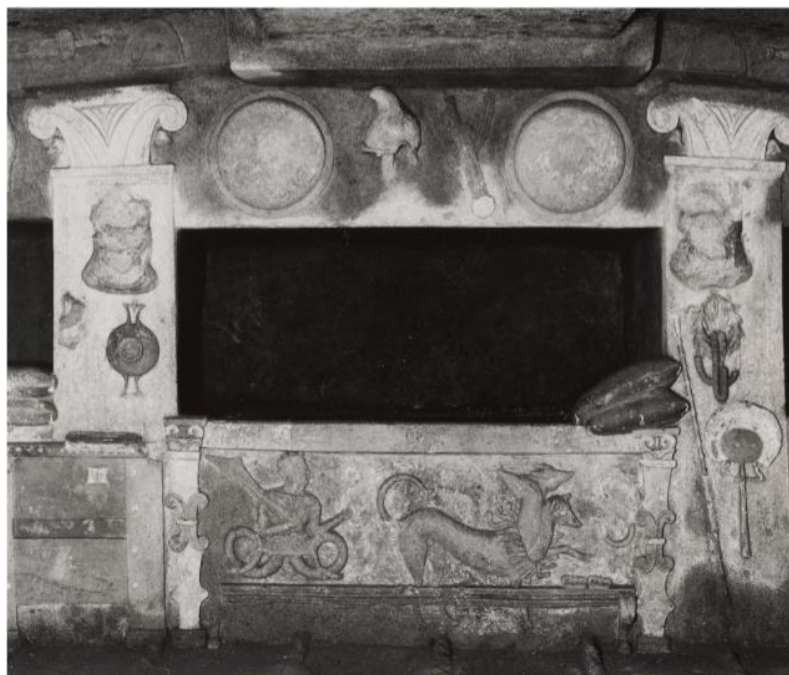
Slika 10. Prikaz Charuna s veslom i zmijskim nogama pored Kerbera u Grobnici Tomba dei rilievi .

Karakteristike etrušanskog Charuna razvijene su na etrušanskom području, a njegovi su atributi tipični za etrušansko poimanje smrti. Dakle, iako se u umjetnosti javljaju grčki motivi, to su pretežito mitološki motivi koji su svoje značenje mogli dobiti i u Etruriji, neovisno o njihovom podrijetlu, to jest, mitovi i religija nekog naroda mogu se razvijati razmjenom različitih simbola i mitoloških motiva koji u konačnici imaju isto značenje. Zbog toga je moguć sinkretizam, jer se ta pojava ne javlja isključivo zbog historijskih procesa između nekih razvijenih naroda, već je moguć upravo zbog percepcije svetog, a određena skupina ljudi će taj mitološki motiv, psihopompa ili božanstvo, prilagoditi svojim potrebama ili ga uklopiti u panteon svojih bogova. 66 Stoga je Charun kod Etrušćana uglavnom prikazan sa svojim tipičnim atributima – prikazan je kao krilati demon razbarušene kose, s kukastim nosom, magarećim ušima i maljem u ruci (Slika 11), a funkciju lađara napušta. Upravo zbog etrušanskog već postojećeg poimanja demona koji mrtve vode (ili pak tjeraju) u zagrobni