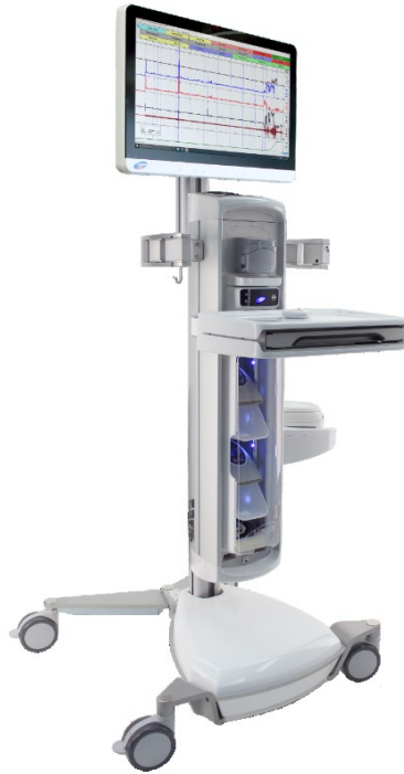
Slika 2. Urodinamski aparat

Dostupno na: https://bioelektronika.hr/laborie/ (7.10.2024.)