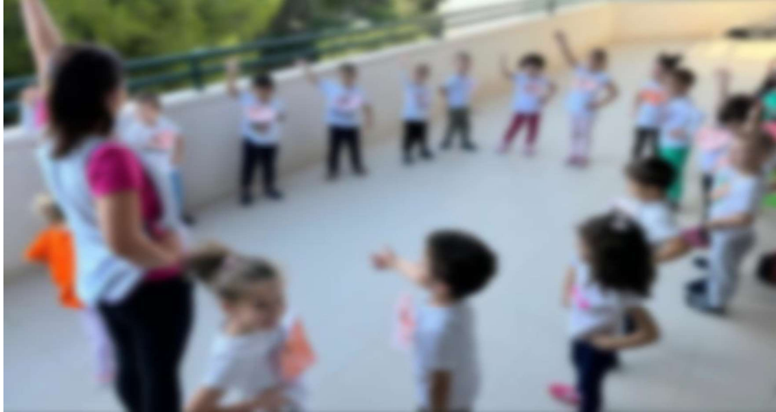
Slika 27. Narodni plesovi u vrtiću – Sv. Mihovil 2