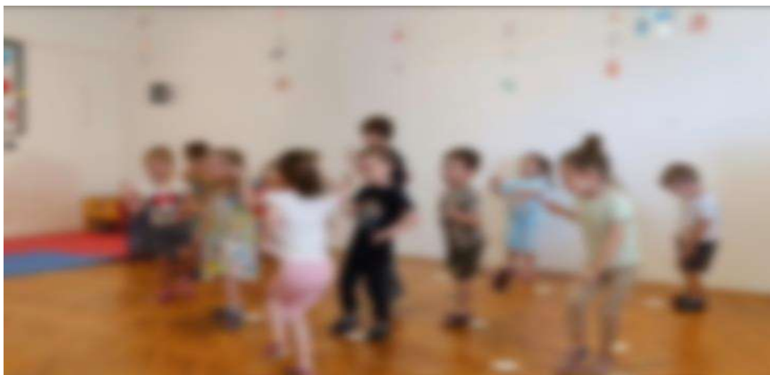
Slika 22. Pokret uz pjesmu Rim Tim Tagi Dim 1