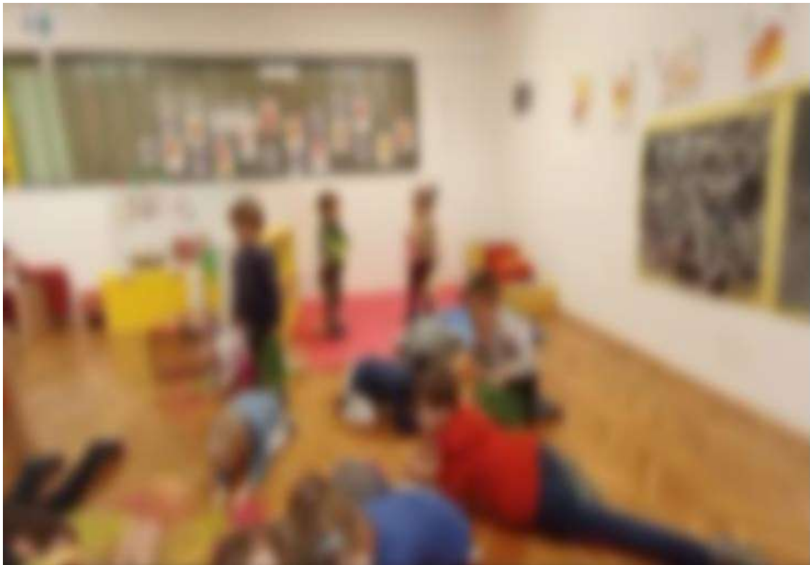
Slika 9. Pokretna igra – valcer cvijeća 2

I sljedeća slika prikazuje pokretnu igru – valcer cvijeća.