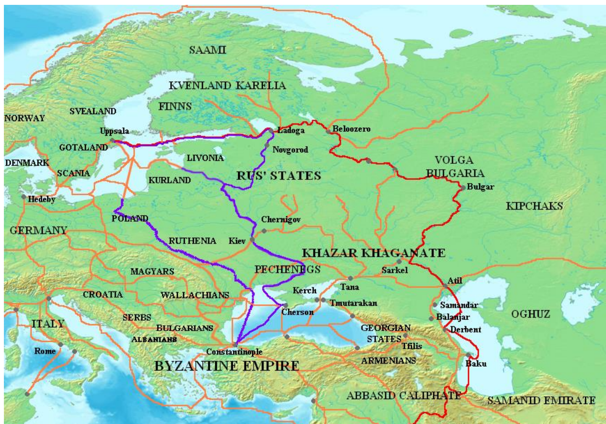
Slika 3: Trgovačke rute Varjaga, crvena boja – trgovačka ruta preko Volge; plava boja – trgovačka ruta s Bizantom; narančasta boja – ostale rute od 8. do 11. stoljeća

Trgovinska prožimanja Bizanta i Kijevske Rus' vidljiva su i u uporabi novca. Nakon pada Zapadnog Rimskog Carstva Slaveni su i dalje koristili rimski novac, koji će se zadržati u upotrebi sve do 10. stoljeća. 59 Sredinom 8. stoljeća u Kijevsku Rus' preko Protobugara dolazi arapski dihram. Razlika između arapskog i rimskog novca bila je njihova veličina, pri čemu je dihram bio veći i tanji, dok je rimski dinar bio manji i deblji. Bizantski novac počeo se koristiti u 9. stoljeću te je ostavio puno veći trag u Kijevskoj Rus' nego arapski dihram. Tijekom 10. stoljeća priljev arapskog novca postaje sve manji iz povjesničarima nepoznatog razloga. To je, između ostaloga, nagnalo kneza Vladimira da počne kovati vlastiti novac na kraju 10. i