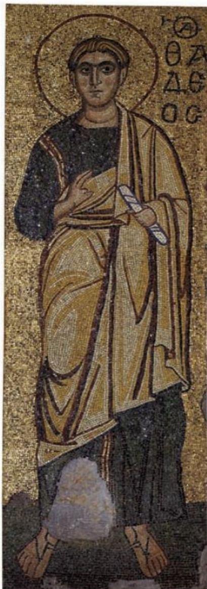
Slika 10: Apostol Tadej, Mozaik iz samostana sv. Mihajla u Kijevu, 12. st., The Glory of Byzantium: Art and Culture of the Middle Byzantine Era A. D. 843–1261 , 1997., str. 290.

ostavila je trajno nasljeđe, prepoznatljivo u bogatom kulturnom životu i arhitekturi Kijevske Rus'.