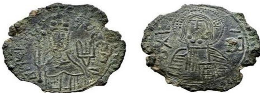
Slika 4: Vladimirov srebrnik, ( https://en.numista.com/catalogue/pieces167123.html , 30.8.2024.)

Dolazak kršćanstva na kijevski prostor utjecao je na proizvodnju i oblik novca. Kršćanski simboli, prije svih križ, postaju standard. Politička situacija u tome je imala važnu ulogu nakon što je Vladimir napao Krim jer mu Bazilije II. nije prema obećanju dao ruku sestre Ane. Vladimir je pri tome napao i grad Korsun, koji je bio važna bizantska kovnica novca te ga je na kraju osvojio. Za Bizant je Korsun bio od velike važnosti jer je broj kovnica s godinama opadao. Bazilije II. u zamjenu za Korsun poslao je brojne svećenike, relikvije i ikone, a pretpostavlja se da je Vladimir sa sobom poveo brojne kovače kako bi uspostavio svoju kovnicu. Dokaz tome jest pojava Vladimirovih zlatnika i srebrnjaka. 64