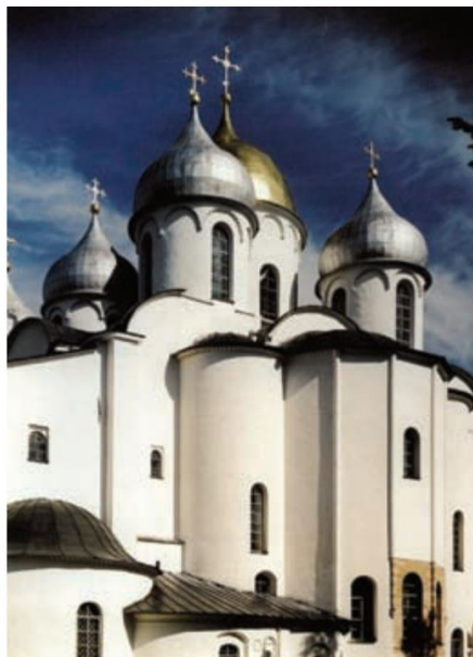
Slika 9: Katedrala sv. Sofije, The Glory of Byzantium: Art and Culture of the Middle Byzantine Era A. D. 843-1261 , 1997., str. 285.

U 11. stoljeću glavni pokretači izgradnji brojnih građevina bili su knezovi i vlastela, dok u 12. stoljeću dolazi do izgradnje manjih crkava bizantskog stila pod pokroviteljstvom trgovaca i bogatih pojedinaca. Kijev je bizantski utjecaj proširio i na druge gradove kao što su Novgorod, Vladimir (grad) i Rostov, koji su tijekom 12. stoljeća bili vrlo razvijeni. Grad Vladimir i njegova regija bili su razvijeni do te mjere da su mogli konkurirati Kijevu, a sredinom 12. stoljeća knez Andrej Bogoliubski pokušao ga je proglasiti glavnim središtem Kijevske Rus'. Jedna od poznatijih građevina izgrađenih za vrijeme Vladimira jest Dimitrijevska katedrala, sagrađena u razdoblju od 1194. do 1197. godine po uzoru na Uspens'kyi katedralu (uništena u Drugom svjetskom ratu), smještena u Kijevu. 92