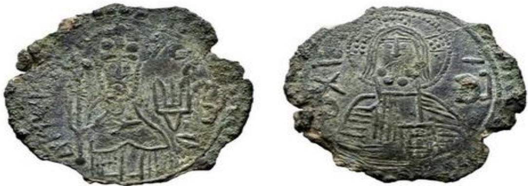
Slika 4: Vladimirov srebrnik

Dolazak kršćanstva na kijevski prostor utjecao je na proizvodnju i oblik novca. Kršćanski simboli, prije svih križ, postaju standard. Politička situacija u tome je imala važnu ulogu nakon što je Vladimir napao Krim jer mu Bazilije II. nije prema obećanju dao ruku sestre Ane. Vladimir je pri tome napao i grad Korsun, koji je bio važna bizantska kovnica novca te ga je na kraju osvojio. Za Bizant je Korsun bio od velike važnosti jer je broj kovnica s godinama opadao. Bazilije II. u zamjenu za Korsun poslao je brojne svećenike, relikvije i ikone, a pretpostavlja se da je Vladimir sa sobom poveo brojne kovače kako bi uspostavio svoju kovnicu. Dokaz tome jest pojava Vladimirovih zlatnika i srebrnjaka. 64