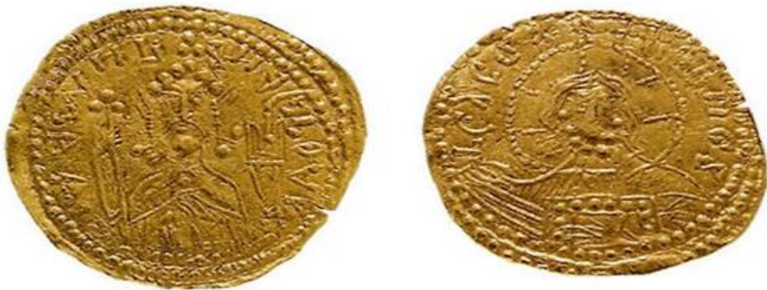
Slika 5: Vladimirov zlatnik

od zlatnika na kojima to nije bio slučaj. Kod Vladimirovog novca na srebrnjacima i zlatnicima može se pronaći portret kneza. Također, na Vladimirovim zlatnicima, i u rjeđim slučajevima na srebrnjacima, mogu se pronaći natpisi poput „Ovo je Vladimirovo zlato“, „Vladimir na prijestolju“ ili „Vladimirovo srebro“. Natpisi na kovanicama svakom novom verzijom postaju sve češći te se može protumačiti da kovanjem novca Vladimir povećava i naglašava svoj položaj i položaj Kijevske Rus' na političkoj karti. 65