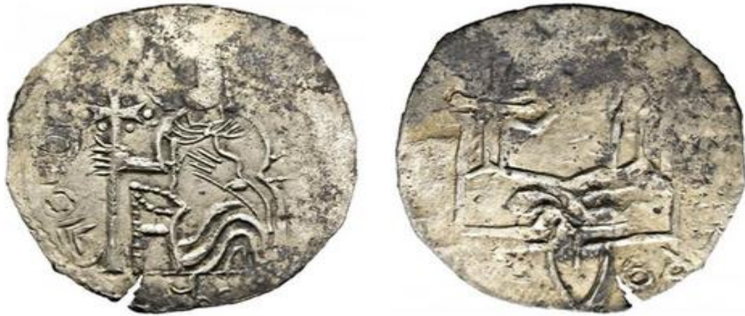
Slika 6: Svjatopolkov srebrenik, ( https://en.numista.com/catalogue/pieces167119.html , 30.8.2024.)

Kijevisko kovanje novca prestaje s Jaroslavom. Jedno kratko vrijeme knez Oleg Svjatoslavič kovao je svoj novac s likom sv. Mihaela. Kovanje novca, kao glavnog sredstva plaćanja na kijeviskom prostoru, međutim, nije ispunilo svoju svrhu. Naime, Jaroslav je zaustavio kovanje novca jer je vidio kako ono nije moglo zamijeniti strane valute kao što su denier ili dirham. 67