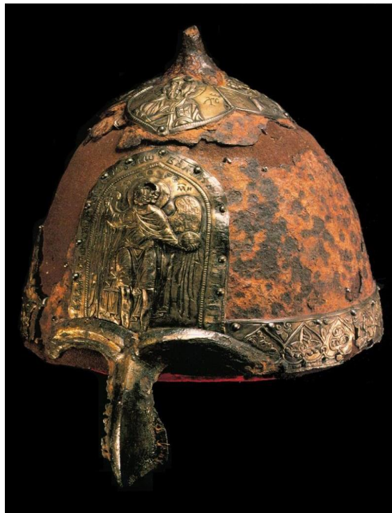
Slika 7: Vojna kaciga Jaroslava II Vsevolodoviča u muzeju moskovskog Kremlja

se koristili u izradi od drvenih štitova, pa sve do brodova. 51 Evolucija rus'kog oružja pod utjecajem Bizanta prati se pred sam kraj 10. stoljeća, kada rus'ko naoružanje postaje naprednije. Tada se rus'ko oružje sastojalo od srebrnih ili u rijetkim slučajevima zlatnih kaciga, srebrnih oklopa, željeznih kopalja i sablji. Konjica je također evoluirala pod utjecajem stepskih naroda i Bizanta koji su bili opremljeni teškim oklopom i velikim kopljima, a također su počeli koristiti i taktike kojima se služila bizantska elitna konjica. Glavni utjecaj Kazara i Madžara u konjici može se vidjeti u njihovoj upotrebi luka i strijele na konjima što je iziskivalo veliki napor i sposobnost. 52