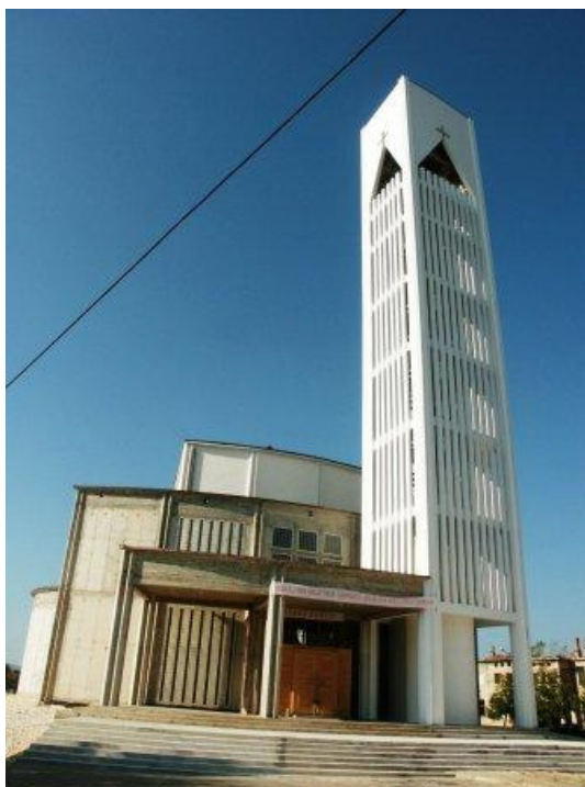
Slika 3. Nova župna crkva sv. Nikole u Kistanjama 53