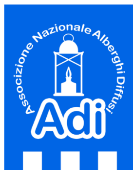
Slika 6: Logo Nacionalnog udruženja difuznih hotela, Italija