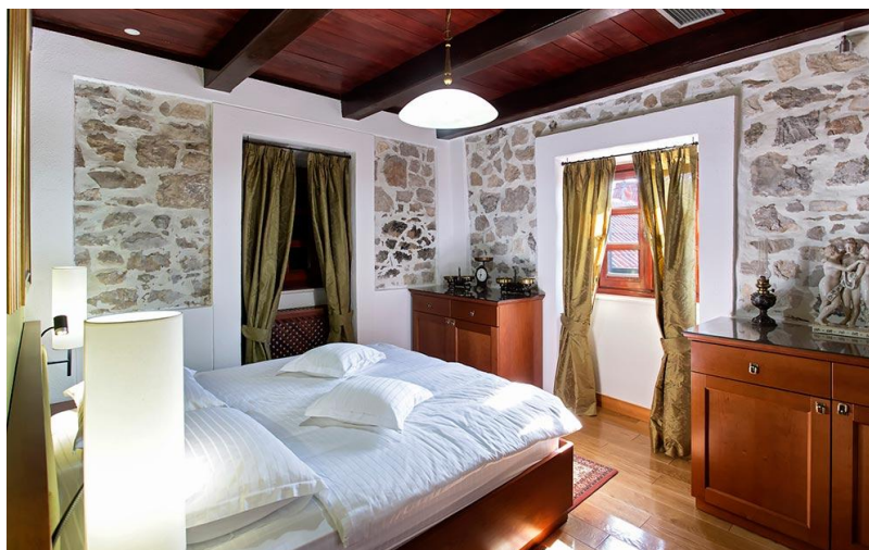
Slika 7: Spavaća soba difuznog hotela Ražnjevića dvori