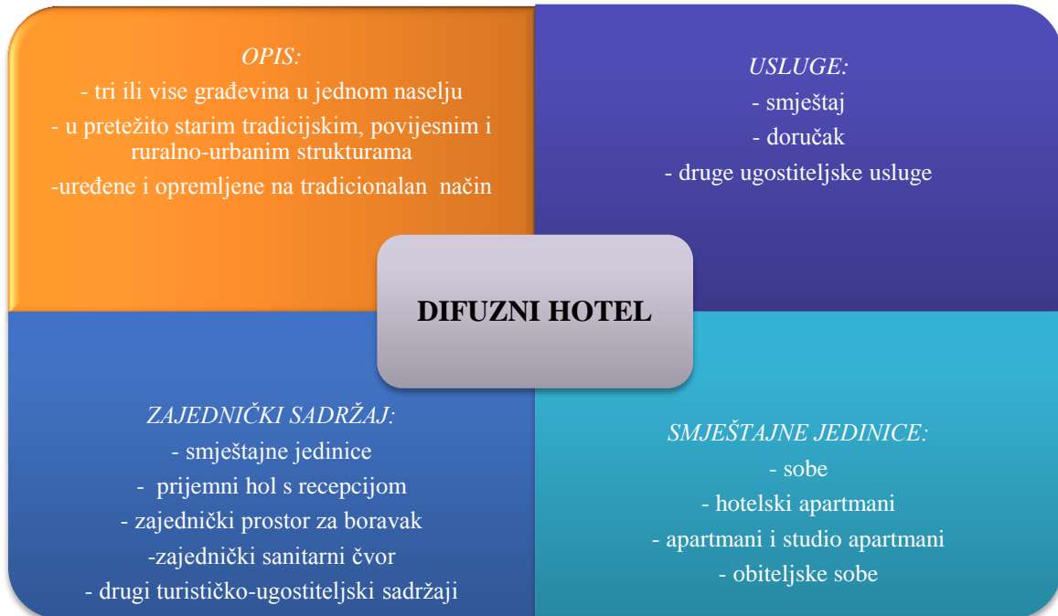
Grafikon 1: Organizacija difuznih hotela u Hrvatskoj