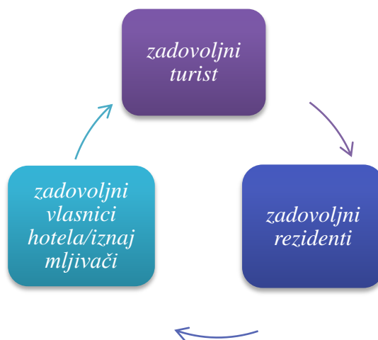
Slika 3: Krug aktivnih sudionika u modelu difuznog hotela