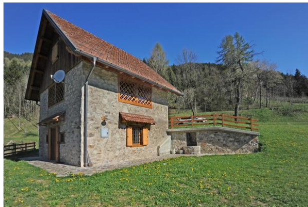
Slika 5: Jedna od smještajnih jedinica difuznog hotela "Comeglians"