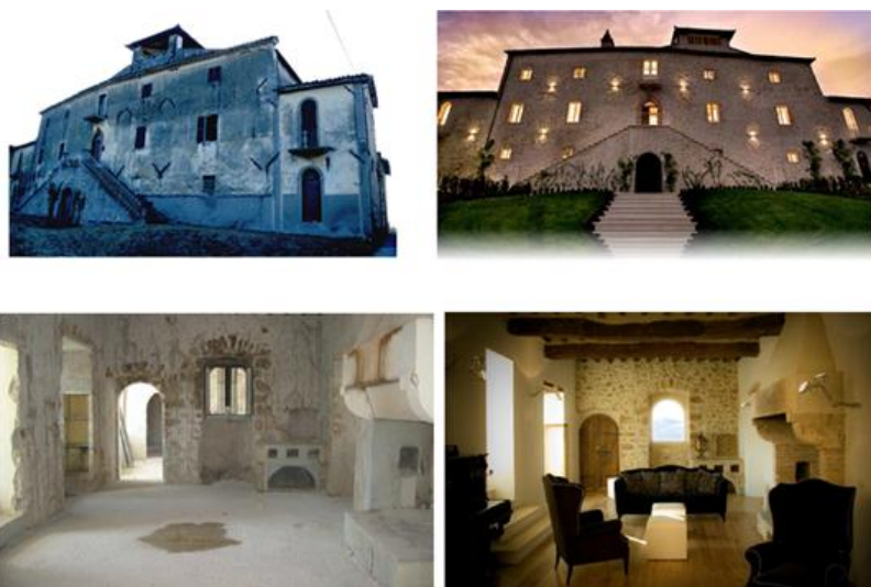
Slika 4: Primjer obnove i stavljanja difuznog hotela u funkciju, Castello di Montignano Relais & Spa

Izvor: http://veilletourisme.ca/2012/01/12/albergo-diffuso-pour-developper-loffre-dhebergement-autrement/ ,