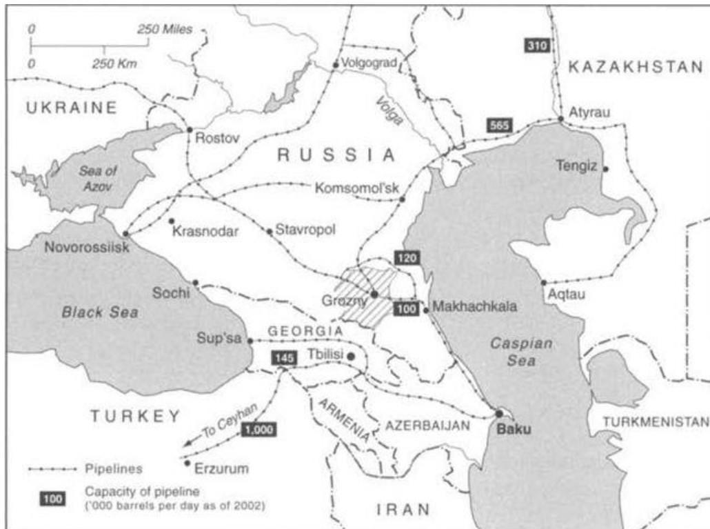
Slika 1 Naftovodi u Čečeniji 20

iziskuje snagu napadačima, dok obrambene nacije i države prilikom gubitaka, ne klone već idu stepenicu više i jače su obrane kako bi se stekli uvjeti za protuofenzivu. Ruska politika je smatrala Čečene teroristima, ali i separatistima. 19 Ruska politika je pokušala svijetu „objasniti“ da Čečeni nisu imali pravo na samoodređenje jer su kulturološki i povijesno uvijek uz Rusiju. Unatoč toj teoriji, ona nije dokazana da je zapravo kružila među političkom elitom tog vremena. Ovdje se samo može govoriti o militarizaciji dijela Rusije koji je pokušao steći vojnim aktom neovisnost.