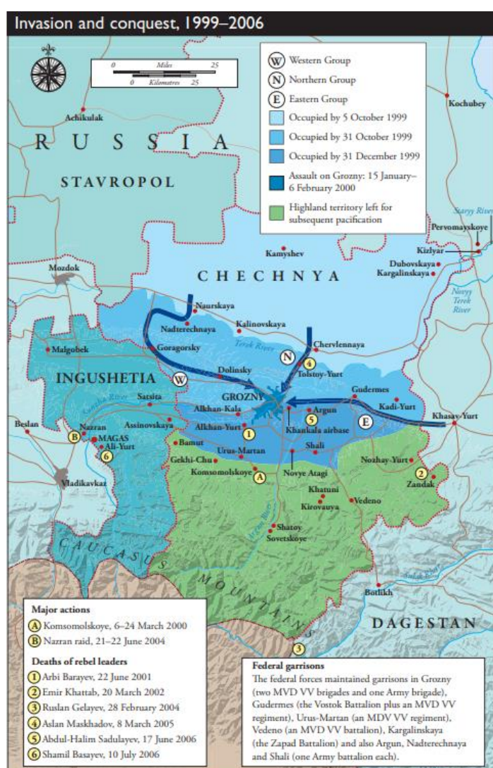
Slika 5 Invazija i osvajanje Čeče nije 1999. - 2006. 48