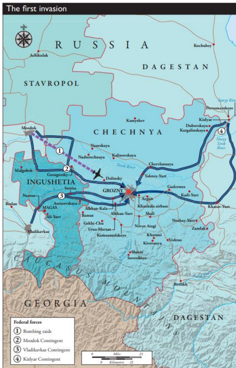
Slika 2 Prva invazija na Čečeniju 24

U rano jutro 11. 12. 1994. godine kreće ruska invazija na Čečeniju. To označava sami početak Prvog rusko – čečenskog rata. Ruski smjerovi napada bili su iz četiri pravca od čega prvi pravac je išao zračnim putem kako bi se uništili aerodromi za sprječavanje uzleta aviona čečenskih obrambenih snaga. Nadalje, Rusiji je pomagao general Vladimir Čilindin koji je dolazio iz pravca Južne Osetije. Sve su snage došle ka konačnom cilju, a to je Grozni, međutim tamo nisu dočekani cvijećem i pjesmom, već bombama i vojno – spremnim narodom. Rat tek onda počinje.