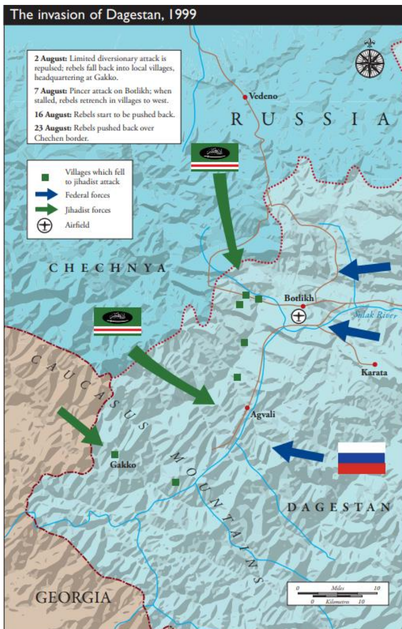
Slika 4 Napad na Dagestan 1999. godine 45

Podjela na prvi i drugi Čečenski rat je zapravo gruba podjela. Naime, iako je potpisano primirje 1996. godine, rat nikada nije prestao u velikoj mjeri, lokalni sukobi su bili, ali bilo je upravo i jedan period gdje je napade preuzimala džihadistička grupa Čečena. To se očitovalo na područjima Dagestana, regije Ingušetija i Stavropola. 44