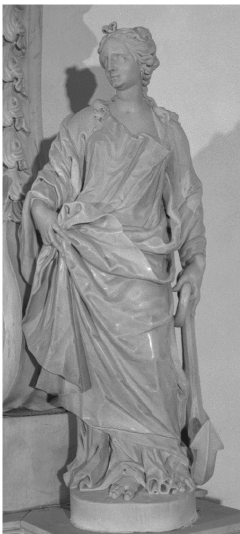
sl. 6. A. Tagliapietra, skulptura Nade, krstionica katedralne u Chioggi, 1708. god.