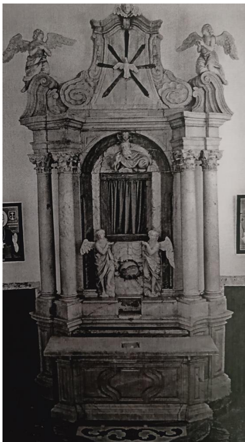
sl. 8. oltar u ž. c. u Rodaljicama, nekoć Bezgrešnog Začeca, prenesen iz katedrale 1953. god.