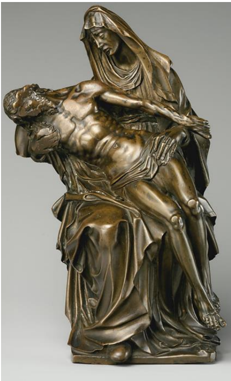
sl. 3. Hubert Gerhart, Pietà, nakon 1595. god.