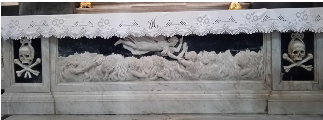
sl. 5. antependij oltara Duša u Čistilištu u Zadru, Pietro Onigha, 1805. god.