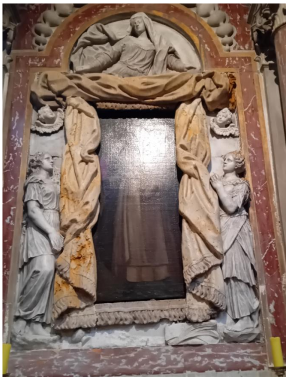
sl. 7. Toretijevi reljefi na oltaru sv. Dominika, 17.st