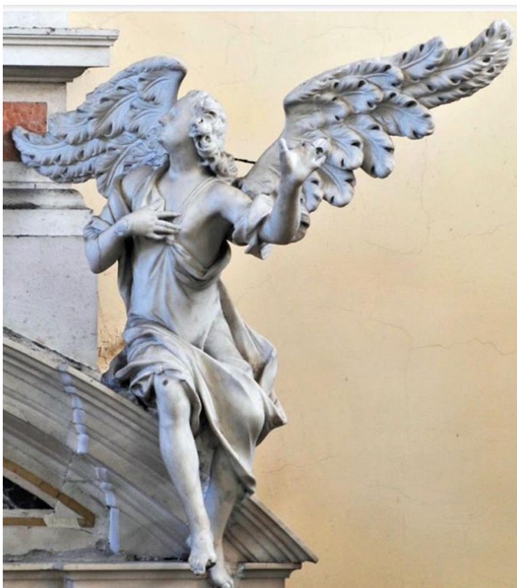
sl. 10. anđeo sa starog Priuijevog oltara, lokacija: župna crkva, Arbanasi