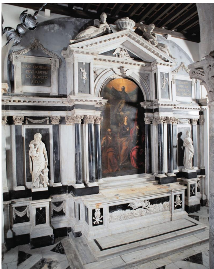
sl. 4. oltar Duša u Čistilištu, zadarska katedrala, Pietro Onigha, 1805. god.