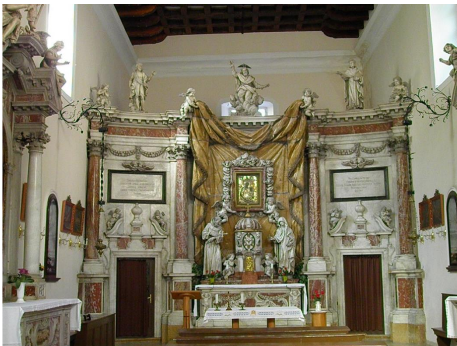
sl. 2 . oltar u Sv. Klare, Kotor, F. Cabianna, 1708. god.