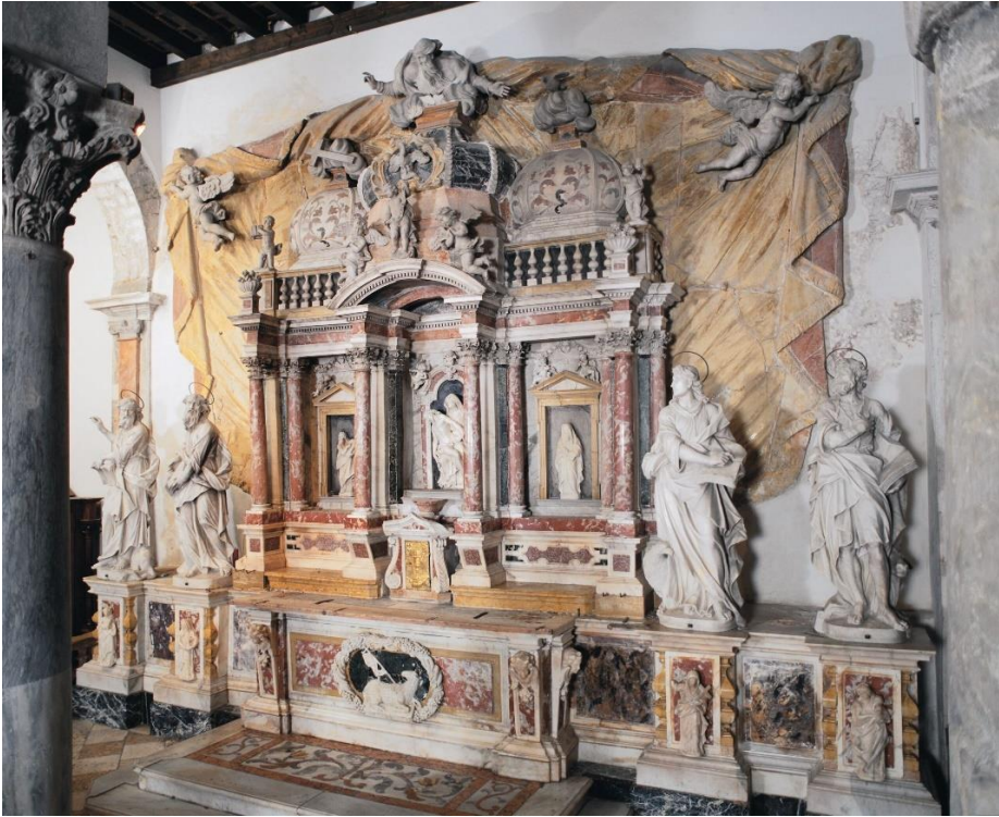
sl. 1. oltar Presvetog Sakramenta, zadarska katedrala, Antonio Viviani, 1719. god.