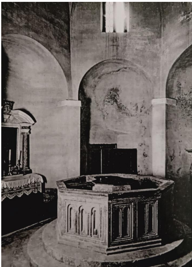
sl. 9. unutrašnjost izvorne krstionice