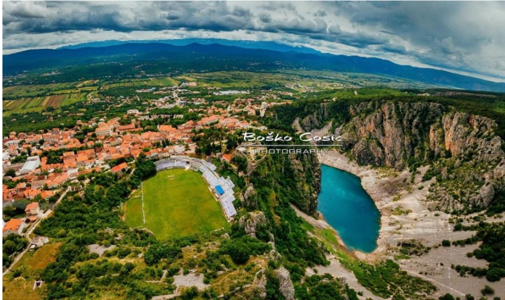
Slika 1.: grad Imotski

da čujem one stare basne, da mlijeko plave bajke sasnem; da više ne znam sebe sama, ni dima bola u maglama.“ (Ujević, 2008: 67)