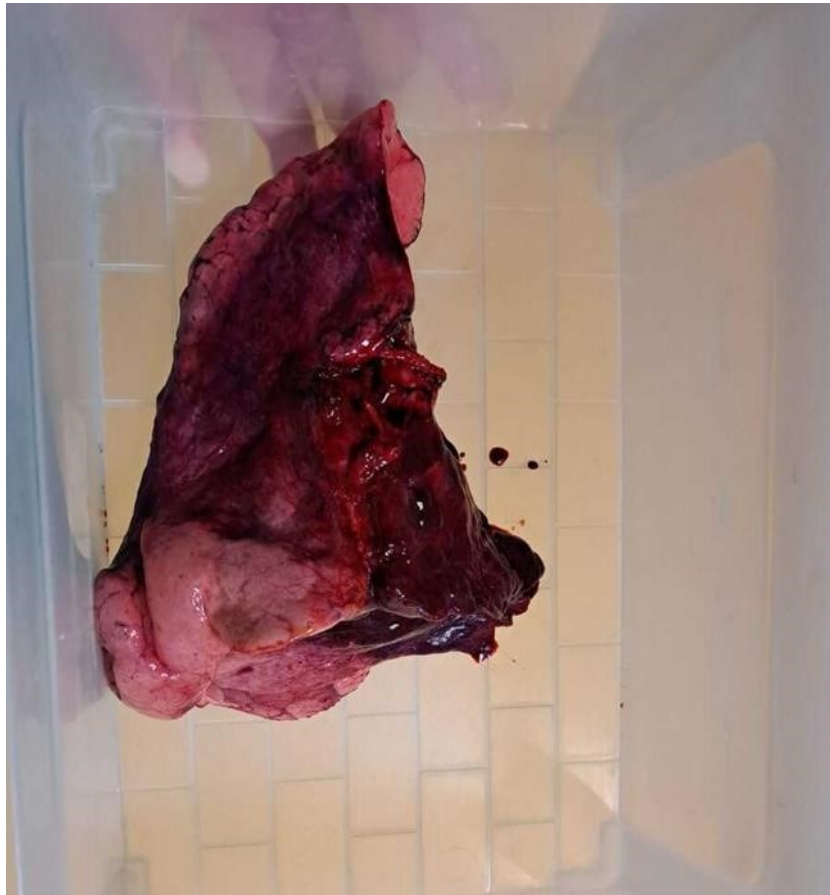
Slika 7. Resecirani dio pluća nakon VATS procedure