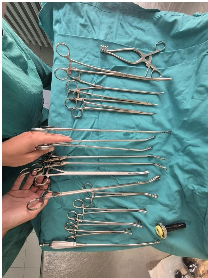
Slika 3. Instrumentarij za VATS

Prvi korak u pripremi operacijske dvorane je ispitivanje sterilnosti setova koji će se koristiti tijekom zahvata. Svi kirurški instrumenti i materijali moraju proći kroz stroge sterilizacijske procese, a potom biti pohranjeni u sterilnim uvjetima sve do trenutka upotrebe.