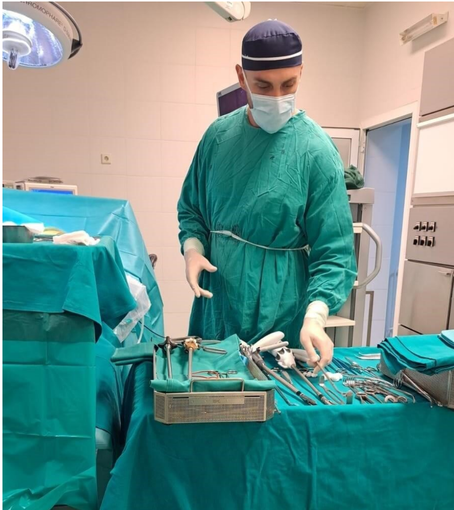
Slika 2. Medicinski tehničar pregledava instrumentarij uoči zahvata