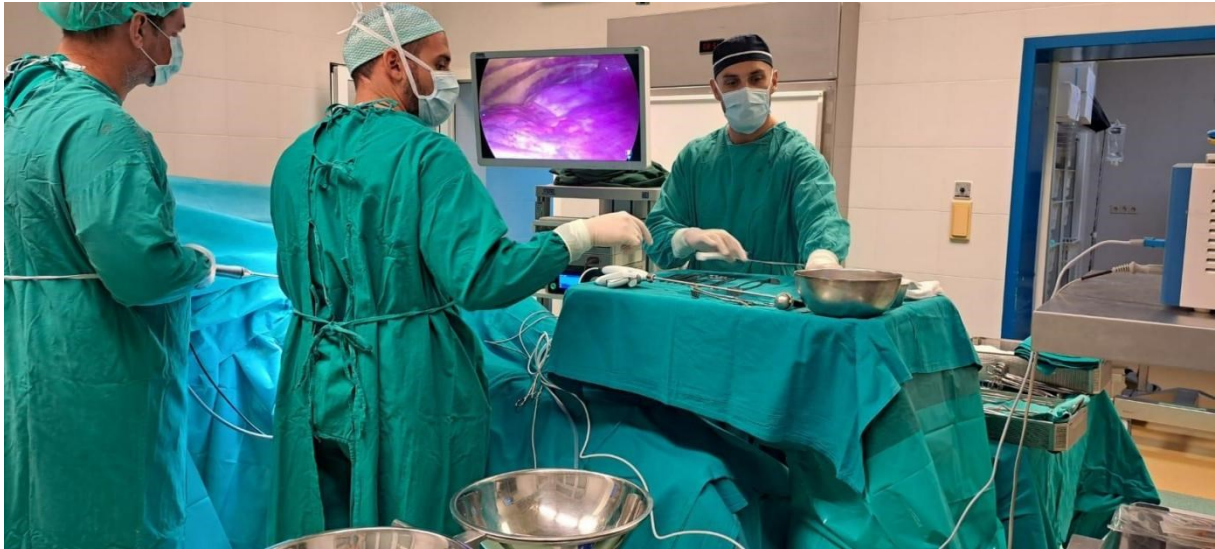
Slika 6. Položaj instrumentara, operatera i asistenta u odnosu na operacijsko polje i videostup