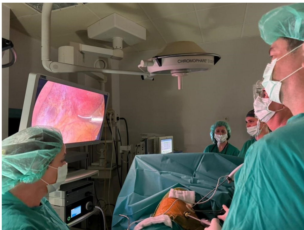
Slika 5. Standardni namještaj operatera, instrumentarke i videostupa pri VATS-u