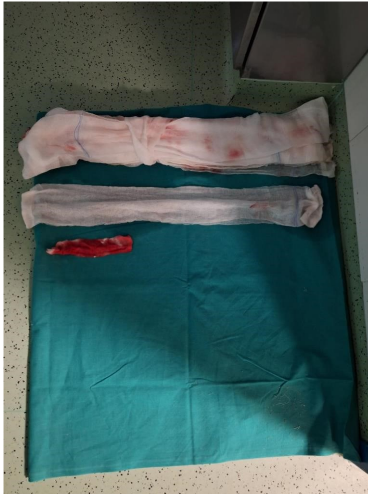
Slika 8. Provjera i brojanje gaza te zavojnog materijala nakon VATS procedure