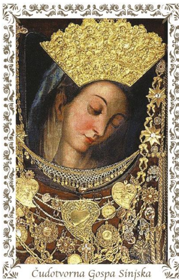
Slika 2 Slika Čudotvorne Gospe Sinjske

Svake se godine 15. kolovoza slavi blagdan Velike Gospe uz misu i procesiju kada dolaze ljudi iz svih krajeva Lijepa naše. Posebno je značajno da se narativ o tom čudesnom događaju prenosi u obliku legende te se uvrštava u usmenoknjiževne oblike.