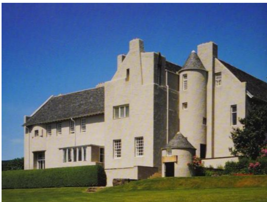
Slika 4. Charles R. Mackintosh, Kuća Hill House, Helensburgh, Škotska, 1902.