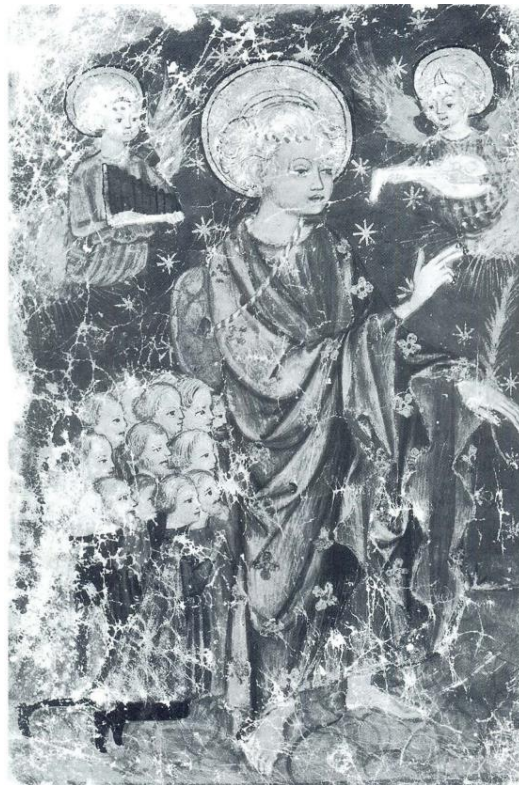
Slika 12. Anonimni majstor, Sv. Staš i bratimi , Matrikula bratovštine sv. Staša, Nadbiskupski arhiv, Split, 1442.