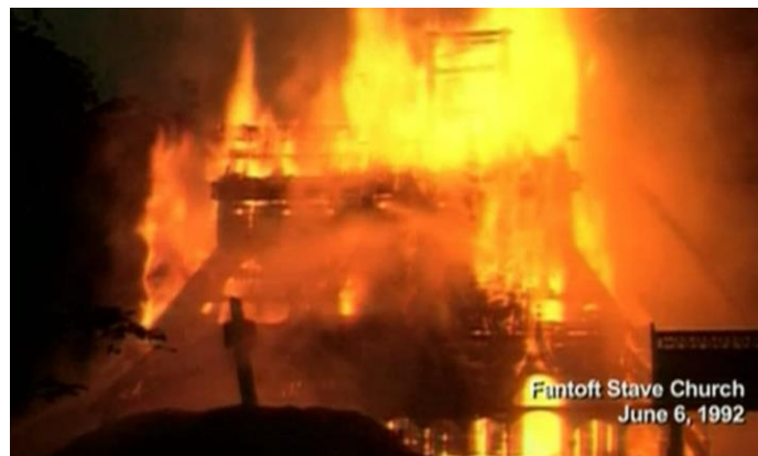
Slika 15. Prikaz gorenja crkve Fantoft u Bergenu (Preuzeto 10.8.2024. sa https://stainedglassattitudes.wordpress.com/2018/01/13/black-metal-church-burnings-a-historical-view/ )