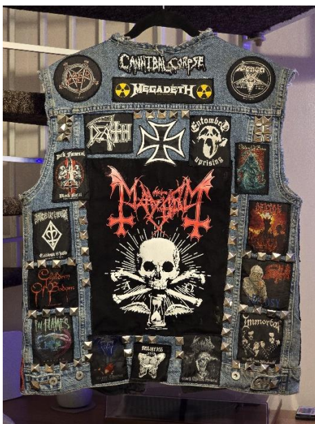
Slika 3. Traper prsluk s prišivcima