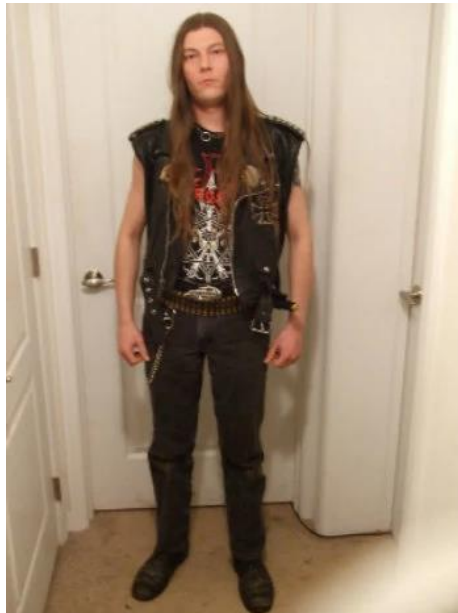
Slika 2. Prikaz „klasičnog“ metalca