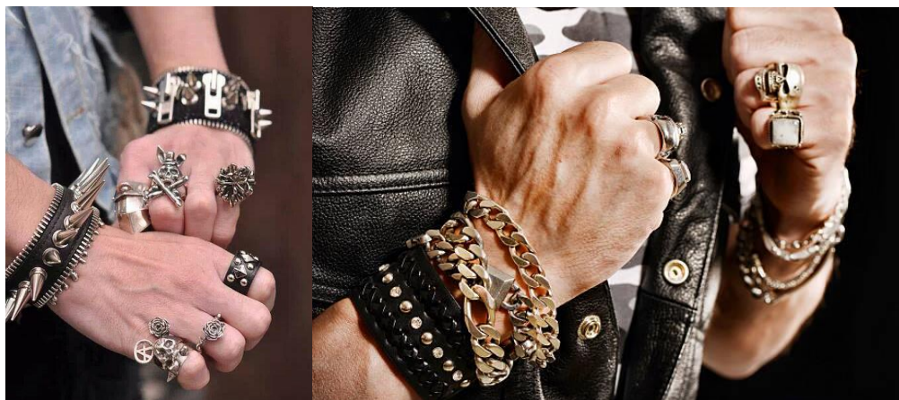
Slika 4. i Slika 5. Primjer nakita