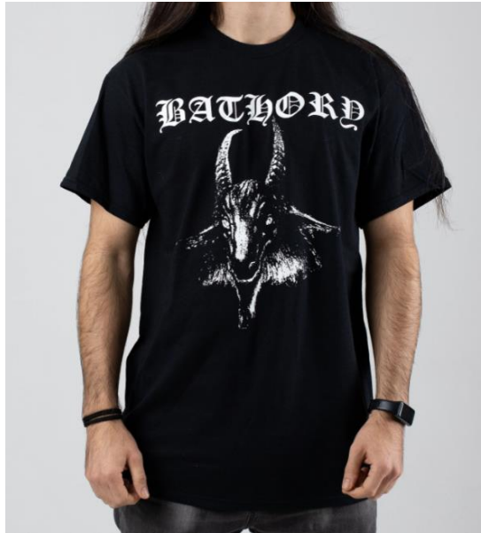
Slika 10. Majica s logotipom benda Bathory- Bafomet (Preuzeto 29.7.2024. sa https://www.impericon.com/products/bathory-goat-t-shirt )