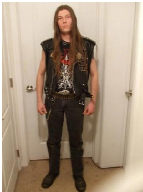
Slika 2. Prikaz „klasičnog“ metalca