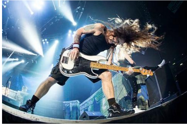
Slika 7. „Headbanging“ - Steve Harris (Iron Maiden)