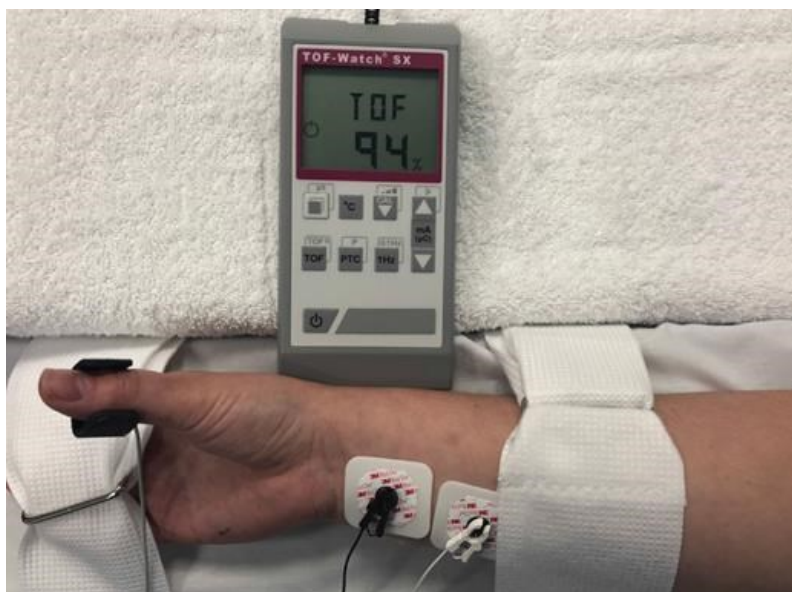
Slika 2. TOF sat