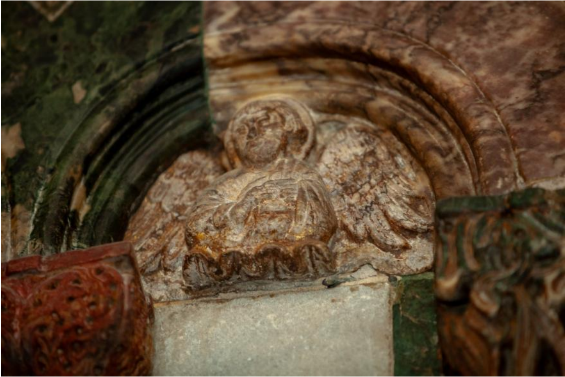
Slika 23. Poprsje evanđelista Mateja u lunetici propovjedaonice katedrale Sv. Dujma u Splitu