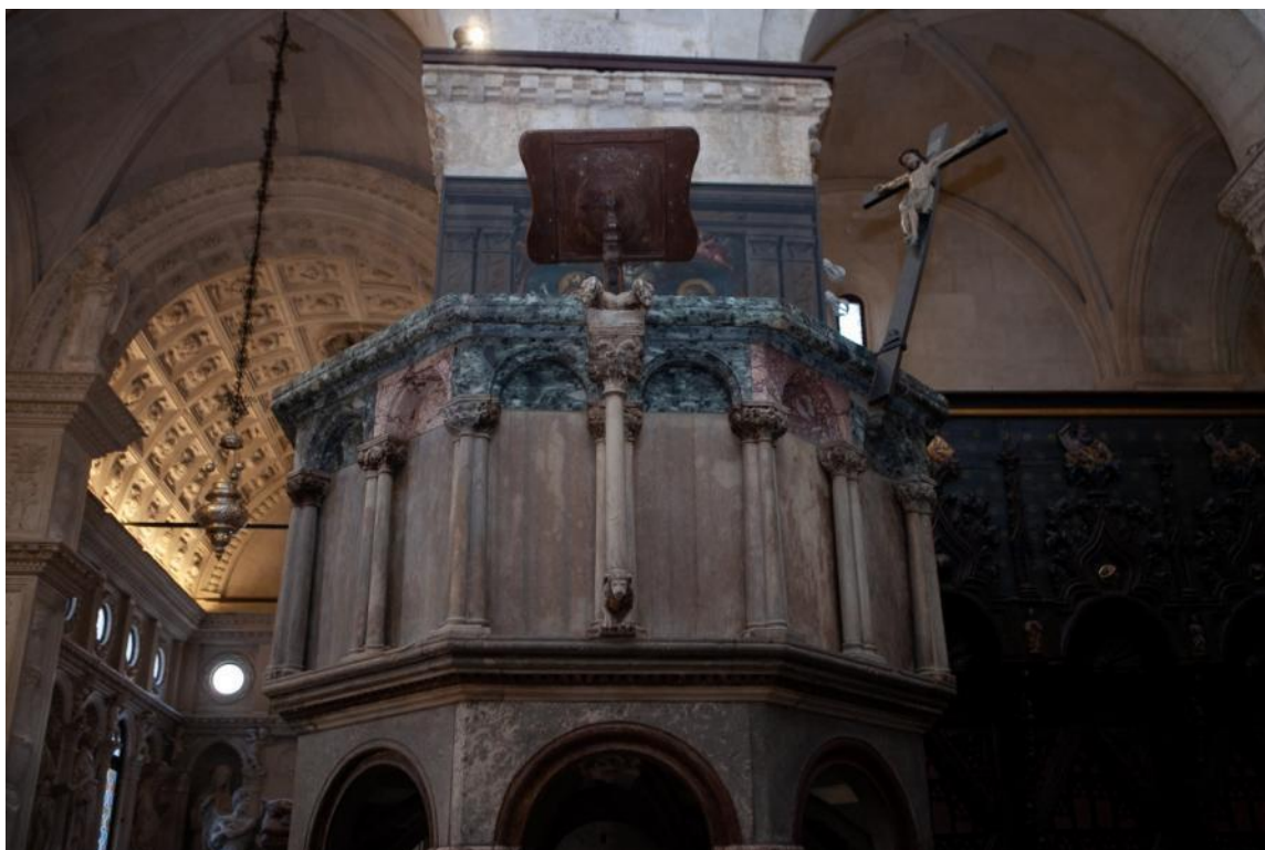
Slika 41. Parapet propovjedaonice katedrale Sv. Lovre u Trogiru