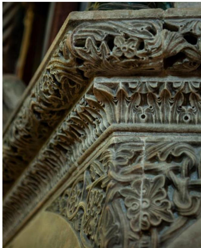
Slika 16. Detalj vijenca propovjedaonice katedrale Sv. Dujma u Split