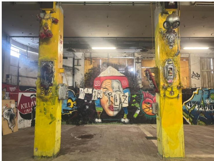
Slikovni prilog 16. Fotografija zidnih oslika i umjetničkih instalacija u MAAM-u.

ograničenja, pokušaj poticanja inkluzivnijeg i pragmatičnijeg razumijevanje čovječanstva. Promišljanje mjesta čovjeka u svemiru i međuljudskih odnosa, osnovna su ideja ovog umjetničkog pothvata, kao i prihvaćanje potencijala za radikalno drugačiju budućnost.