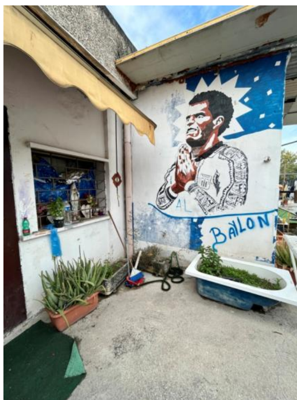
Slikovni prilog 12. Fotografija dijela fasade stana sugovornice S.