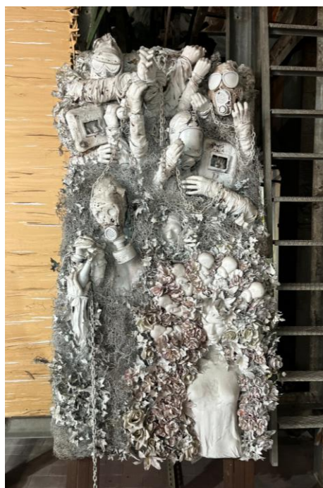
Slikovni prilog 17. Fotografija umjetničkog djela izloženog u MAAM-u.