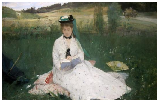
[Il.4] Berthe Morisot, Reading, 1873. The Cleveland Museum of Art ( http://www.clevelandart.org )