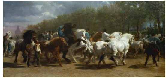
[Il.10] Rosa Bonehur, Sajam konja, 1855. Metropolitan Museum of Art, New York ( http://www.metmuseum.org )