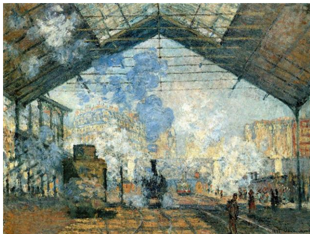
[Il.1] C. Monet, Unutrašnjost željezničke stanice Saint Lazare, 1877., Musee d' Orsay, Pariz ( http://www.musee-orsay.fr )