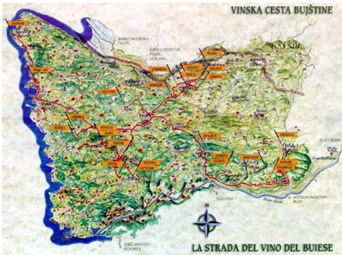
Slika 5. Vinska cesta Bujštine (Istra)