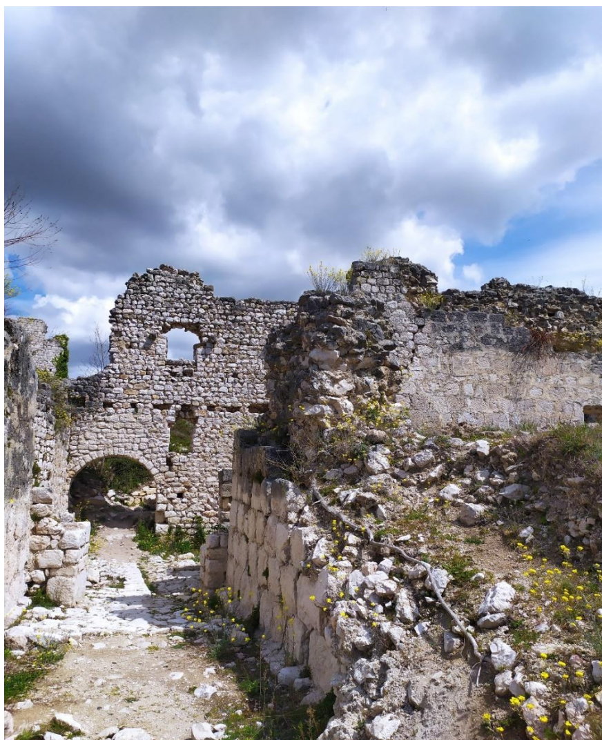
Prilog 2. Stari grad Vrana. Vrana, 20.4.2021.