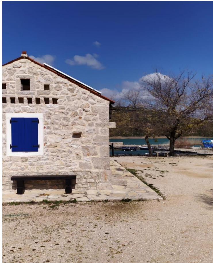
Prilog 5. Fotografija s terenskog istraživanja provedenog na Vranskom jezeru tijekom 2022. godine prikazuje obnovljenu ribarsku kućicu iz 19. stoljeća. Lea Jureković Biondić. Vransko jezero, 2022.