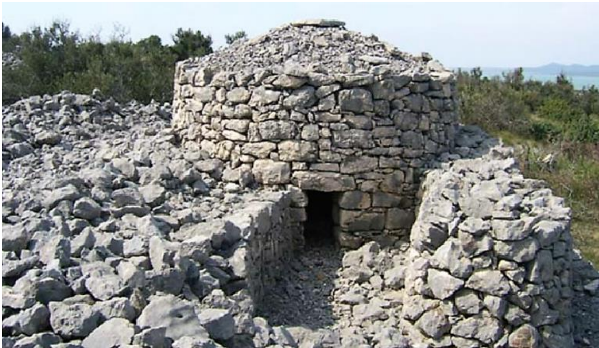
Prilog 3. Tradicionalna bunja na Modravama 5 (19.-20. st). Udruga Modrave Murter-Betina. Betina.