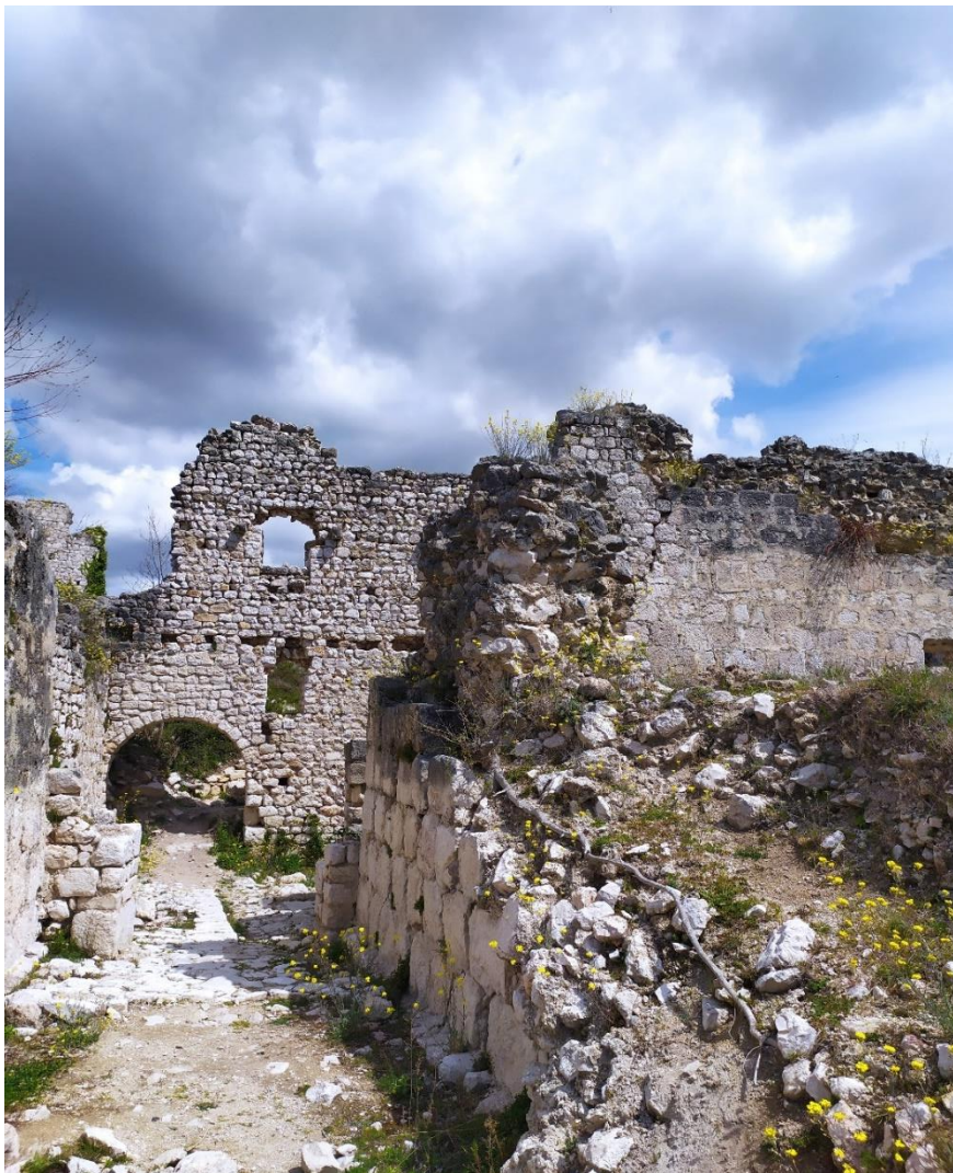
Prilog 2. Stari grad Vrana. Vrana, 20.4.2021.