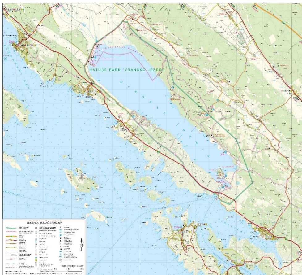
Prilog 1. Položaj 1 PP Vranskoga jezera. Park prirode Vransko jezero. Biograd na Moru, 2024.

Vransko jezero je 2 u suštini krško polje ispunjeno vodom, a osim toga je i kriptodepresija 3 po položaju, prema razini svjetskoga mora. Najplići dio jezera leži u njegovom sjeverozapadnom dijelu, od pola do jednog metra, dok je najdublji prema jugoistočnom dijelu i ondje zapravo i doseže najveću dubinu od četiri do šest metara. Upravo radi svoje plitkoće, njegova voda je podložna naglim promjenama temperature, ovisno o temperaturi zraka. Osim toga, Park prirode Vransko jezero ima blagu mediteransku klimu. Prosječna mjesečna temperatura zraka oscilira od 6,6 °C u siječnju, koji je i najhladniji mjesec, te do 24,5 °C u srpnju koji je najtopliji mjesec (JU PP Vransko jezero 2010: 19). Adulnar i Kolarić (2020: 10) ističu kako je Vransko jezero, reljefno gledano, najniža točka Ravnih kotara. Vodni režim u jezeru ovisi o količini padalina, a tijekom ljeta može doći do smanjenja količine vode, naročito za vrijeme sušnih razdoblja. S