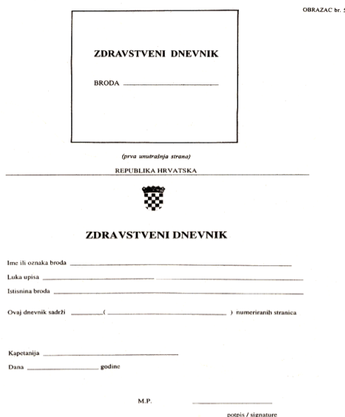
Slika 4. Zdravstveni dnevnik u RH

dobrobiti posade ključno je za sigurnost plovidbe pa zdravstveni dnevnik pomaže u osiguravanju da posada bude zdrava, sposobna za obavljanje svojih dužnosti i brzo reagiranje u slučaju medicinskih hitnih situacija i nezgoda na brodu.