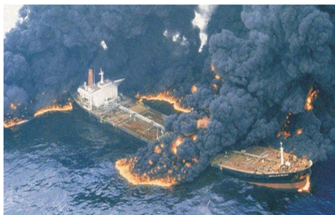
Slika 3. Nesreća tankera Castillo De Bellver [8]

Godine 1983. španjolski tanker Castillo De Bellver zapalio se u Saldanha zaljevu (Slika 3.) i u Atlantski ocean ispustio 78,5 milijuna galona nafte [6]. U nesreći je poginulo troje članova posade. Zapaljeni brod je napušten, a nakon raspada otplutao je u more. S obzirom na to da je mrlja putovala prema moru smatra se da su utjecaji na kopno zanemarivi. S druge strane utjecaj je bio itekako vidljiv u pogledu nauljivanja 1500,00 jedinki ganata na obližnjem otoku. Utvrđeno je da je određeni broj tuljana u blizini nesreće isplivao na površinu, premda se nije smatralo da su zbog toga pretrpjeli neke značajnije posljedice. Više je zabrinjavala crna kiša kapljica ulja u zraku koje su pale u prva 24 sata nakon nesreće [7].