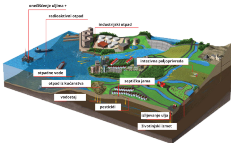
Slika 1. Uzroci onečišćenja mora otpadnim vodama [1]

unije za regiju Baltičkog mora. Strategija zapravo treba ograničiti prekomjerno ispuštanje komunalnih otpadnih voda i poljoprivrednih uzročnika za koje je utvrđeno da su glavni uzročnici opterećenja hranjivim tvarima koje dovode do eutrofikacije [4].