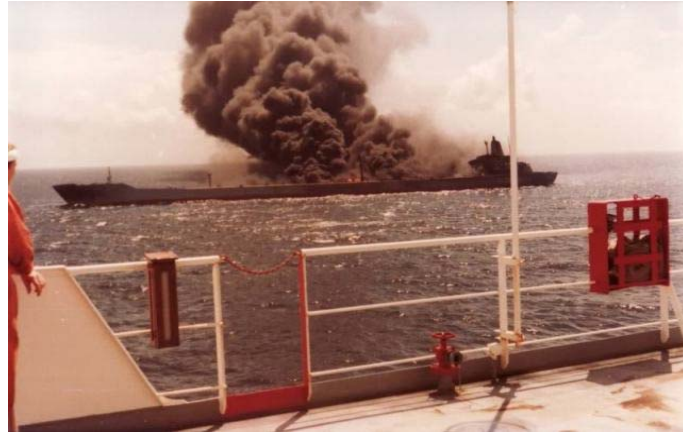
Slika 2. Atlantic Empress u požaru nakon nesreće [5]

opasnim teretom) postaju de facto zaraženi (na engleskom jeziku koristi se sintagma „ maritime leprosy “).