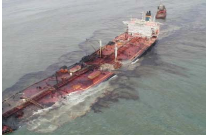
Slika 5. Tanker Tasman Spirit [10]

Među najvećim pomorskim nesrećama koje su uzrokovale veliko onečišćenje svakako spada ona iz 2010. godine kada je eksplozija Deepwater Horizon platforme (Slika 6.) uzrokovala izlivanje više od 4,6 milijuna litara sirove nafte. U ovoj nesreći nije došlo samo do onečišćenja mora već i obale i to u rasponu od oko 7 tisuća kilometara obalnog područja. Nakon dva tjedna čitava platforma je potonula. Oko 8.000,00 barela nafte je svakoga dana istjecalo u more. Nakon što se platforma raspala, odnosno samo nekoliko dana nakon eksplozije zabilježena su nova curenja nafte. U roku dva tjedna naftna mrlja je došla do obale američkih saveznih država. Najviše je pogođena država Louisiana. Ova morska katastrofa proglašena je jednom od najvećih u američkoj povijesti. Onečišćene su vode, zrak te čitavi životinjski svijet [11].