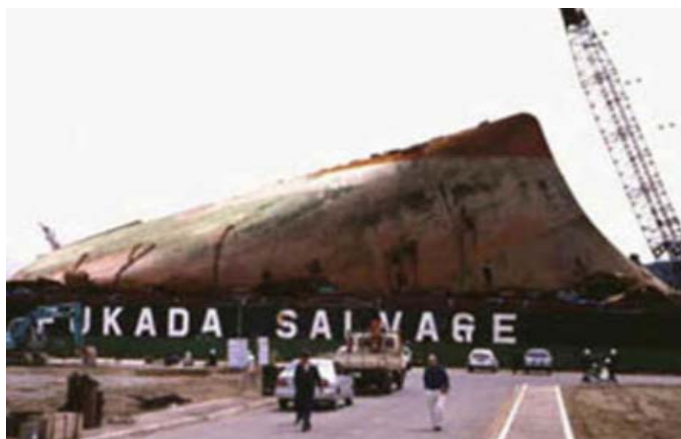
Slika 4. Pramčani dio broda Nakhodka nakon nesreće [9]

brod je u ovoj nesreći prevezio 19.000,00 tona nafte [3]. Prve mrlje nafte do japanske obale nakon pet dana od nesreće, te su malo po malo pogođeni obalni ribolovi, turističke aktivnosti, uzgoj ribe i nekoliko prirodnih mjesta. Pramčani dio broda nasukao se na obali (slika 4), a krmeni potonuo s dijelom tereta. U akcijama čišćenja sudjelovalo je čak preko 200.000,00 ljudi kojima je trebalo više od mjesec dana da izvuku svu naftu [9].