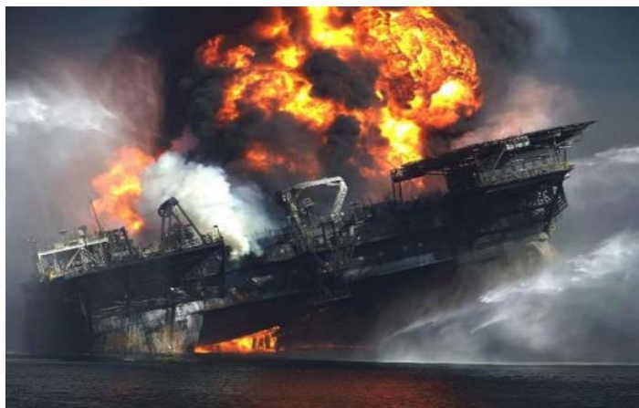
Slika 6. Platforma Deepwater Horizon [11]

Među najvećim pomorskim nesrećama koje su uzrokovale veliko onečišćenje svakako spada ona iz 2010. godine kada je eksplozija Deepwater Horizon platforme (Slika 6.) uzrokovala izlivanje više od 4,6 milijuna litara sirove nafte. U ovoj nesreći nije došlo samo do onečišćenja mora već i obale i to u rasponu od oko 7 tisuća kilometara obalnog područja. Nakon dva tjedna čitava platforma je potonula. Oko 8.000,00 barela nafte je svakoga dana istjecalo u more. Nakon što se platforma raspala, odnosno samo nekoliko dana nakon eksplozije zabilježena su nova curenja nafte. U roku dva tjedna naftna mrlja je došla do obale američkih saveznih država. Najviše je pogođena država Louisiana. Ova morska katastrofa proglašena je jednom od najvećih u američkoj povijesti. Onečišćene su vode, zrak te čitavi životinjski svijet [11].