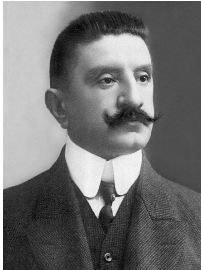
Slika 3. Rikard Katalinić Jeretov,

toga u njegovim basnama se pojavljuju i biljke i prirodne pojave („Priča o mladoj trešnji“). Njegove basne su pisane u prozi. Pouka nije očita, već je čitatelj mora sam pronaći. 10