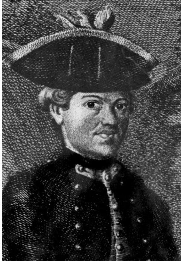
Slika 1. Matija Antun Relković, https://enciklopedija.hr/Natuknica.aspx?ID=52390 (pristupljeno 28. 12. 2023)