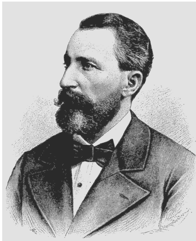
Slika 2. Ivan Filipović

najstrašnije živine.” U toj basni možemo vidjeti suprotnosti karaktera lava i srne. Lav je bezobziran i bezosjećajan, gleda samo sebe, što možemo vrlo lako vidjeti u svojoj okolini, a simbolizira i moć i vlast koja uništava slabe i nemoćne da bi zadržala svoju nemilosrdnu strahovladu. Srna je jadna i nesretna žrtva koja tražeći spas nađe smrt i u svemu tome je prikazala osobu koja nema sreće. Autor je ovdje preradio Ezopovu basnu „Košuta i lav“. U toj basni lovci su natjerali košutu u pećinu gdje ona naiđe na lava koji ju razdere. Pouka i jedne i druge je da nekad bježeći od jedne opasnosti upadamo u još veću. Ako djeci na taj način približimo basnu, i ona ju mogu shvatiti. Jer takvih karaktera ljudi možemo naći svuda oko nas. Možemo motivirati djecu da i oni pokušaju oko sebe pronaći slične primjere.