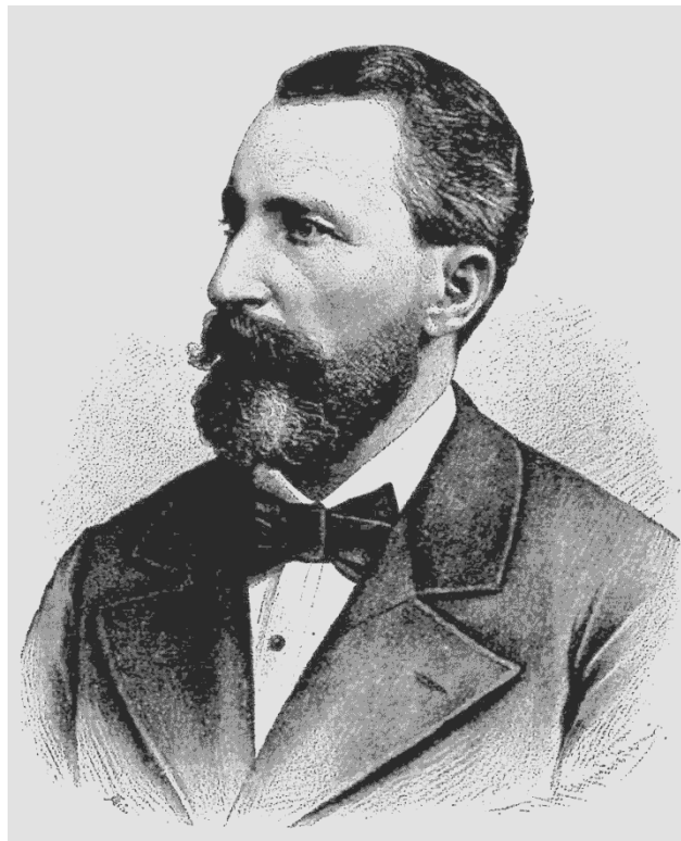
Slika 2. Ivan Filipović, ( https://hr.wikipedia.org/wiki/Ivan_Filipovi%C4%87 , pristupljeno 28. 12. 2023)

najstrašnije živine.” U toj basni možemo vidjeti suprotnosti karaktera lava i srne. Lav je bezobziran i bezosjećajan, gleda samo sebe, što možemo vrlo lako vidjeti u svojoj okolini, a simbolizira i moć i vlast koja uništava slabe i nemoćne da bi zadržala svoju nemilosrdnu strahovladu. Srna je jadna i nesretna žrtva koja tražeći spas nađe smrt i u svemu tome je prikazala osobu koja nema sreće. Autor je ovdje preradio Ezopovu basnu „Košuta i lav“. U toj basni lovci su natjerali košutu u pećinu gdje ona naiđe na lava koji ju razdere. Pouka i jedne i druge je da nekad bježeći od jedne opasnosti upadamo u još veću. Ako djeci na taj način približimo basnu, i ona ju mogu shvatiti. Jer takvih karaktera ljudi možemo naći svuda oko nas. Možemo motivirati djecu da i oni pokušaju oko sebe pronaći slične primjere.