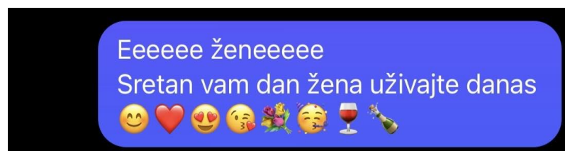
Slika 1. (Messenger, 8.3. 2024.)

Sljedeći primjer prikaz je komunikacijskih tekstova koji je su popraćeni emotikonima i skraćenicama: