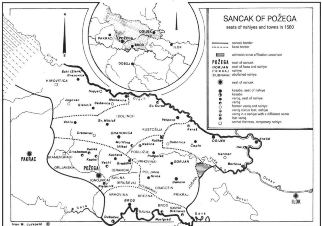
Slika 1. Karta sandžaka Požega (preuzeto iz N. Močanin, 2006, str. XIII).