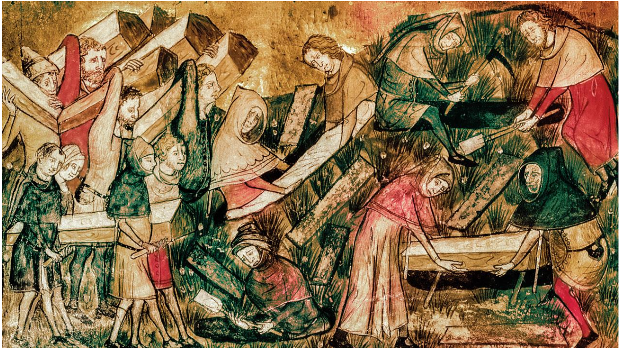
Slika 3 Najraniji prikaz utjecaja kuge -prikazuje ljude kako nose ljesove onih koji su umrli od bolesti u Tournaiju, dan. Belgija, 1349.

različitosti spolova te kako se smatra da žene ili muškarci mogu ili ne mogu konzumirati određene namirnice, s dozom banalnosti da muškarci ne mogu konzumirati hladnu salatu.