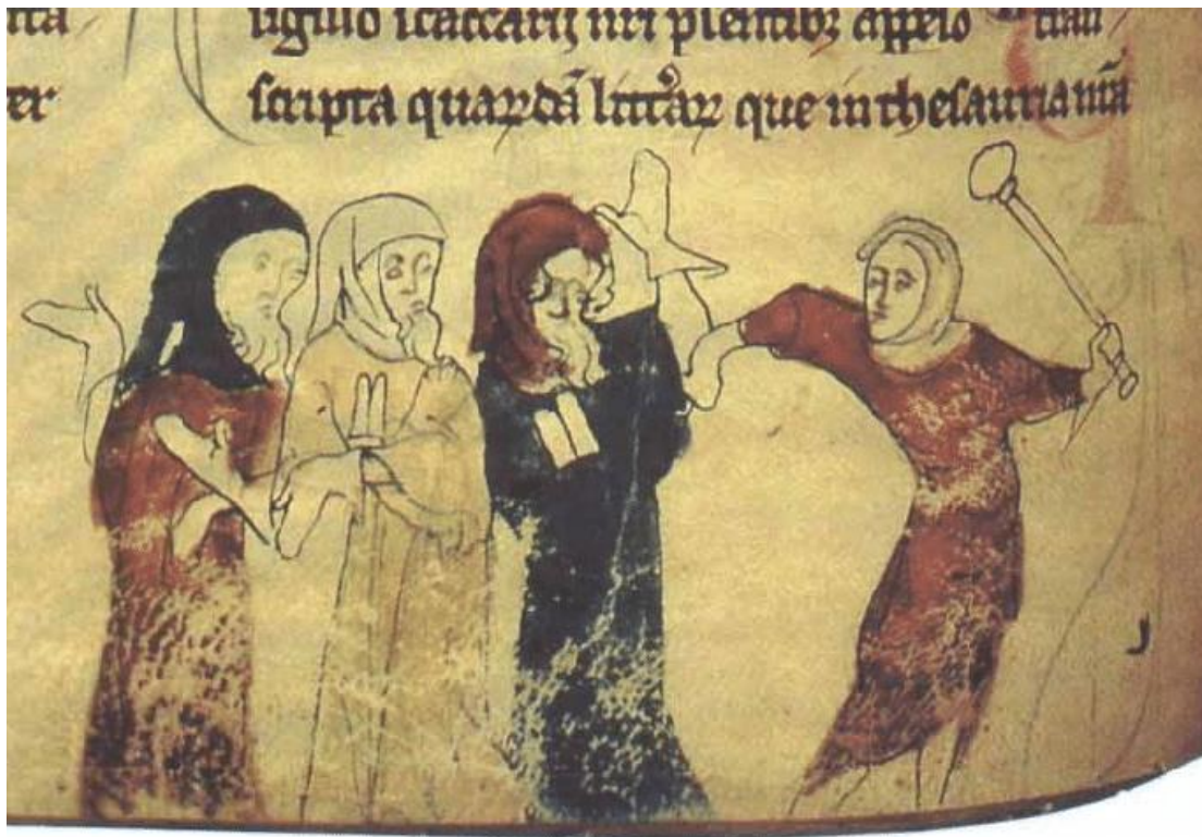
Slika 2 Premlaćivanje engleskih Židova dok su nosili židovsku značku kako je propisano engleskim zakonom iz 1218. Bedž je bijele boje i u obliku ploča s deset zapovijedi. Ilustracija je iz djela "Chronicle of Rochester Cathedral Priory" nastalog 1307. godine

Nakon protjerivanja Židovi iz Engleske naseljavaju se u Francusku, ali nisu se tamo dugotrajno zadržali jer ih već 1291. i 1299. kralj Filip IV. protjeruje kroz edikte koji se vjerojatno nisu efikasno provodili, ali zato odlukom iz 1306. naredbe su ozbiljnije shvaćene i Židovi su protjerani iz Francuskog Kraljevstva, također jer im je kralj bio dužnik, a nije imao sredstava za vratiti dugove. Tako se onda „izabrani narod“ seli preko pola Europe i jedan dio naseljava područje Pirinejskog poluotoka, a drugi dio Sveto Rimsko Carstvo. Prije 1306. godine u SRC-u je postojala židovska zajednica koju tamošnji stanovnici na jednak način nisu prihvatili jer već postojale optužbe da su Židovi ubili kršćansku djecu i njihovu krv iskoristili za vjerske obrede (1281. i 1283. u Mainzu, 1285. u Münchenu). Nedugo zatim dolazi i do masakra u Röttingenu 1298. gdje su tamošnji Židovi optuženi da su ukrali hostiju iz crkve te je organizirana grupa pod vodstvom plemića Rindfleischa pogubila članove židovske zajednice u tom gradu i još 130 raznih naselja od travnja do listopada. Car Albert I. Zatražio je da se pokolji zaustave i kaznio nekoliko gradova što su sudjelovali u ovim radnjama, ali relativno se ništa