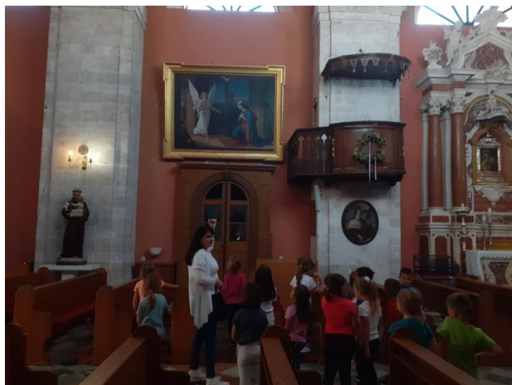
Slika br. 10: Razgledavanje unutrašnjosti crkve Porođenja Blažene Djevice Marije