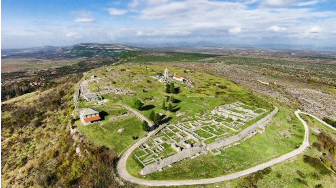
Slika br. 3: Bribirska glavica