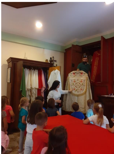
Slika br. 8: Razgledavanje liturgijskog ruha u sakristiji