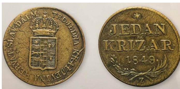
Slika 9 Avers i revers križara bana Josipa Jelačića iz 1849., tip grba sa sjedinjenim grbom Trojedne Kraljevine (Dubravka PEIĆ ČALDAROVIĆ, Nikša STANČIĆ, Povijest hrvatskoga

Druga varijacija grba je „sjedinjeni grb u kojemu su grbovi Dalmacije, Hrvatske i Slavonije sjedinjeni u zajedničkom štitu“. U prvoj varijaciji su grbovi odvojeni, dok su ovdje sjedinjeni u jedinstveni štit, također različitog rasporeda, a koristili su se istovremeno 1860-ih godina. Bitna instanca korištenja druge varijacije grba Trojednog Kraljevstva jest na kovanom novcu bana Jelačića, križaru , koji se pojavio samo godinu dana nakon njegove banske zastave koja je koristila prvi tip grba s odvojenim štitovima. 101